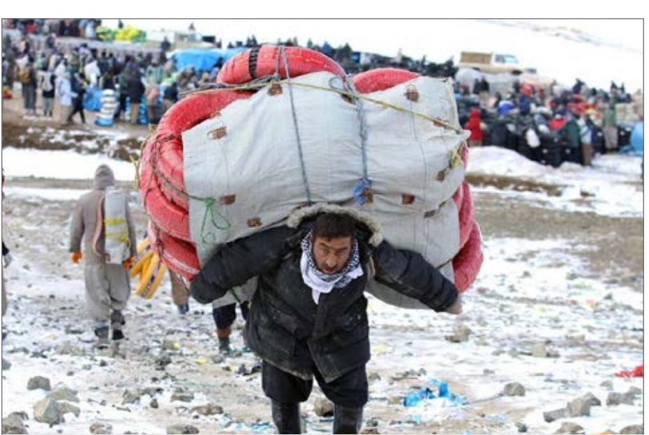
آیین‌نامه مبادلات در بازارچه‌های موقت مرزی به درستی اجرا نمی شود

در بین جامعه محلی مرزنشینی به شخصی اطلاق می‌شود که به صورت مجاز یا غیرمجاز کالایی را از آنسوی مرز به این سوی مرز حمل می‌کند اما در طرح ساماندهی مبادلات در بازارچه‌های غیررسمی دولت واژه کولبر را حذف و پيلهور را جایگزین آن کرد.به طوری که از نظر این طرح پيلهور به شخصی اطلاق می‌شود که به صورت قانونی از معابر رسمی اقدام به حمل کالاهای مجاز از آن سوی مرزها به داخل مرز کشور می‌کند و در قبال آن از برخی معافیت‌های قانونی بهره‌مند