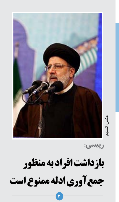
رییس: بازداشت افراد به منظور جمع آوری ادله ممنوع است