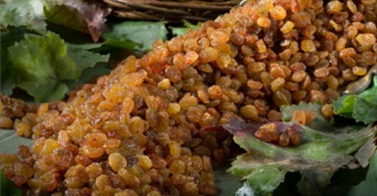
ایران با محوریت آذربایجان شرقی، رتبه نخست جهانی در تولید و صادرات کشمش را در سال‌های قبل در اختیار داشت