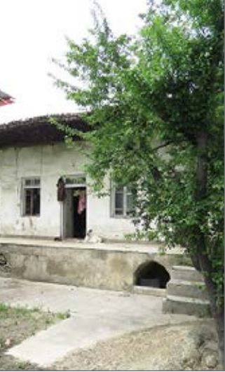
علی اصغر موسسان

شواهدی از وجود میتراییان یافت نشده ولی احتمالاً آیین‌های زُروانی و مهرپرستی رایج بوده است.