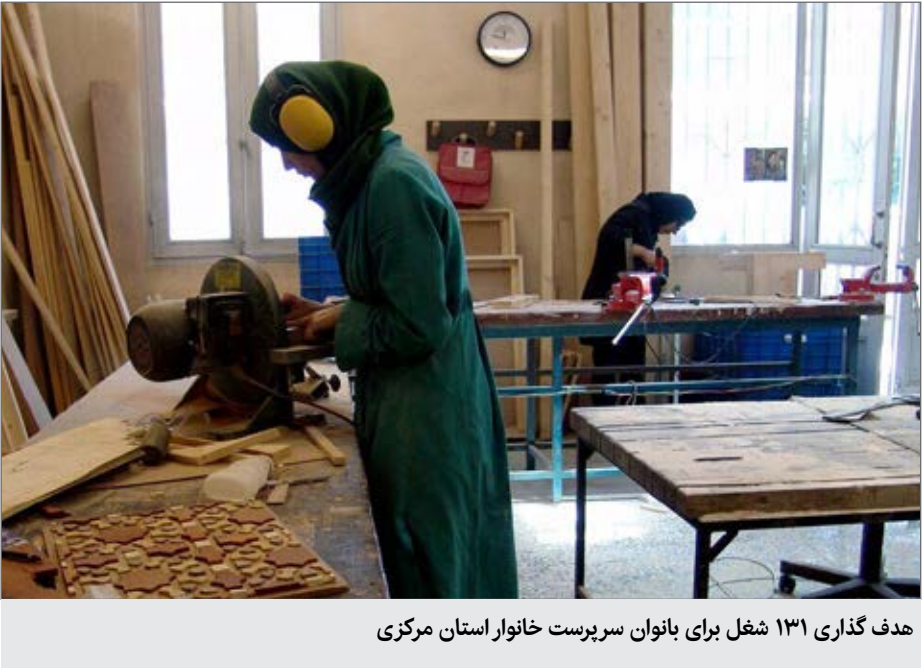
هدف گذاری ۱۳۱ شغل برای بانوان سرپرست خانوار استان مرکزی

بیش از سه میلیون زن در کشور، سرپرست خانوار هستند و ۷۱ درصد آنها زانی هستند که همسرانشان فوت کرده اند و ۱۱ درصد نیز زانی هستند که طلاق گرفته اند و بقیه هم شامل مواردی است که ازدواج نکرده اند.