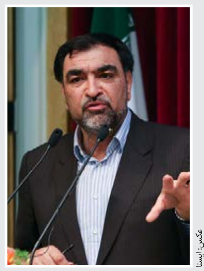
رئیس دیوان محاسبات کشور خبر داد افزایش سالانه شرکت‌های دولتی زیان ده