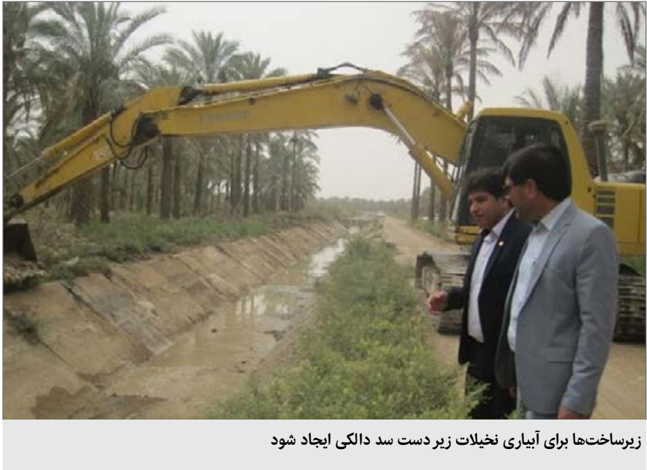
زیرساخت‌ها برای آبیاری نخیلات زیر دست سد دالکی ایجاد شود

در زمان حاضر بیش از ۷ میلیون اصله نخل در قالب ۳۴ هزار و ۵۰۰ هکتار در استان بوشهر