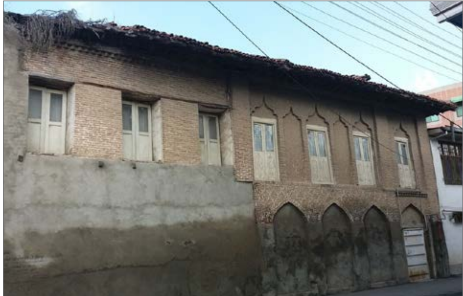
خانه تاریخی شیخ کبیر ۱۵۰ سال قدمت دارد

این خانه تاریخی متعلق به دوره قاجاریه با با آجر و مصالح ساروج و آهک ساخته شده است، اما تعمیر بخشی از نمای بیرونی این خانه تاریخی با بتن در سال های اخیر هم سبب شده تا نمای آن چنان زشت جلوه کند که کسی متوجه تاریخی بودن آن نشود. با این وصف سقف خانه شیخ کبیر شیروانی و سفال بام است و زیر سقفش هم چوب به کار رفته است. درب و پنجره