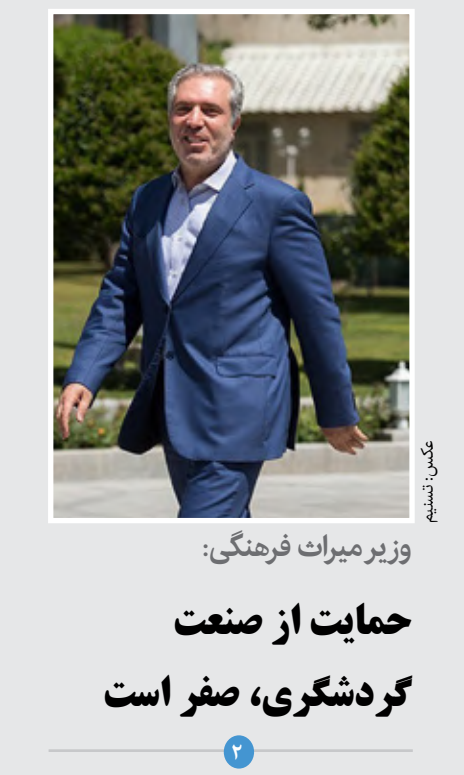
وزیر میراث فرهنگی: حمایت از صنعت گردشگری، صفر است