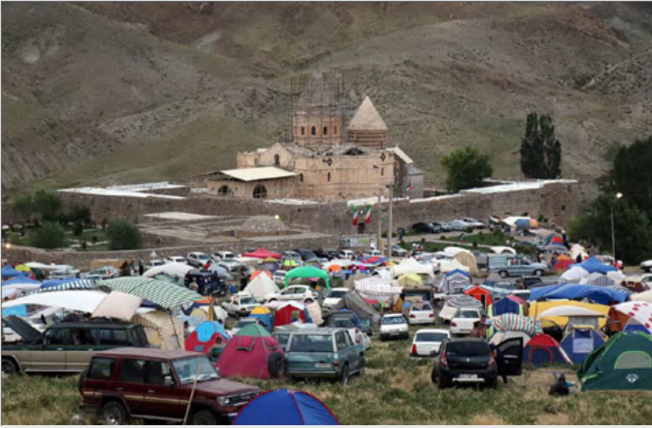
بنای قره‌کلیسا جزو ۲ اثر ثبت شده جهانی آذربایجان‌غربی است

صیانت از این اثر جهانی در حای طی سال‌های اخیر در دستور کار مسوولان قرار گرفته که اعتبار مربوط به مرمت