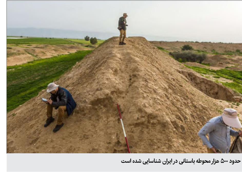
حدود ۵۰۰ هزار محوطه باستانی در ایران شناسایی شده است

رئیس پژوهشکده باستانشناسی پژوهشگاه میراث فرهنگی و گردشگری گفت: از طریق پژوهشگاه میراث فرهنگی اعتبارات هرچند محدود برای باستان شناسی در نظر گرفته شده است و بر اساس منابع در اختیار برای آن برنامه