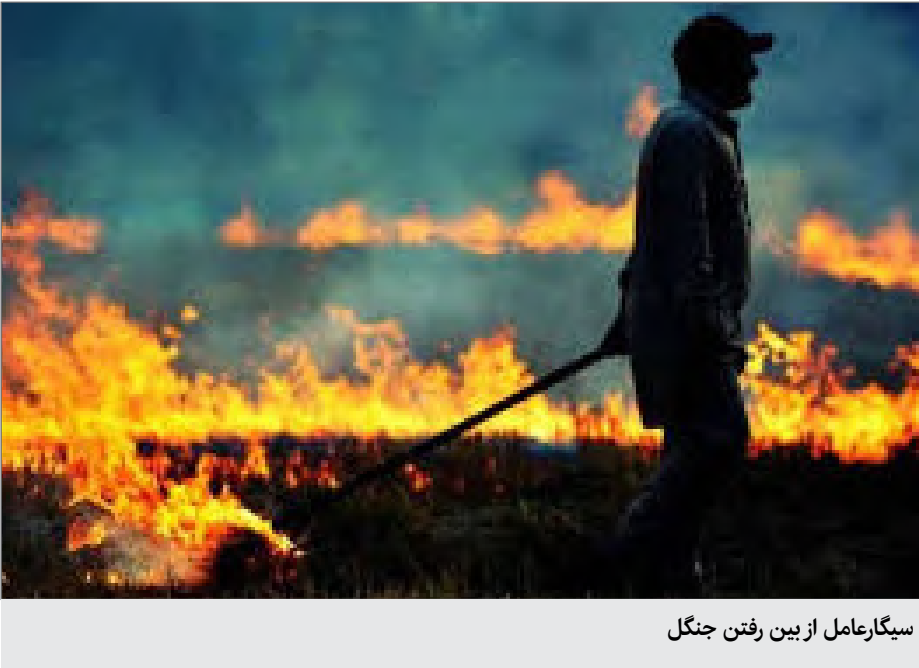
سیگارعامل از بین رفتن جنگل

وی با بیان اینکه فصل بحرانی در سال ۹۸ نسبت به سنوات گذشته ۱۰ روز زودتر آغاز شد، ادامه داد: عاملی که باعث شد تا میزان آتش‌سوزی در سال ۹۸ نسبت به سال ۹۷ افزایش پیدا کند ریزش نزولات آسمانی در فروردین‌ماه بود که عدم پراکنش مناسب بارش منجر شد تا گیاهان یکساله که وجود آنها برای مراتع ضروری است، به شدت رشد کرده و در فصل گرما خشک شدند همچنین با توجه به تقویم کوچ، دام ها زمانی وارد مراتع شدند که گیاهان تازه فصل بحرانی که از ۲۰ خردادماه امسال آغاز شده و تا نزول نخستین بارش‌ها