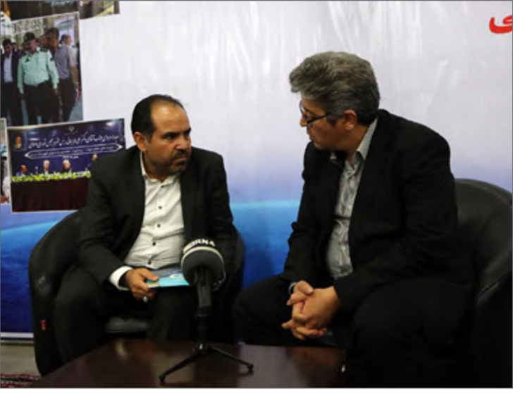
تکریم در این نمایشگاه وارد گفت و گو شده ایم که هم اکنون با اجرای این طرح نهضت ترجمه راه افتاده و آثار زیادی از جمهوری اسلامی به صورت خودجوش ترجمه شده است.