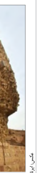
مجموعه تاریخی شهرک دانشگاهی ربع رشیدی در سال ۱۳۵۴ شمسی به ثبت ملی رسیده است

در ۲ فصل کاوش های انجام شده در شهرک تاریخی دانشگاهی ربع رشیدی، باقیمانده آثاری از دوران ایلیخانی، کشف و مشخص شد که