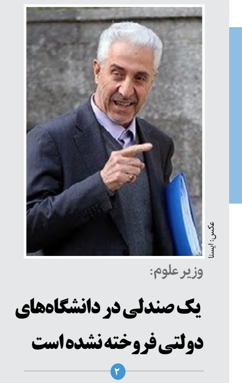
وزیر علوم: یک صدلی در دانشگاه‌های دولتی فروخته نشده است