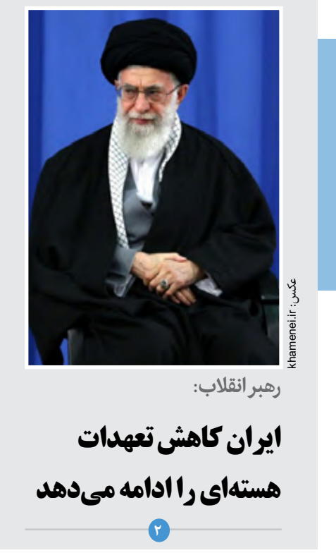
رهبر انقلاب: ایران کاهش تعهدات هسته‌ای را ادامه می‌دهد