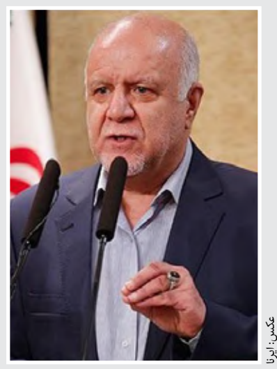
وزیر نفت: سهمیه کارت سوخت جایگاه‌داران کاهش می‌یابد