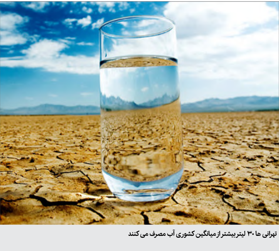
تهرانی ها ۳۰ لیتر بیشتر از میانگین کشوری آب مصرف می کنند

مدیرکل دفتر مدیریت مصرف آبفای کشور گفت: به طور میانگین هر متر مکعب آب ۴۶۰ تومان از سوی دولت به فروش می‌رسد. این در حالی است که یک بطری آب آشامیدنی نیم لیتری در بازار با نرخ ۱۵۰۰ تومان فروخته می‌شود و این تفاوت فاحشی را نشان می‌دهد. به گزارش خبرنگار اقتصادی