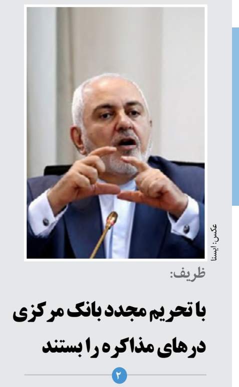
تاریف: با تحریم مجدد بانک مرکزی درهای مذاکره را بستند