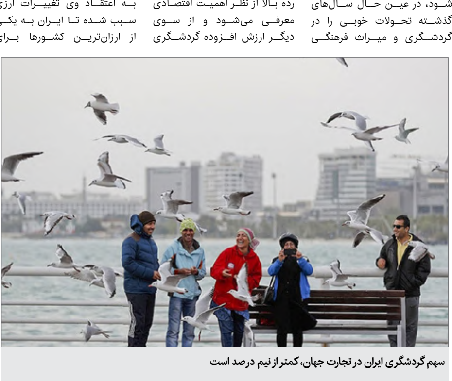
سهم گردشگری ایران در تجارت جهان، کمتر از نیم درصد است

شاهد بودیم و به درستی در خود دولت نیزتوجه خاصی به این موضوع می‌شود و با این حال ثبات نداشتن در مدیریت گردشگری کشور در سال‌های گذشته بیشترین آسیب را به این صنعت وارد ساخت. وی افزود: امروزه صنعت گردشگری از نظر درآمد و اشتغال با صنعت نفت و خودروسازی در کشور مقایسه می‌شود؛ در واقع این صنعت در رده بالا از نظر اهمیت اقتصادی معرفی می‌شود و از سوی دیگر ارزش افزوده گردشگری