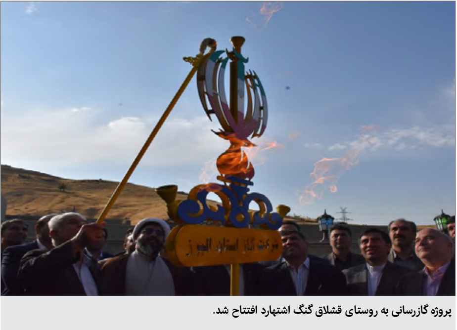
پروژه گازرسانی به روستای قشلاق گنگ اشتهارد افتتاح شد.

ایجاد زیرساخت‌های لازم برای توسعه صنعتی استان، قابل‌تقدیر و تشکر است.البته این مهم بدون همراهی و همکاری فرماندار، معاون فرماندار، بخشداران، دهیاران،شورها، منابع طبیعی، راهداری و همه‌کسانی که پیگیری‌های مجدانه داشتند، محقق نمی‌شد. وی باییان اینکه باهمت و تلاش مسئولین می‌توان، توسعه و پیشرفت را در کل استان البرز شاهد بود اظهار داشت: شرکت گاز استان البرز با تمام قدرت و توان آمادگی همکاری با سایر سازمان ها، در جهت توسعه و آبادانی این استان را دارد. مدیرعامل شرکت گاز استان البرز