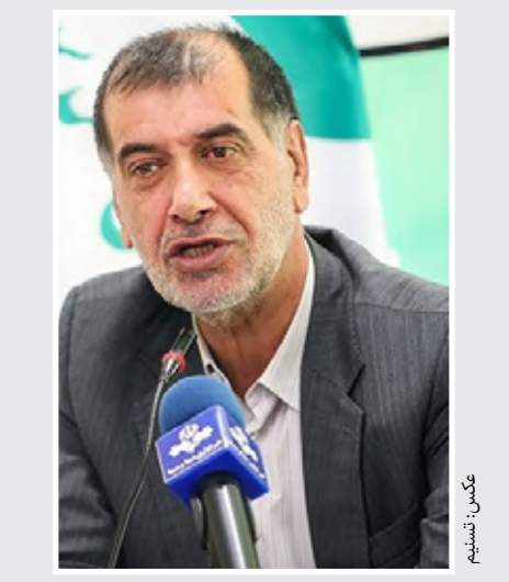
محمدرضا باهنر: شاید وحدت اصولگرایان صد در صدی نباشد