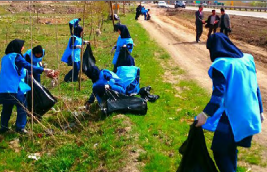
کم لطفی وبیمهری به محیط زیست در ایران وجود دارد

عضو کمیسیون فرهنگی مجلس گفت: در بحث تغییرات اقلیمی و گرمایش زمین اغلب کشورهای جهان برنامه‌های دارند و در جهت کاهش اثرات حرکت می‌کنند اما ما همچنان بر اجرای اقدامات نا کارآمد و کوتاه‌مدت پافشاری می‌کنیم؛ کم‌لطفی و بی‌مهری به محیط زیست فقط در بین مردم یا دولت نیست بلکه در لایه لای متون قانونی که در مجالس قبلی تصویب شده نیز فراوان مشهود است. به گزارش خبرنگاری خانه ملت،