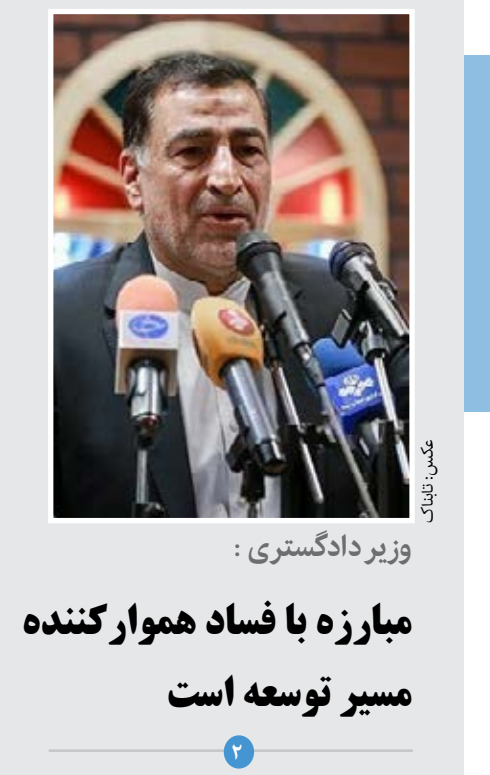
وزیر دادگستری: مبارزه با فساد هموار کننده مسیر توسعه است