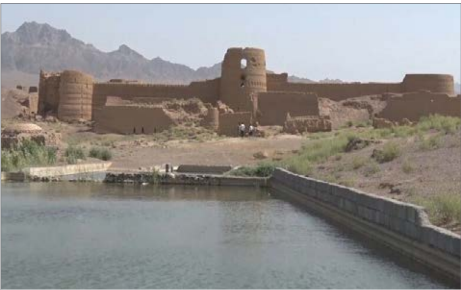
قلعه‌های خشتی موجود کشور منجمله در استان اصفهان هریک راوی تاریخ پرفراز و نشیب این سرزمین کهن هستند

برای مرمت واحیای بافت‌های تاریخی فرهنگی، که دو ماه پیش به تصویب نمایندگان مجلس رسیده بود، توسط شورای نگهبان تأیید شد.» نمایندگان در جلسه علنی، با تصویب کلیات طرح یک‌فوریتی حمایت از مرمت واحیای بافت‌های تاریخی فرهنگی و توانمندسازی مالکان و بهره‌برداران بناهای تاریخی فرهنگی با ۳۸ رأی موافق، ۳۶ رأی مخالف و ۴ رأی ممتنع از مجموع ۲۱۹ نماینده حاضر در جلسه موافقت کردند. روابط عمومی سازمان میراث‌فرهنگی اعلام کرد: شورای نگهبان نیز طرح