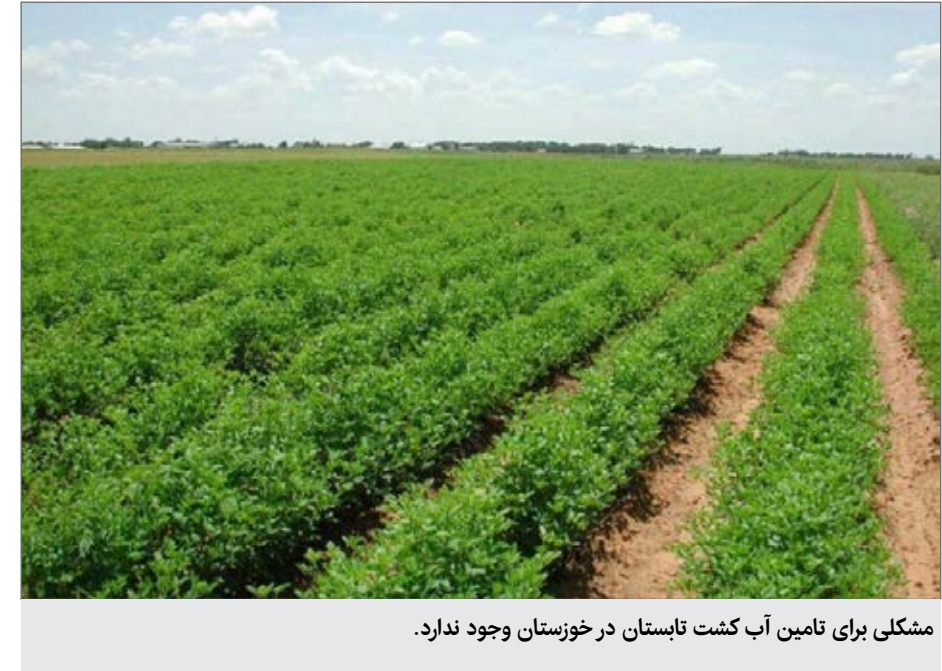
مشکلی برای تامین آب کشت تابستان در خوزستان وجود ندارد.

شبکه ها محدودیت کشت های پرمصرف اعمال می شود. ایزدجو با اشاره به نیاز نخिलات