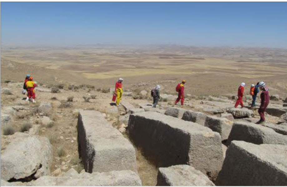
آثار سنگ تراشی منطقه «فرهادتاش» بی شباهت به تخت سلیمان نیست

چند صد سنگ مستطیلی شکل در عرض یک متر در دو متر و به ارتفاع یک متر هم قدمت با دوره ساسانیان به شکل کاملاً مشابه و یک اندازه برش داده شده و به شکل اسرارآمیزی در منطقه‌ای مرتفع رها شده‌اند.نه حکومتی بزرگ و تاریخی در این منطقه قرار داشته و نه اسنادی درباره تاریخ و چگونگی استفاده از این سنگها وجود دارد پس داستان چیست؟انقدر عجیب است که شاهدان آن را به یاد سنگ های اسرارآمیز کارناک در روستای فرانسوی کارناک می اندازد که احتمالاً بین سالهای ۳۳۰۰ و ۴۵۰۰ قبل از میلاد نصب شده اند و هنوز