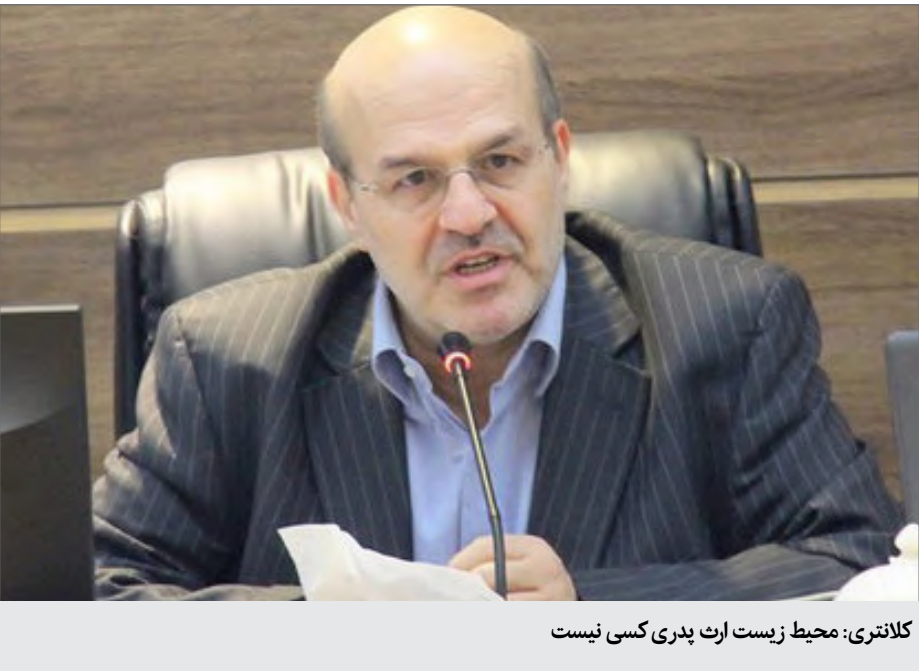
کلانتری: محیط زیست ارث پدری کسی نیست

شرط اساسی برای پرداختن به محیط زیست، گفتن است عیسی‌کلانتری پیش از این هم شرط اساسی برای پرداختن