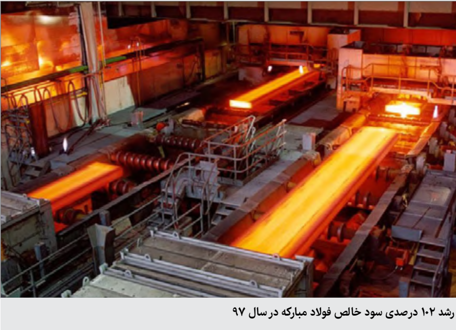
رشد ۱۰۲ درصدی سود خالص فولاد مبارکه در سال ۹۷

کشور را به خود اختصاص داده است. او ادامه داد: به همت کارکنان زحمتکش شرکت و با اجرای موفق طرح‌های توسعه در سال ۱۳۹۷، فولاد مبارکه موفق به تولید بیش از ۶ میلیون و ۳۴۳ هزار تن کلاف گرم و یکمیلیون و ۵۵۵ هزار تن کلاف سرد شد که در کلاف گرم رشد ۶ درصدی و در کلاف سرد رشد ۴ درصدی را شاهد بودیم. مدیرعامل فولاد مبارکه در ادامه به عملکرد درخشان شرکت در حوزه فروش اشاره کرد و افزود: طی سال ۱۳۹۷ این‌که گروه فولاد مبارکه با فروش بیش از ۶ میلیون و ۷۱۴ هزار تن انواع محصولات فولادی تخت شد که با رشد ۴۸