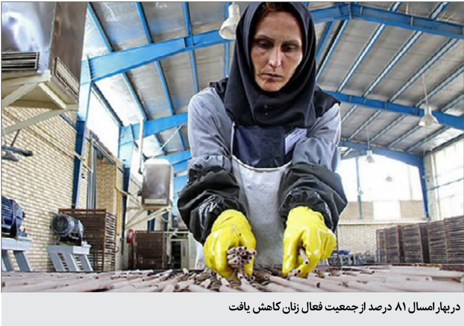
در بهار امسال ۸۱ درصد از جمعیت فعال زنان کاهش یافت

بر اساس بررسی‌های این مرکز که با عنوان «تحلیل شاخصهای بازار کار در فصل بهار ۱۳۹۸» در سه سال منتهی به بهار ۱۳۹۷، هر سال به طور متوسط ۹۸۵ هزار نفر به جمعیت فعال اضافه شده است که ۵۳ درصد از آن را مردان تشکیل می‌دهند. اما در