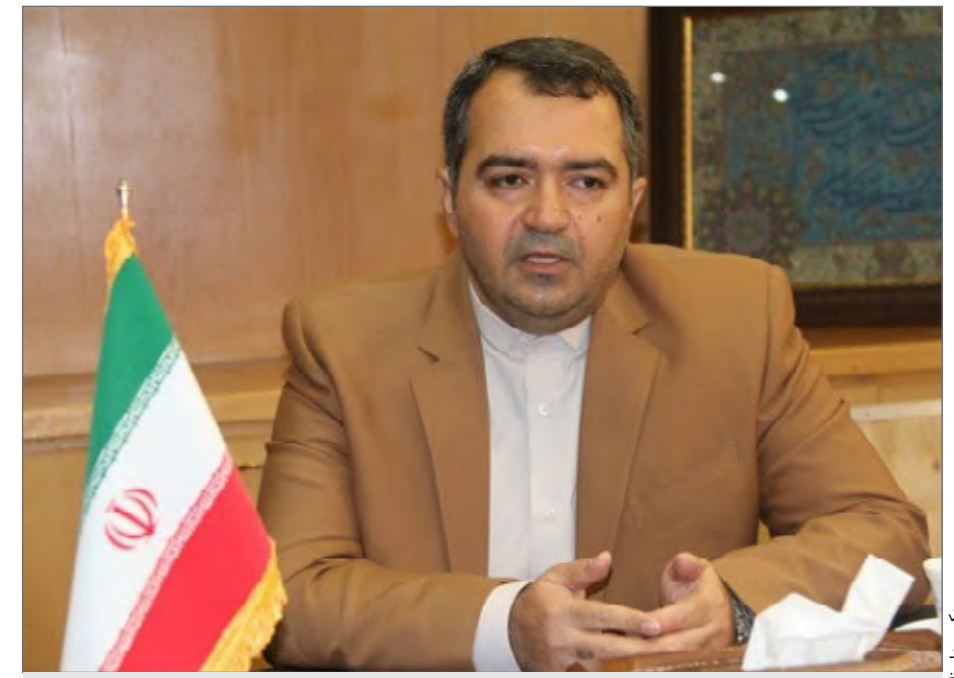
مهندس فلاح : خبر ارائه دو مقاله به چهارمین کنفرانس بین‌المللی پژوهش را رسانه ای کرد

خط با مشکلات کمتری روبرو می‌گردد. همچنین برای تامین سه راهه دو تکه نیاز به اخذ سفارش از کارخانه سازنده می باشد که تهیه آن را زمانبر می سازد در حالیکه تهیه صفحه تقویت کننده پروسه ساده تری دارد. به همین دلیل استفاده از اتصال تقویت شده بوسیله ورق باعث بهینه سازی در هزینه و زمان خواهد شد. با توجه به اهمیت موضوع امور پژوهش شرکت گاز استان کرمان به منظور بررسیهای بیشتر درباره موضوع فوق اقدام به تهیه پروپزال پژوهشی و ارسال به امور مهندسی و فناوری ملی گاز کرده است. در صورت تصویب و اجرایی شدن پروژه مورد نظر بسیاری از محدودیت های اجرایی رفع و در نتیجه از نظر اقتصادی و تسریع در پیشبرد پروژه های گازرسانی بسیار موثر خواهد بود.