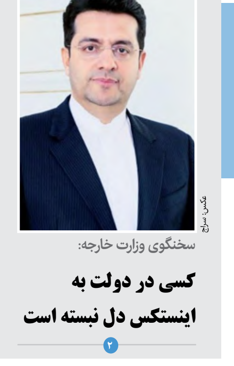
سخنگوی وزارت خارجه: کسی در دولت به اینستکس دل نبسته است