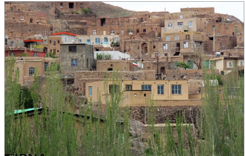
روستای «سرخنگ» از توابع شهرستان درمیان و در فاصله ۶۵ کیلومتری مرکز استان خراسان جنوبی است

رئیس شورای اسلامی روستای سرخنگ بیان کرد:در این مواقع اگرنیاز به حضور آمبولانس یاآتشنشانی باشدتکلیف چیست؟چطورباید این صف خودروها را در کوچه‌های باریک شکست و به روستا امدادسانی کرد؟ وی با بیان اینکه ساخت پارکینگ مناسب قبیل از ورودی روستا یک