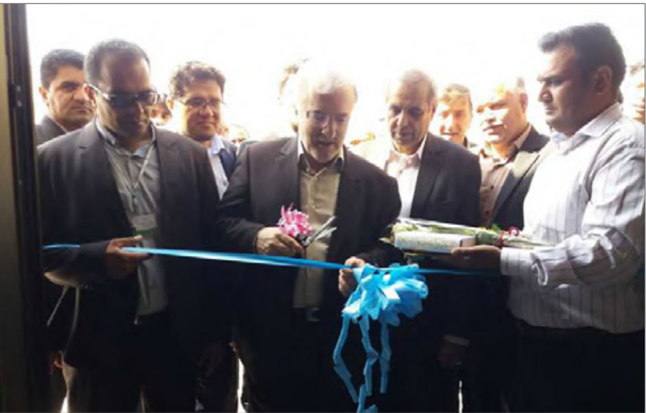
در سفر وزیر بهداشت به بم ۲ پروژه درمانی افتتاح شد

وزیر بهداشت ضمن اشاره به پروژه های در حال اجرای شهرستان بم تصریح کرد: امیدواریم با تدوین یک برنامه زمان بندی شده در شهرستان