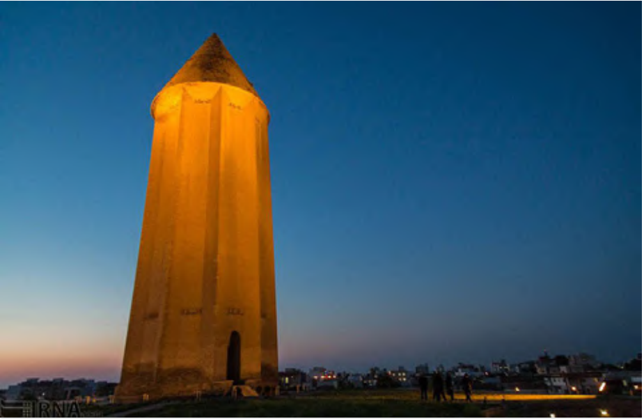
ثبت جهانی گنبدقابوس در فهرست آثار تاریخی یونسکو در ۱۰ تیرماه ۱۳۹۱ محقق شد

اسلامی و شاهکاری از عصرطلایی جهان اسلام در قرون ۳ و ۴هجری قمری و نیزشاهدی برنگاه مهندسی و دانش معماری اسلامی می‌داند.به شماره ۸۶در سال ۱۳۱۰خورشیدی در فهرست آثار میراث فرهنگی کشور هم به ثبت رسیده است. این شاهکار معماری اسلامی که بر روی تپه‌ای به بلندی ۱۵ متر قرار گرفته، ۵۵ متر ارتفاع دارد که با احتساب بلندی تپه، ارتفاع آن در مجموع به ۷۰ متر می‌رسد و اجر و ملات گچ از مصالح اصلی ساخت آن است.بدنه خارجی مدور این بنا دارای ۱۰ ترک(مانند ستاره ۱۰ پر)است که به فواصل مساوی از یکدیگر قرار دارند و در هر ترک آن عبارتی آجری