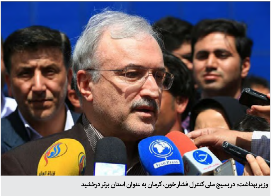
وزیر بهداشت: در بسیج ملی کنترل فشارخون، کرمان به عنوان استان برتر درخشید

عجیب و پر از رمز و رازهای فراوان است، اظهار کرد: بعد از انقلاب دستاوردهای زیادی در عرصه‌های مختلفه داشته‌ایم که نفیس‌ترین دستاوردهای ما در عرصه نظام سلامت بوده است. وی افزود: قبل از انقلاب از هر یک‌هزار کودکی که به دنیا می‌آمد، (متوسط کشور) حدود ۱۲۰ مورد به یک سالگی نمی‌رسیدند و از هر ۱۰۰ هزار زن باردار ۲۷۰ نفرشان از دست می‌رفتند . نمکی تصریح کرد: دستاوردهای