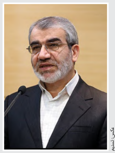
سخنگو شورای نگهبان: انقلاب اسلامی به حزب یا جناح خاصی تعلق ندارد