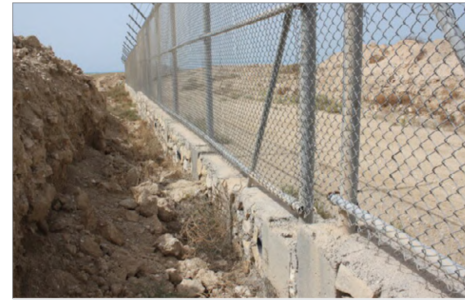
مرزهایی که شرکت‌های خصوصی در حریم خلیج فارس کشیده‌اند

به آب رسیدند و در زمین‌های دورتر، به سازه‌های معماری که دیگر قابل برداشت نبود و حالا شرکت‌های خصوصی با کشیدن دیوارهایی در نقش حصار، به همان زمین‌ها تعرض می‌کنند، زمین‌هایی که حریم «خلیج فارس» ند و این روزها حرف و حدیث پشت سرشان زیاد و چشم‌های طمع به آن دوخته شده است. فرقی نمی‌کند نجیرم باشد، یا بتانه. دیر باشد یا بردستان، بوشهر باشد یا سیراف. امروز دیگر در مرز این نوار آبی و در کتاب‌هایی که به نظر می‌رسد قرار است فقط نام