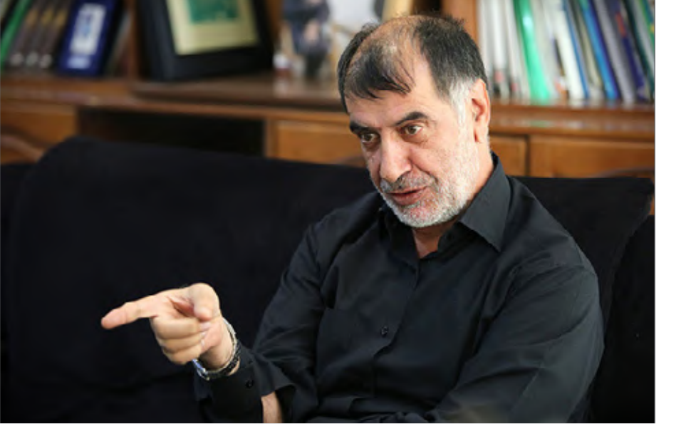
سید علی خامنه‌ای

باهنر: کارهای مملکت را به دست افراطیون ندهیم