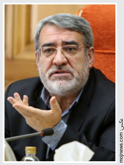
هشدار وزیر کشور به رسانه‌هایی که «سیاه‌نمایی» می‌کنند

افزایش سرمایه گذاری در بیابان لوت بیابان لوت در فهرست یونسکو به ثبت جهانی رسید، نخستین همایش بین المللی گردشگری بیابان لوت در دانشگاه بیرجند برگزار می شود