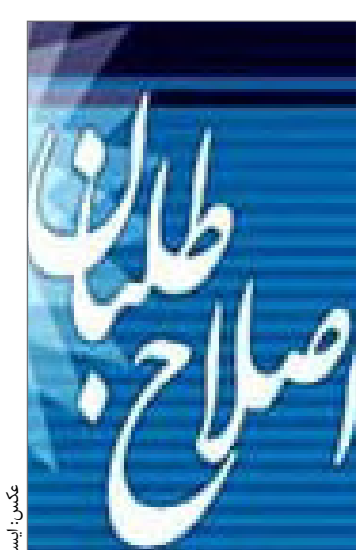
سید علی خامنه‌ای

مقرر گردید حدود ۱۰۰۰ پابند تولید شود و مطالعات یک برنامه کسب و کار برای ۳۰ هزار پابند نیز در دستور کار قرار دارد.وی ادامه داد:نظـر ریاست قوه قضاییه توسعه در حوزه پابند الکترونیک است و ما درصد هـستیم طرح مطالعاتی برای ۳۰هزار پابند بررسی و بعد از اتمام این طرح ظرف ۶ماه آینده وپـرطرف شدن موانع،این قابلیت وجود دارد که عملیات بعدی تولیداین میزان پابندالکترونیک باشد. رئیس مرکز آمار و فناوری اطلاعات با اشاره به حوزه نشراطلاعات گفت:به دلیل اینکه نشر احکام قضایات مربوط به حریم خصوصی افراد است ملاحظاتی قانونی وجود دارد که نام اشخاص افشا نشود.