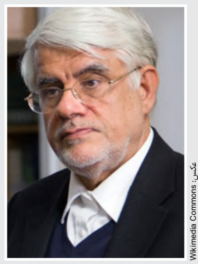
رئیس فراکسیون امید مجلس: وحدت در تصمیم‌گیری، رمز موفقیت شوراهای است

ساخت تلایی به نرمی آب در یزد زیور آلات یزدی در فهرست آثار ملی کشور ثبت شدند، قدمت ساخت زیورآلات در این شهر تا دو هزار سال قبل برآورد می‌شود.