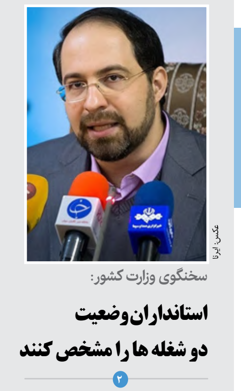
سخنگوی وزارت کشور: استانداران وضعیت دو شغله ها را مشخص کنند