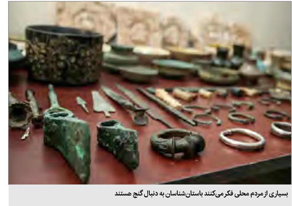
بسیاری از مردم محلی فکر می‌کنند باستان‌شناسان به دنبال گنج هستند