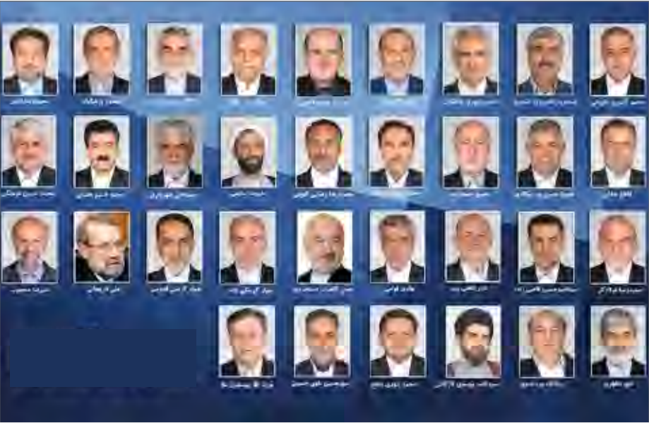
ممنوعیت ۴ دوره کاندیداتوری متوالی نمایندگان تصویب شد

چالش های ساختاری در هر سه قوه وجود دارد. این بار نمایندگان مجلس بدنبال این هستند تا با تغییراتی مجلس را چابک تر کنند، موضوعی که مخالفان و موافقانی به همراه داشته است. هنوز مصوبه از در مجلس خارج نشده است که مخالفان نامه نگاری را آغاز کرده اند. برخی مصوبه را مخالف با قانون اساسی می دانند و با بلند کردن صدای اعتراض خود به نوعی به