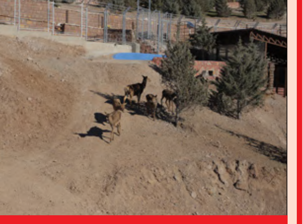
پروژه ملی سافاری پارک