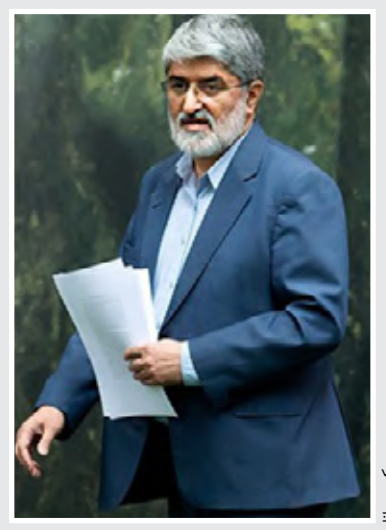
درخواست مطهری از ریسی قوه قضاییه برای بررسی اختیارات دادستان‌ها

مدیر امور حقوقی میراث فرهنگی فارس: دیوارنویسی‌ها از طریق دادگاه، پیگیری می‌شود