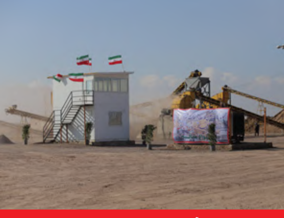
بهره برداری از پروژه کارخانه آسفالت با حضور کلانتری، رئیس سازمان محیط زیست کشور