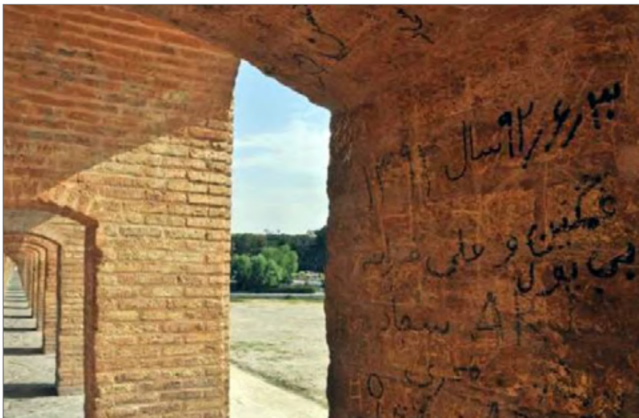
یکی از پدیده های ناخوشایند در سراسر جهان و خصوصا در کشور ما روجه تخریب گری برخی افراد در اماکن عمومی است

صنایع دستی و گردشگری استان فارس گفت: دیوارنویسی هایی که در اماکن تاریخی و گردشگری شیراز نظیر آرامگاه سعدی، حافظ و ارگ کریم خان زند ایجاد می شود هر سال پاکسازی می شود و امسال نیز در آستانه نوروز ۹۸ این کار انجام خواهد شد.