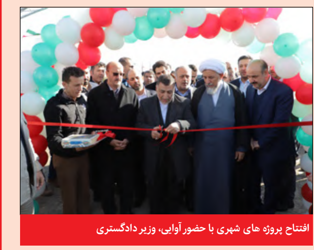
افتتاح پروژه های شهری با حضور آوایی، وزیر دادگستری