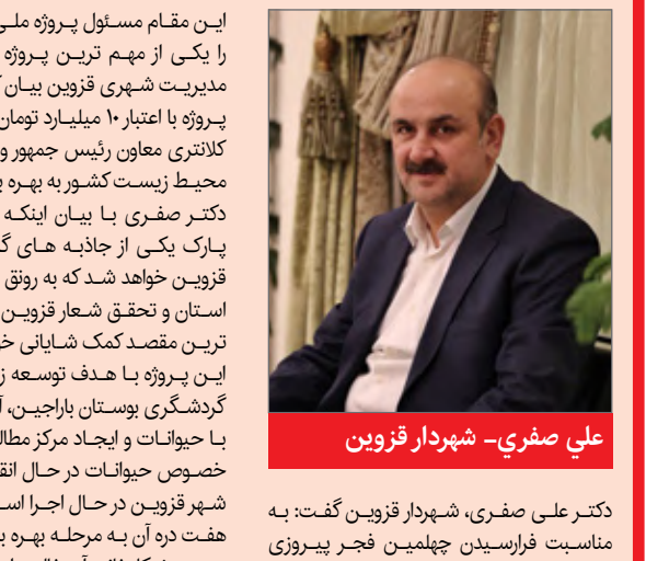
علی صفری - شهردار قزوین

این مقام مسئول پروژه ملی سافاری پارک را یکی از مهم ترین پروژه های مجموعه مدیریت شهری قزوین بیان کرد و گفت: این پروژه با اعتبار ۱۰ میلیارد تومان و با حضور دکتر کلانتری معاون رئیس جمهور و رئیس سازمان محیط زیست کشور به بهره برداری رسید.