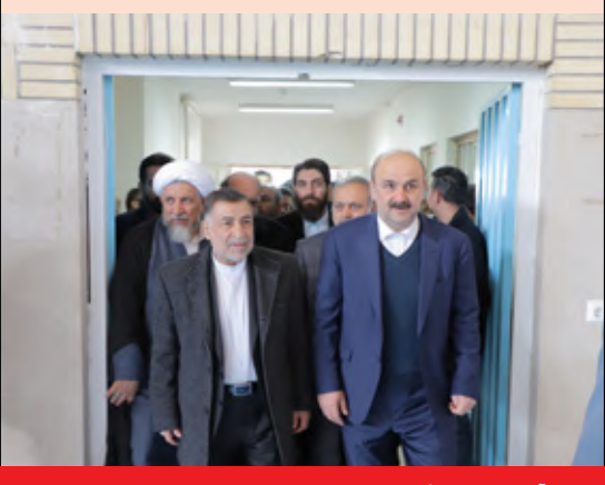
حضور آوایی وزیر دادگستری در افتتاح پروژه های شهری