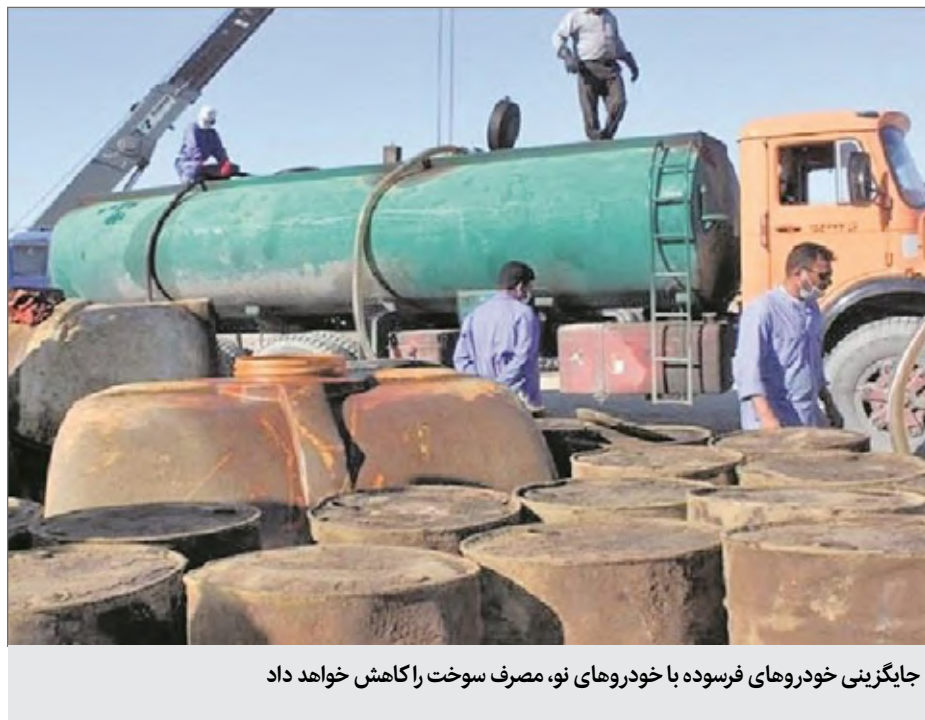
جایگزینی خودروهای فرسوده با خودروهای نو، مصرف سوخت را کاهش خواهد داد

سرعت بخشیده است. راهکارهای مدیریت مصرف سوخت روابط عمومی مرکز پژوهش‌های مجلس شورای اسلامی، دفتر مطالعات انرژی، صنعت و معدن این مرکز گزارشی با عنوان «راهکارهای مدیریت مصرف و قاچاق سوخت» تهیه کرده است؛ که نشان می‌دهد بی‌توجهی به اجرای قوانین مربوطه، که با هدف مهار افزایش مصرف مصوب شده‌اند، زمینه ساز افزایش سریع مصرف بنزین در کشور شده است. تفاوت قیمت بین فرآوردهای نفتی در ایران و کشورهای همسایه نیز قاچاق فرآورده‌ها (عمدتاً نفت و گاز) را