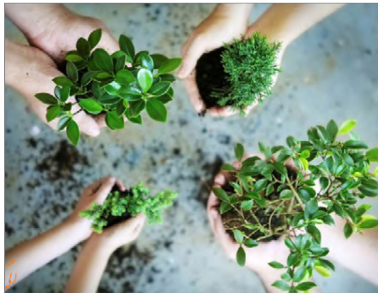
۱۵ اسفندماه روز درختکاری است

فاطمه نامجو خبرنگار / پیام ما «درختکاری» روزی که قرار است دست دوستی به سوی طبیعت دراز کرده و پیوندی عمیق با آن برقرار شود. وجود آلاینده‌ها و مواد مضر موجود در هوای شهرهای صنعتی، از مواردی است که سالانه خسارات و هزینه‌های زیادی در زمینه‌های سلامت، بافت شهری، تعطیلی نهادهای دولتی و