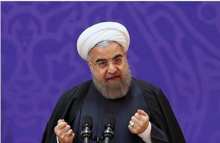
حسن روحانی در جریان سفر خود به استان گیلان در جمع مردم، سخنرانی کرد

این بود که تحریک هایی را انجام دهم تا بار عدم تعهد آنها نسبت به پیمانانی که برابر سازمان ملل و ملت ما داشتند، گردن ما بیندازند، ما را تحریک کردند تا اولین نقض کننده تعهدات باشیم. روحانی ادامه داد: تلاش کردند در این تحریم دنیا را همراه خود کنند تا دیگر کشورها با آنها همراه شوند و در این مرحله هم ناموفق بودند هیچ یک از قدرت های جهانی حتی متحدان اروپایی آمریکا برابر نقشه کاخ سفید، سر فرود وی یادآور شد: اولین کار دشمن