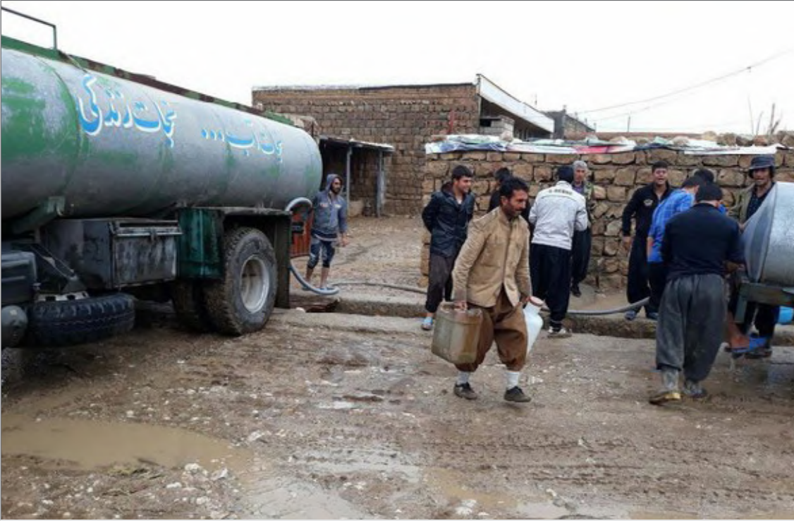
۳۹۰روستای بی آب در جنوب استان کرمان وجود دارد

علی رشیدی می‌گوید ۳۹۰ مورد از روستاهای فاقد آب در جنوب، ۱۵۰ روستا در شرق و ۳۴۰ مورد در شمال استان قرار دارند که تا پایان سال، تعداد روستاهای بی آب شرق کم‌تر می‌شود. در سفر دکتر نوبخت مقرر شد که ۷۵ میلیارد تومان برای آبرسانی به روستاهای فاقد آب جنوب استان در نظر گرفته شود و امیدواریم این بودجه هرچه سریعتر تخصیص پیدا کند. در سفر وزیر نیرو به جنوب استان هم تاکید بر این بود که ردیف اعتباری ابرسانی به روستاها افزایش پیدا کند و سعی براین شده که استاندارد و سازمان