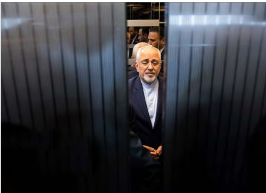
ظریف خبر استعفای خود را همراه با تبریک روز زن رسانه ای کرد

کاربران فضای مجازی را به درد آورد اما لبخند رضایت بر لب نتانیاها نشاندار. ارزشی‌های داخلی و براندازان خارجی هم از این استعفای ناهنگام رضایت دارند. جداسدن یاران کابینه دوازدهم، به ایستگاه ظریف رسیده است. پیش از این آخوندی، قاضی‌زاده هاشمی هم از هیات دولت جدا شدند. روحانی امروز با روحانی ایام انتخابات‌زمین تا آسمان تفاوت دارد. یاران روز جلب نظر