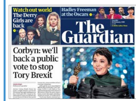
Corbyn: we'll back a public vote to stop Tory Brexit