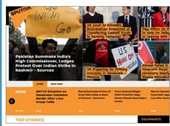
US Preparing for Military Intervention in Venezuela