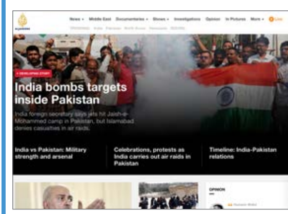
India bombs targets inside Pakistan