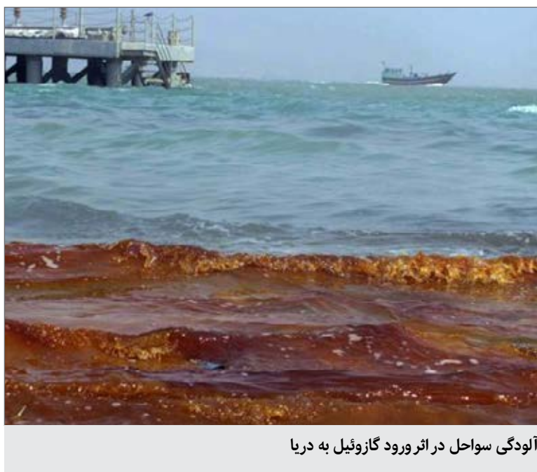
آلودگی سواحل در اثر ورود گازوئیل به دریا