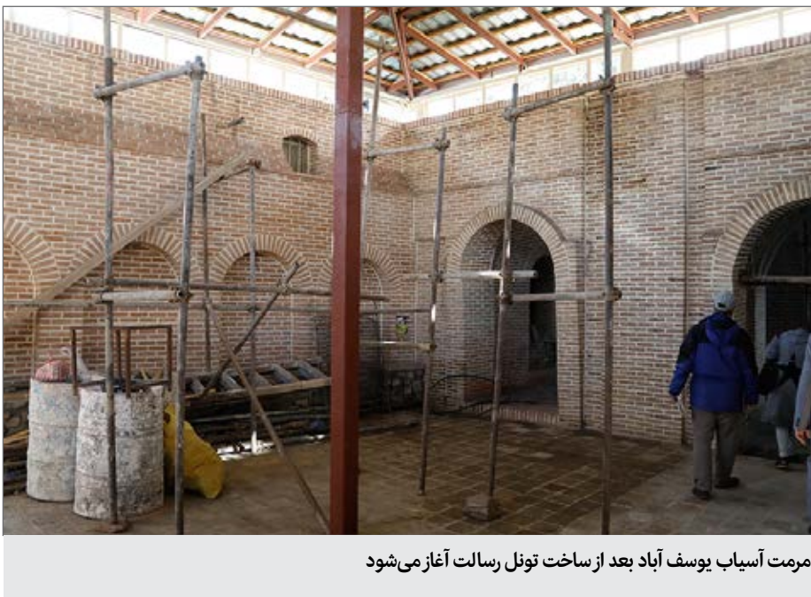
مرمت آسیاب یوسف آباد بعد از ساخت تونل رسالت آغاز می‌شود

کارها اما به این سادگی پیش نمی‌رود، آسیاب یوسف‌آباد ثبت ملی است به همین خاطر شهرداری طرح تخریب آسیاب را عوض می‌کند و مسیر به جای روی خیابان یوسف آباد از زیر آن می‌گذرد. «باغ پدروی در پروژه ساخت تونل رسالت از بین رفت اما با زحمت آسیاب را نجات دادیم و بعد از ساخت تونل شروع به بازسازی آن کردیم تا آسیاب برای مردم تهران بماند و گذشته را به خاطر بیاورند.»