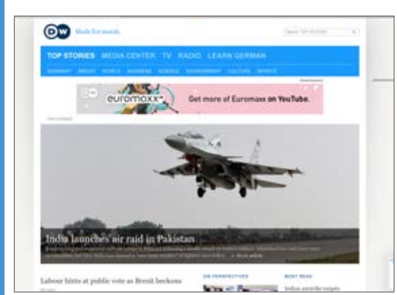
India bombs targets inside Pakistan