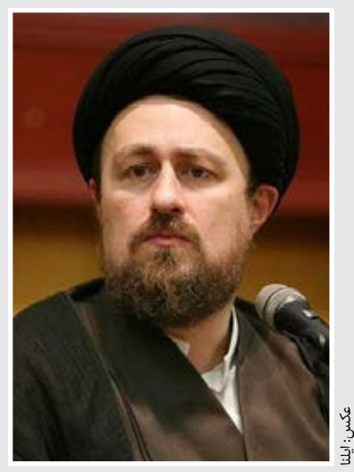
حسن خمینی: مردم باید زمانی که به ما می‌رسند، احساس آرامش کنند