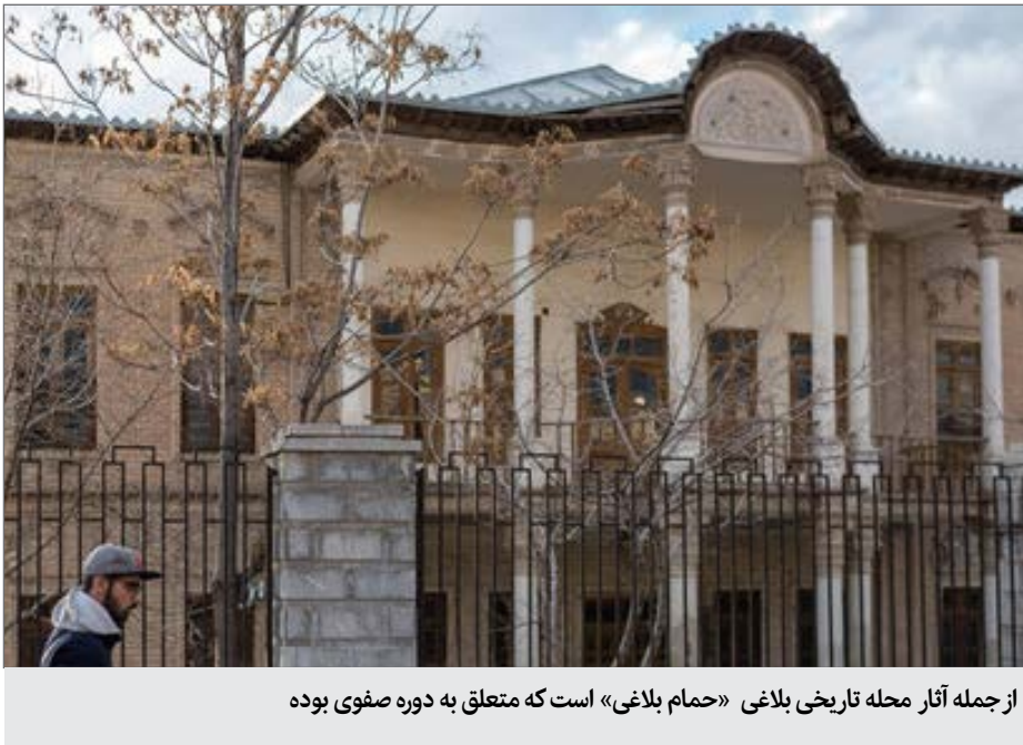
از جمله آثار محله تاریخی بلاغی «حمام بلاغی» است که متعلق به دوره صفوی بوده

محله بلاغی یکی از محلات قدیمی قزوین است که با پیشینه تاریخی ۱۲۰۰ سال یکی از کهن‌ترین محلات قزوین به شمار می‌رود، محله‌ای که در برابر طرح‌های توسعه شهری ایستاده و همچنان اصالت خود را حفظ کرده است. محله بلاغی در گذشته جزئی از محله «پنجه ریس» بود؛ این محله از شرق خیابان سپه کنونی در قزوین شروع شده و تا حصار شرقی قزوین یا همان «باغ دبیر» که