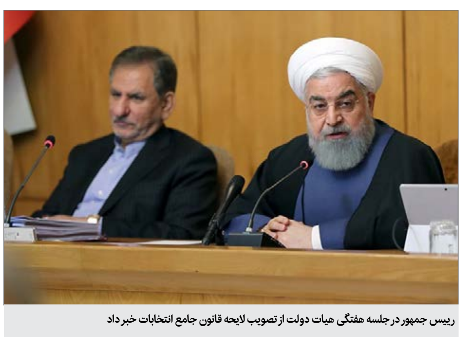
رئیس جمهور در جلسه هفتگی هیات دولت از تصویب لایحه قانون جامع انتخابات خبر داد

حسن روحانی روز چهارشنبه در جلسه هیأت دولت اظهار داشت: همه می‌دانیم بهمن‌ماه، دهه فجر و ویژه روز ۲۳ بهمن اسامی از اهمیت خاص و ویژه‌ای برخوردار است. رئیس جمهوری خاطر نشان کرد: براساس خبر وزیر نفت در جلسه امروز هیأت وزیران، یک میدان جدید نفتی در حوزه آبادان کشف شده که ذخایر آن از لحاظ کمی و کیفی قابل ملاحظه است و این بدان معناست که با قدرتی که ایران از لحاظ نفت و گاز در اختیار دارد، کشوری نیست که کسی بتواند آن را از بازار انرژی حذف کند. روحانی با اشاره به اینکه لایحه ۴