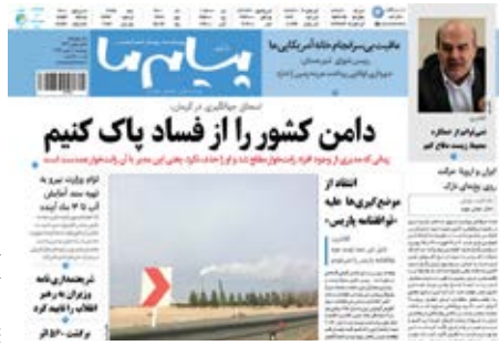
پیام ما دیروز