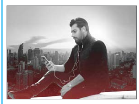
تقوم / سایت نوشیروان کیهانی زاده

آلبوم « شهر دیوونه » با صدای احسان خواجه‌امیری از صبح امروز در بازار موسیقی کشور منتشر شد. خواجه امیری آلبوم «شهر دیوونه» را به ترانه سرای فقید کشورمان تقدیم کرده و نوشته: «این مجموعه را تقدیم می‌کنم به افشین پیدالهی که این مسیر را با او شروع کردم.»