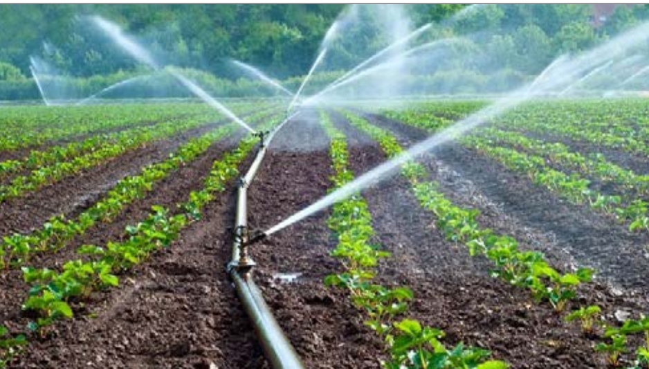
کارشناسان از کارایی نداشتن توسعه سامانه‌های آبیاری تحت فشار در راستای کم آبی می‌گویند

بررسی برنامه های گذشته نشان می دهد که توسعه سامانه های آبیاری تحت فشار از مهم ترین اقداماتی است که برای جبران بیلان آبی منفی، مقابله با خشکسالی، احیای تالاب ها، افزایش بهره وری و غیره در دستور کار دولت بوده است. این امر در قانون برنامه توسعه ششم (ماده ۳۵) بند «ب» نیز مجددا مورد تأکید قرار گرفته است. اما مراجع معتبر ملی و جهانی، نسبت به کارکرد این سامانه ها تردید جدی دارند که حتی در صورت رعایت نکردن ملزومات آن، مشابه هر فناوری دیگر، می تواند آثاری عکس مانند افزایش مصرف آب و تخریب محیط زیست را به دنبال داشته باشد.