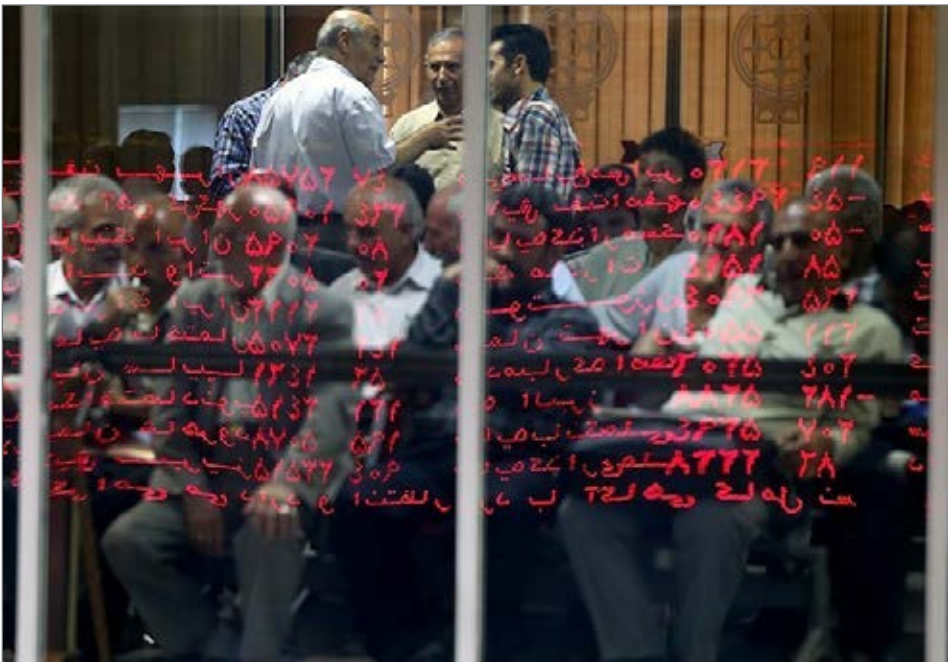
بورس تهران در هفته گذشته سرانجام به سطوح حمایتی مهم بنیادی و تکنیکی واکنش نشان داد.

از منظر بنیادی نیز سطوح مزبور، با توجه به رشد نرخ ارز و سابقه تاریخی به نوعی کف ارزش ذاتی بازار سهام تلقی می‌شود و انتظار می‌رود تا خریداران بنیادی نسبت به آن از خود واکنش نشان دهند. واکنش هفته گذشته نشان می‌دهد که عملاً حمایت‌های مزبور موثر افتاده و بورس تهران پس از افت ۲۰ درصدی از اوج شاخص در نهم