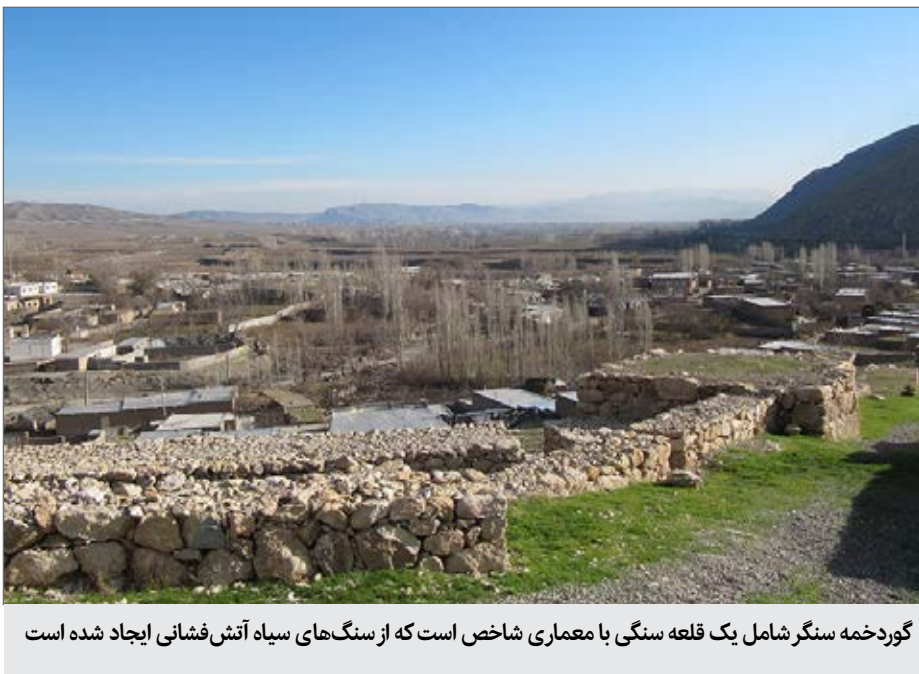
گوردخمه سنگر شامل یک قلعه سنگی با معماری شاخص است که از سنگ های سیاه آتش فشانی ایجاد شده است