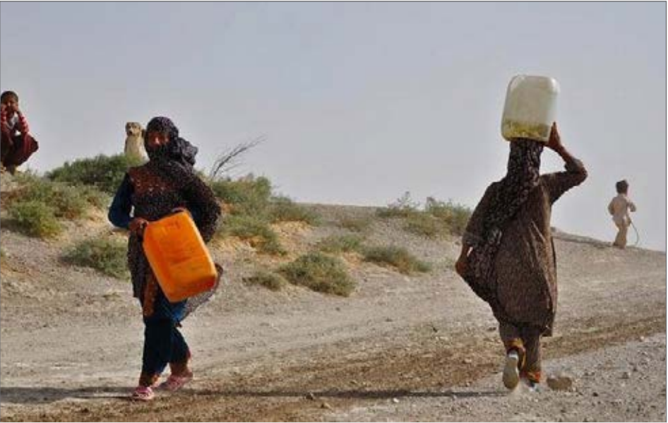
در حالی که فلات مرکزی ایران با بحران آب روبرو است افزایش کارخانه های آب بر در دستور کار مسوولان است

وی با بیان اینکه ما مشکل توسعه داریم نه منابع آبی، یادآور شد: اگر دنبال کشمکش برای دریافت آب بیشتر باشیم مسئله تمامی ندارد، تقاضا بیشتر می شود، مثل حلقه های زنجیری است که پشت هم می آید. بهتر است روشی اساسی بکار گرفته شود و توسعه هر منطقه ای متناسب با منابع طبیعی