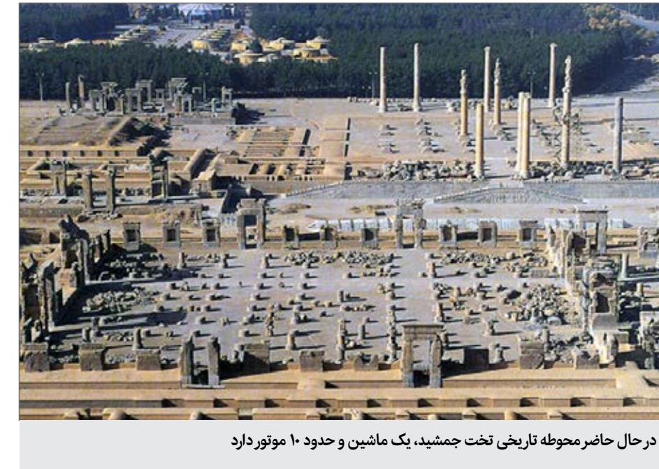
در حال حاضر محوطه تاریخی تخت جمشید، یک ماشین و حدود ۱۰ موتور دارد

موتور محوطه را تحت حفاظت قرار دهند. البته در حال حاضر نیز باتوجه به آنکه این وسایل مربوط به سال ۸۳ تا ۸۵ است و به نوعی فرسوده محسوب می‌شوند، نیاز است تا این وسایل به‌روز و نو شوند. باتوجه به آنکه محوطه تاریخی تخت جمشید و حرایم آن همواره مورد تعرض قاچاقچیان قرار می‌گیرد، چندی پیش سردار سرتیپ دوم امیر رحمت‌اللهی (فرمانده یگان حفاظت میراث فرهنگی) از دستگیری اعضای باند حفار غیرمجاز و کشف سلاح گرم در مرددشت خبر داد و گفت که در پی اخبار واصله مردمی و به محض اطلاع از زمان حضور حفاران در منطقه، اکیبی از نیروهای حفاظت پس از پیمودن ساعات مسیری سخت و صعب العبور کوهستانی به محل مورد نظر و عزیمت و نسبت به مسدود نمودن مبادی خروجی اقدام کردند. در نهایت دو نفر از اعضای باند حفار غیرمجاز دستگیر شده و از آنها تعدادی اسلحه شکاری، چاقو، فشنگ و ادوات حفاری کشف و ضبط شد. چنین رخدادهایی نشان می‌دهد که مرودشت و محوطه تاریخی تخت جمشید همچنان مورد تهدید است و نیاز است که باتوجه به وسعت محدوده باستانی نیاز است تا ۲ ماشین و بیش از ۱۰