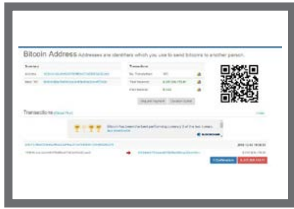
در هفته گذشته یک اکانت ناشناس که از ۲۰۱۴ غیر فعال بوده، یک تراکنش ۳۳۳/۶۶ بیت‌کوین به ارزش ۲۵۷ میلیون دلار یعنی ۳۰۰۰ میلیارد تومان انجام داده! @amirpersis

برکه‌ای که این گاندو توش زندگی می‌کرده خشک شده، اهالی روستای کلراهی که نزدیک این برکه زندگی می‌کنن این گاندو رو از مرگ نجات دادن و تحویل اداره محیط زیست چابهار دادن. مردم محلی گاندو رو نماد برکت و آبادانی می‌دونن و همیشه ازش محافظت می‌کنن. @navidbhz