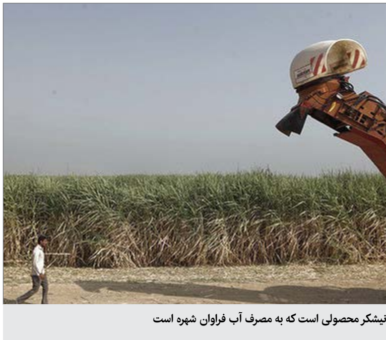
نیشکر محصولی است که به مصرف آب فراوان شهره است

است. صنعت نیشکر یکی از بزرگترین تخریب کنندگان محیط زیست خوزستان، بدون توجه به استانداردهای زیست محیطی و قوانین محیط زیست، در حال توسعه در این استان است. نیشکر محصولی است که به مصرف آب فراوان شهره است و اغلب به خسارت به زیستگاه و فرسایش خاک منجر می‌شود. معضلی دیگر هم وجود دارد: میزان شوری خاک در مناطق در نظر گرفته شده برای طرح توسعه نیشکر از ابتدا بالا بود و بنابراین حجم بیشتری از آب برای هکشی مورد نیاز