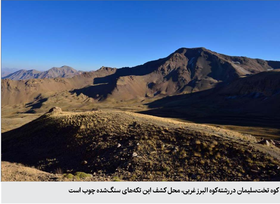
کوه تخت‌سلیمان در رشته‌کوه البرز غربی، محل کشف این تکه‌های سنگ‌شده چوب است

است. این مزار شامل بقایایی از یک طبقه زیرین به‌شکل معبد است که روی آن دخمه‌ای قرار گرفته است. ستونی سنگی وسط این دخمه وجود دارد که براساس افسانه‌ها، یادگاری‌های به‌جامانده از نوح نبی زیر آن مدفون شده است. کوه آرارات در ارمنستان چشم‌اندازی بسیار زیبا از مزار نوح نبی دارد و همان‌طور که پیشتر گفته شد برپایه روایت‌هایی کشتی نوح بر فراز این کوه فرود آمده است. با وجود این، این اثر تاریخی در نخجوان هم تنها مکانی نیست که به مقبره نوح نبی میلادی است که در سال ۲۰۰۶ به‌طور کامل بازسازی شده