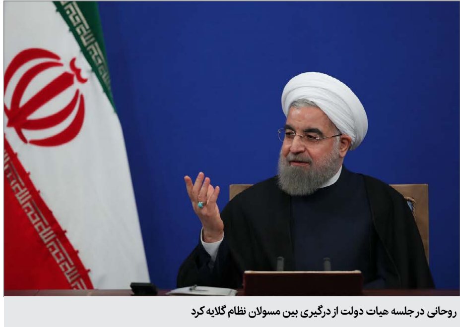
روحانی در جلسه هیات دولت از درگیری بین مسولان نظام گلایه کرد

روحانی ادامه داد: درست است که هنوز همه کارهایی که باید برای دریاچه ارومیه انجام داده‌ایم و عمل می‌کرد، امروز دریاچه ارومیه تبدیل به منبع نمک شده بود و با یک طوفان، زندگی ۱۵ میلیون نفر را نابود می‌کرد.