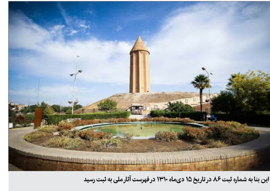
این بنا به شماره ثبت ۸۶ در تاریخ ۱۵ دی‌ماه ۱۳۱۰ در فهرست آثار ملی به ثبت رسید

این برج تاریخی که بیش از هزار سال، سرفرازانه سر به آسمان کشیده تا تمدن کهن مردم این دیار را به رخ جهانیان بکشد امروز قامتش در مقابل تکنولوژی بشر مانند تردد خودروهای سنگین به لرزه درآمده است. مدیر پایگاه میراث جهانی گنبد قابوس از آن به‌عنوان