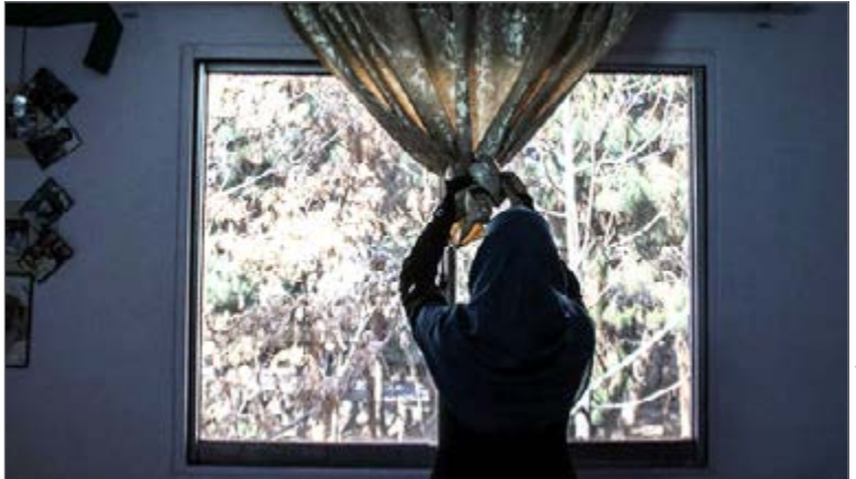
«تنبلی چشم»؛ شایع ترین نوع اختلال بینایی میان جوانان