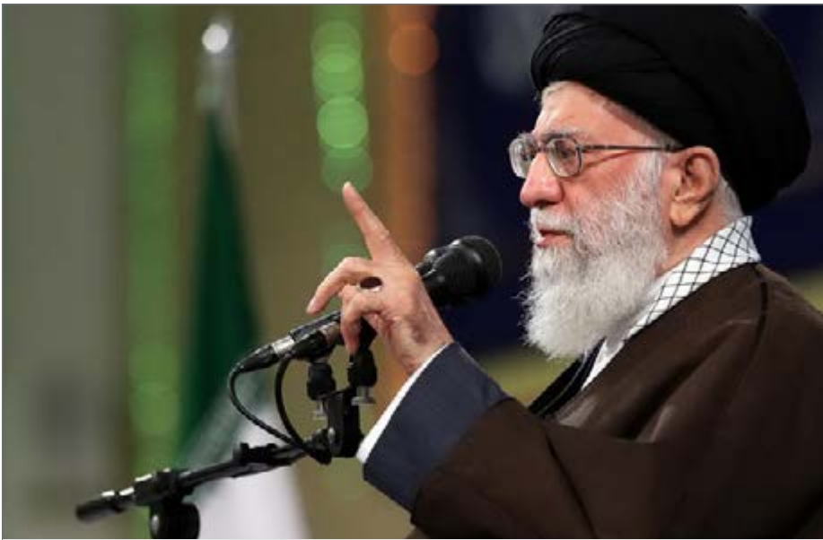
اجرای این سند قرار است از ابتدای قرن پانزدهم هجری شمسی (سال ۱۴۰۰) آغاز شود

حضرت آیت الله خامنه ای رهبر معظم انقلاب اسلامی، دستگاه ها، مراکز علمی، نخبگان و صاحب نظران را به بررسی عمیق ابعاد مختلف سند تدوین شده و ارائه نظرات مشورتی جهت اصلاح و تکمیل و ارتقای این سند بالادستی فراخواندند. رهبر انقلاب اسلامی در این فراخوان از مرکز الگوی اسلامی ایرانی پیشرفت خواستند تا با مشورت مراجع مندرج در ابلاغ، نظرات و پیشنهادهای تکمیلی را دقیقاً بررسی و بهره برداری کند و نسخه ای ارتقایافته ای الگوی اسلامی ایرانی پیشرفت را حداکثر ظرف دو سال آینده برای تصویب و ابلاغ ارائه نماید.