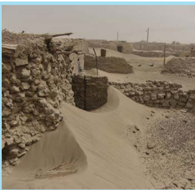
هجوم شن‌های روان در سیستان