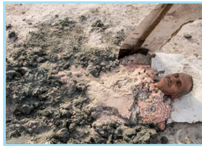
«لجن درمانی» در دریاچه ارومیه