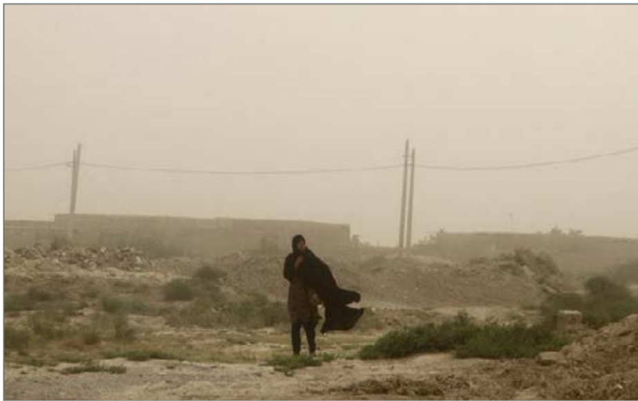
میزان آلودگی هوا در «زابل» سه برابر میانگین غلظت آلاینده‌های آلوده‌ترین شهر جهان است

رییس شبکه پایش هواشناسی سیستان و بلوچستان با بیان اینکه وزش بادهای ۱۲۰ روزه امسال جزو شدیدترین بادهای ۵۵ سال اخیر است، گفت: حدود ۵۰ روز متوالی است که بیشینه سرعت وزش باد در زابل بین ۷۰ تا ۱۲۲ کیلومتر بر ساعت می‌رسد. دیانتی ادامه داد: در این ۵۰ روز