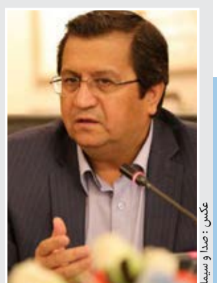
رییس بانک مرکزی: ذخایر ارزی ناموس بانک مرکزی هستند

مرگ ماهیان فریدونکنار در ابهام کثیفی رودخانه، سموم کشاورزی و کمبود آب، دلایلی هستند که برای مرگ ماهیان رودخانه فریدونکنار بیان می شود