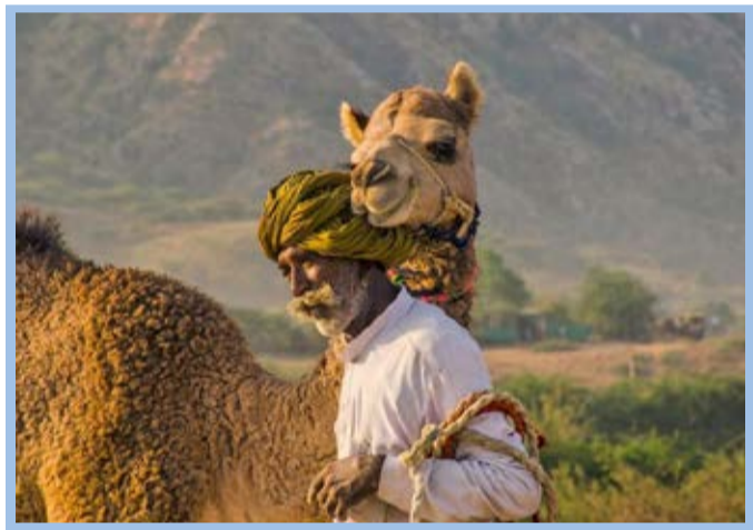
دوستی با شتر در عکس نشنال جئوگرافیک