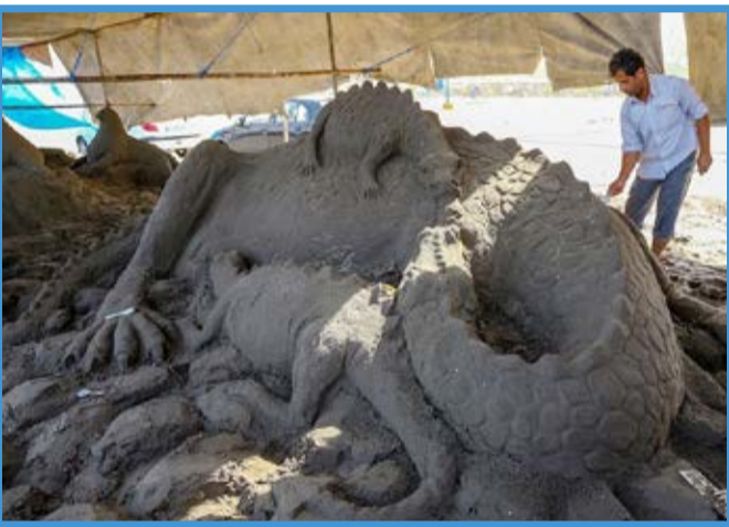
هنرنمایی با شن‌های ساحل خزر