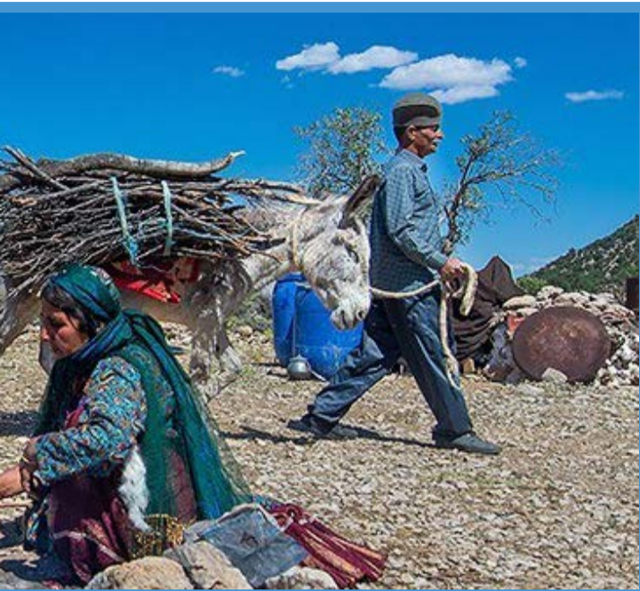
عشایر قشقایی - فارس