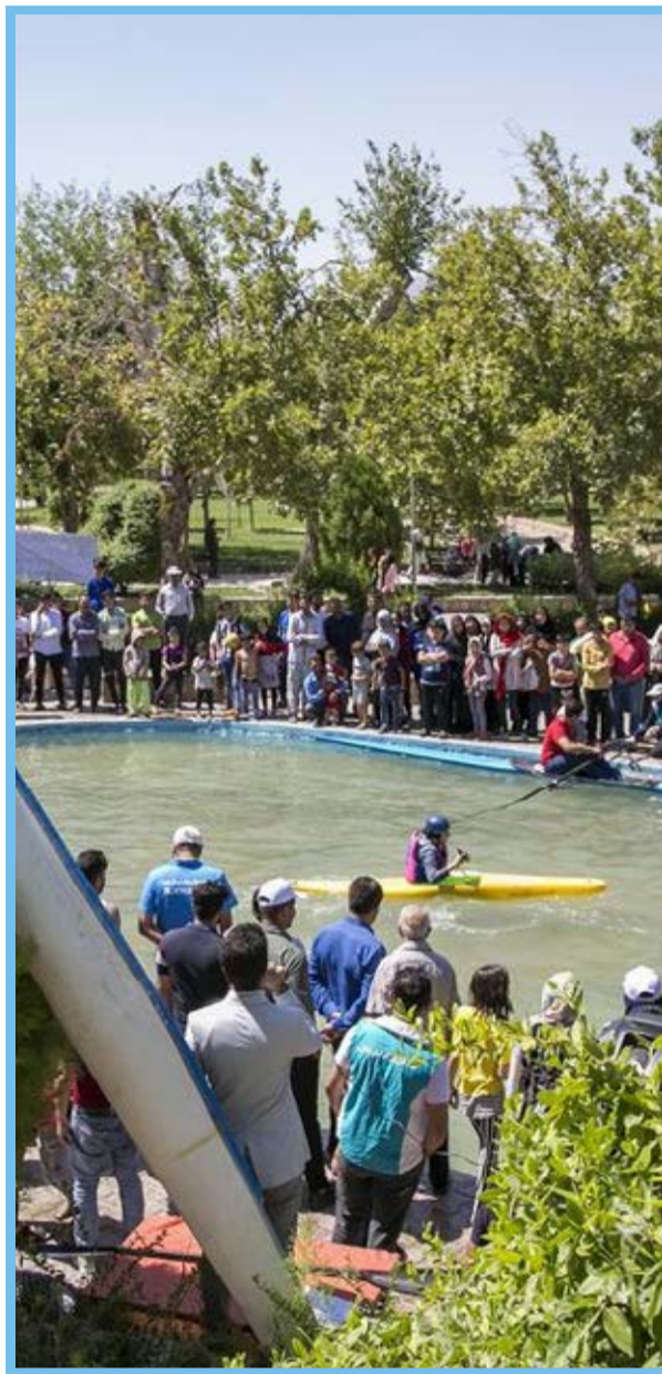
همایش قایقرانی در بجنورد