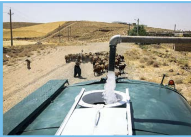
آبرسانی سیاره روستاهای شهرستان قره