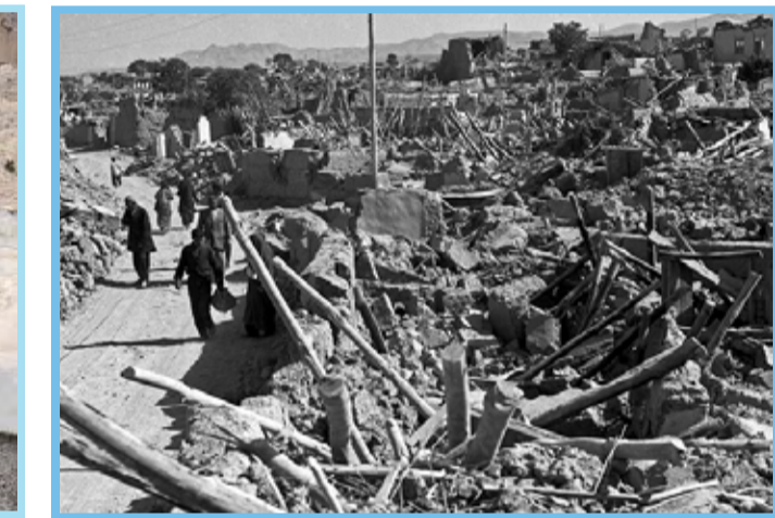
۵۶ سال قبل؛ زلزله‌ای که ۱۲ هزار قربانی گرفت