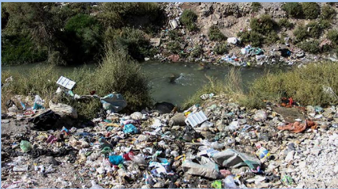
آلودگی رودخانه کشف رود و کشت و کار فاضلابی در اطراف آن به معضل مزمن زیست محیطی مشهد / میزان