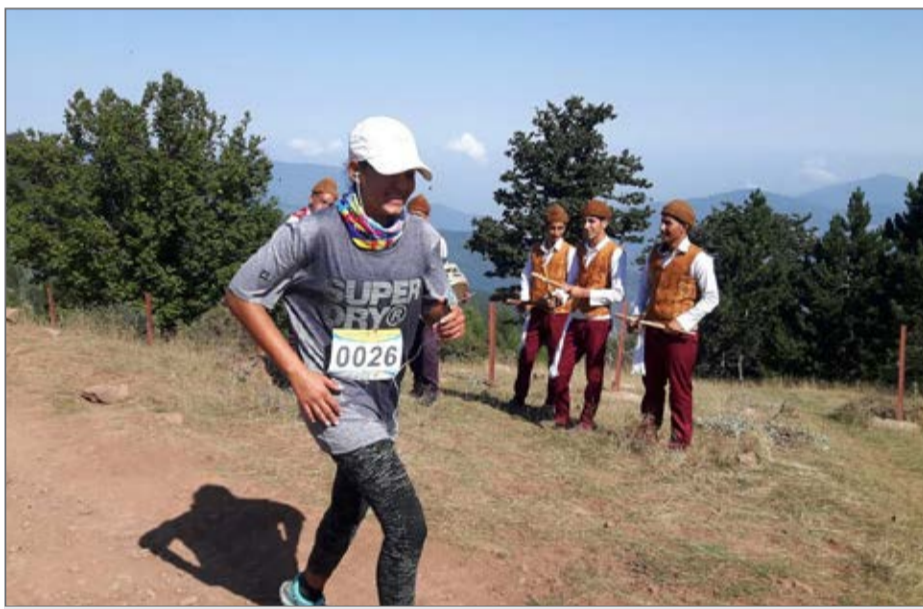
عاشق رانندگی عمومی میراث فرهنگی

استان سمنان قرار است در برنامه ۲۰۲۰ و در سال ۱۴۰۰ به یکی از مقاصد تازه گردشگری کشور تبدیل شود. به همین دلیل توسعه گردشگری ورزشی در دستور کار قرار گرفته است. طراحی این اکوماراتن دو ماه زمان برد و از تیم اجرایی اکوماراتن کرمان کمک گرفته شد. یک تیم ایتالیایی نیز در قسمت مدیریتی این طرح