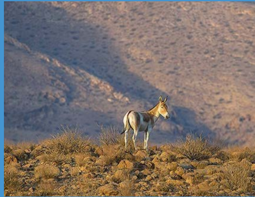
این گونه بسیار محدود شده است.