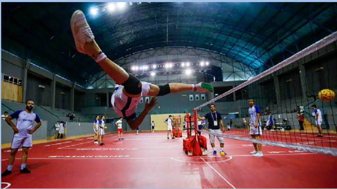
بازی های آسیایی اندونزی ۲۰۱۸ - تمرین تیم ملی سبک تاکرا / میزان