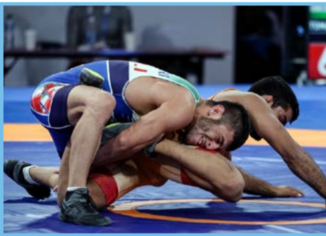
بازی های آسیایی ۲۰۱۸ / رقابت های کشتی آزاد / باشگاه خبرنگاران جوان