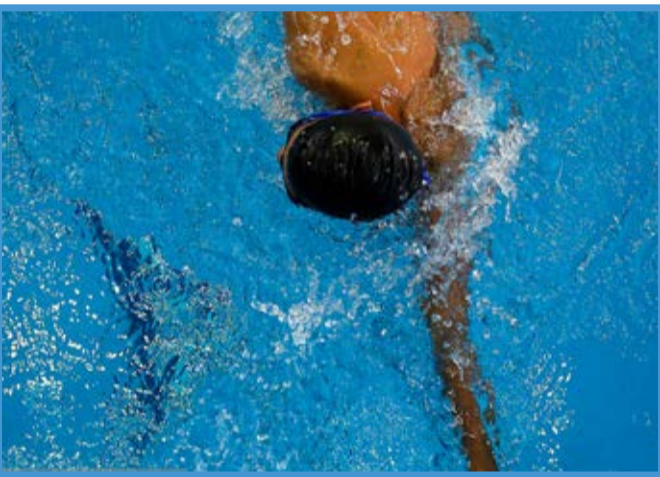
مسابقات شنا جام زنده رود