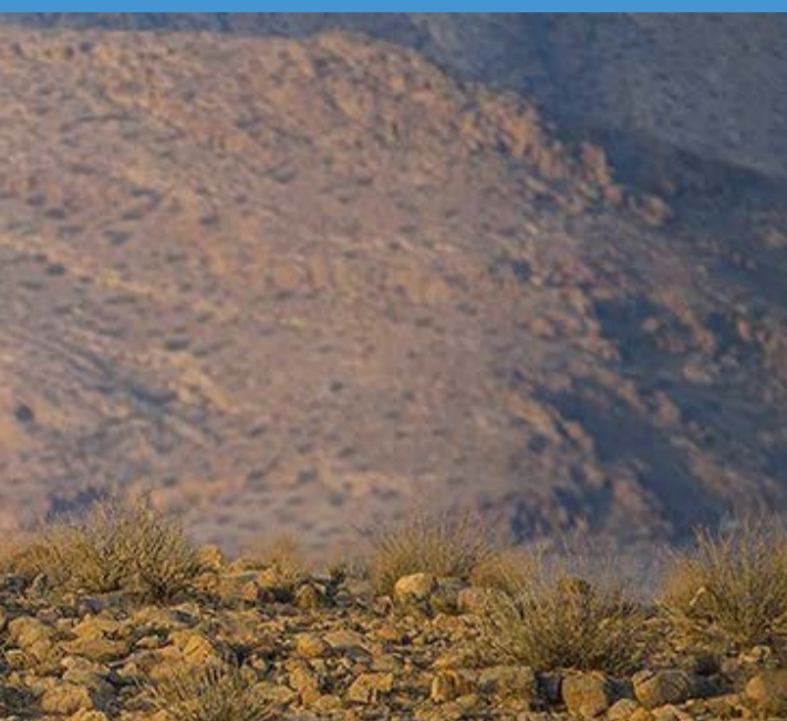
زمانی گور ایرانی در همه دشتهای کشور زندگی می‌کرد اما به دلیل شکار غیرقانونی