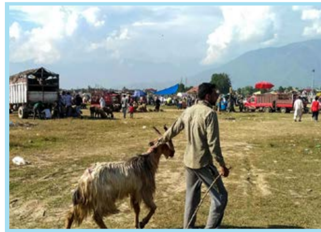
بازار عرضه دام در کشمیر / میزان