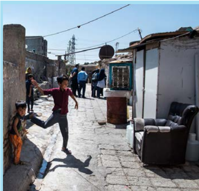
محله دولتخواه در جنوب شهر تهران