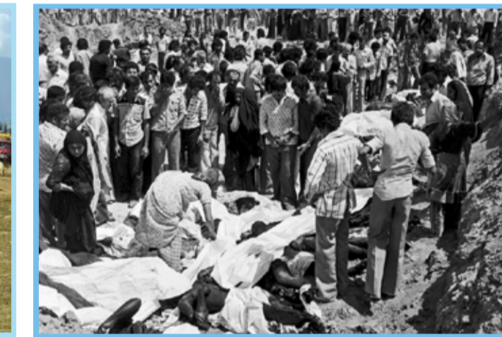
۴۰ سال قبل، روزی که ۳۷۷ ایرانی زنده‌زنده در سینما