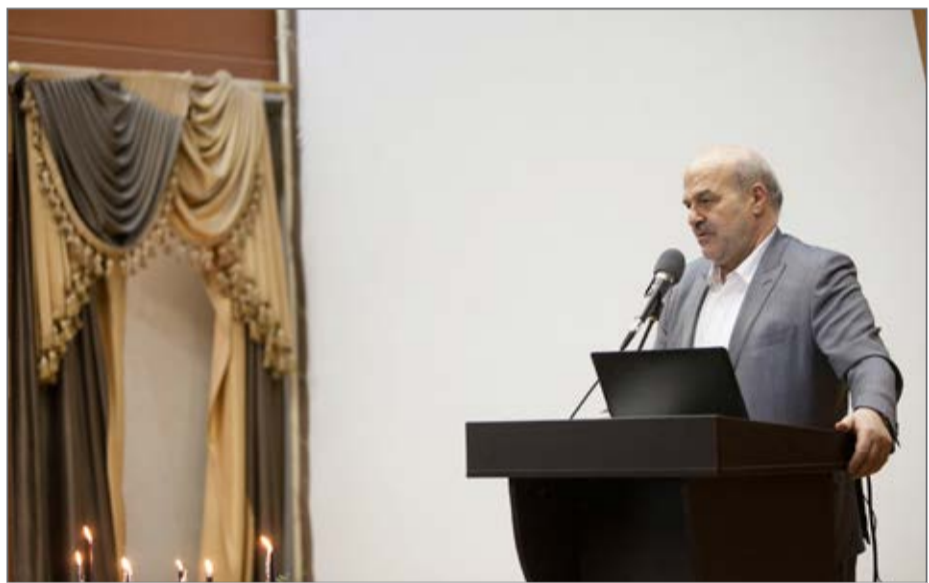
رییس سازمان حفاظت محیط‌زیست می‌گوید نباید به محیط‌زیست نگاه امنیتی داشت

در شرایطی که مشکلات محیط‌زیستی روز به روز در ایران