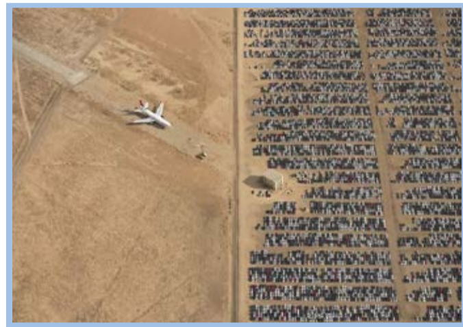
گورستان فولکس واگن‌ها در عکس روز نشنال جئوگرافیک