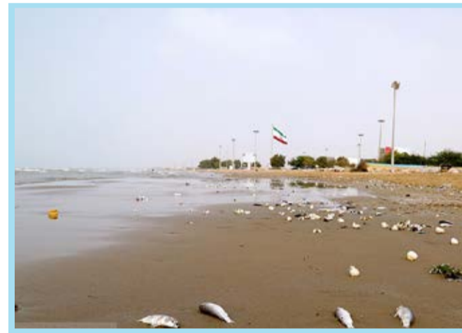
مرگ آبریزان در ساحل بندرعباس