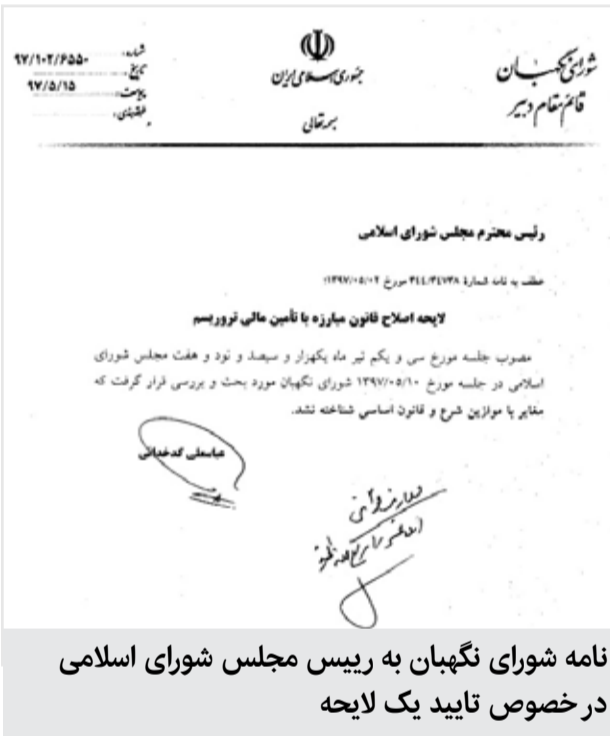
نامه شورای نگهبان به رییس مجلس شورای اسلامی در خصوص تایید یک لایحه

قانون مبارزه با تامین مالی تروریسم در سال ۹۴ به تصویب مجلس رسیده بود و آذر سال گذشته دولت لایحه اصلاح آن را به مجلس فرستاد. با وجود موافقت‌ها و مخالفت‌ها، مجلس شورای اسلامی دوم مرداد امسال مصوبه خود در خصوص لایحه اصلاح قانون مبارزه با تامین مالی تروریسم را به شورای نگهبان فرستاد و شورای نگهبان روز گذشته آن را تایید کرد. این اتفاق گام اول ایران برای خروج از لیست سیاه FATF محسوب می‌شود. این در شرایطی است که لایحه اصلاح قانون مبارزه با پولشویی پس از یک بار