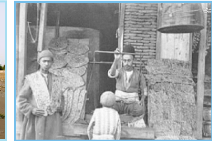
نانوایی‌های دوره قاجار