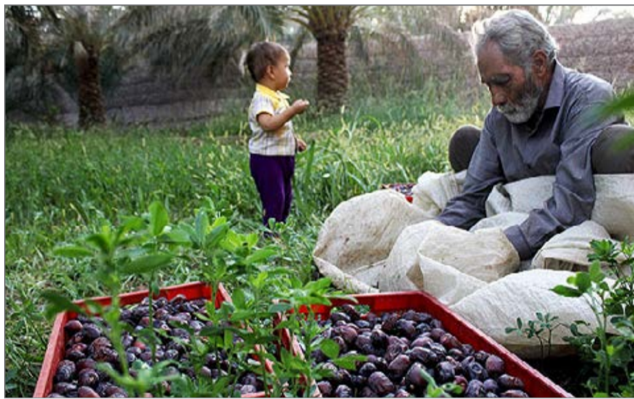
خرید تضمینی خرما اولین بار در شهرستان های شرقی استان کرمان صورت گرفت

با مشکلات عدیده ای مواجه بودند و بخاطر جو روانی که توسط دلالان بر بازار خرماي شهرستان های شرقی استان کرمان حاکم بود قیمت خرما به شدت تنزل قیمت داشت و اختلاف فاحش قیمتی بین شهرستان های شرقی تولید کننده خرما و بازارهای هدف ( مصرف کننده) وجود داشت. و این تهدید جدی برای کشاورزان و تولیدکنندگان خرماي شرق استان کرمان بود. که خوشبختانه با ورود به موقع سازمان تعاون روستایی این تهدیدها تبدیل به فرصت برای کشاورزان و تولیدکنندگان گردید. سیاست خرید تضمینی خرما برای اولین بار در شهرستان های شرقی استان کرمان به همت