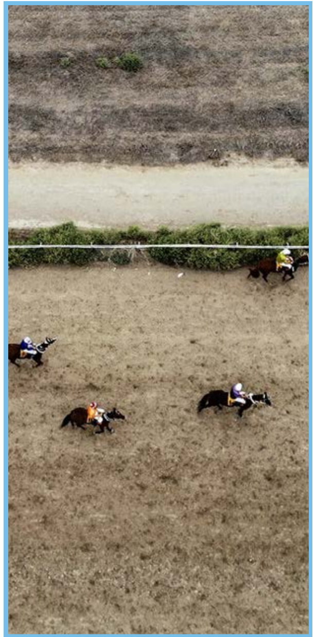
کورس تابستانی سوارکاری بندرتکمن / مهر