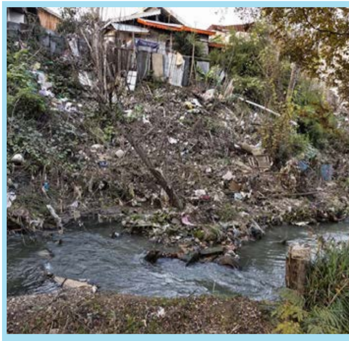
بلایی که زباله‌ها سر قدیمی‌ترین رودهای رشت آورده‌اند