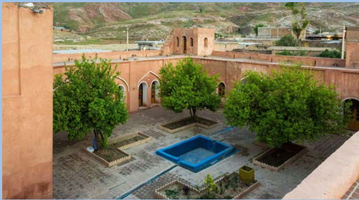
قلعه «میر غلام هاشمی» یکی از بناهای دوران قاجاریه در شهرستان دره شهر ایلام