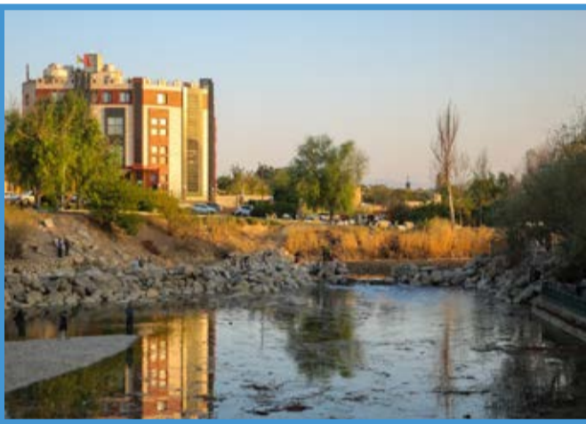
زاینده رود جاری شد اما به اصفهان نمی رسد