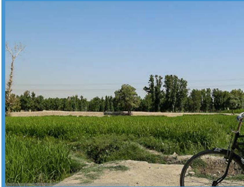
زاینده رود خشک کرده اند