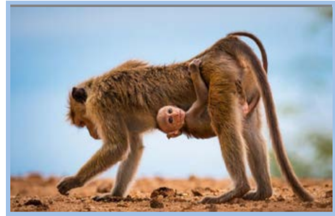
عکس نشنال جئوگرافیک یک بچه میمون را در سریلانکا که مادرش را به آغوش کشیده نشان می‌دهد.