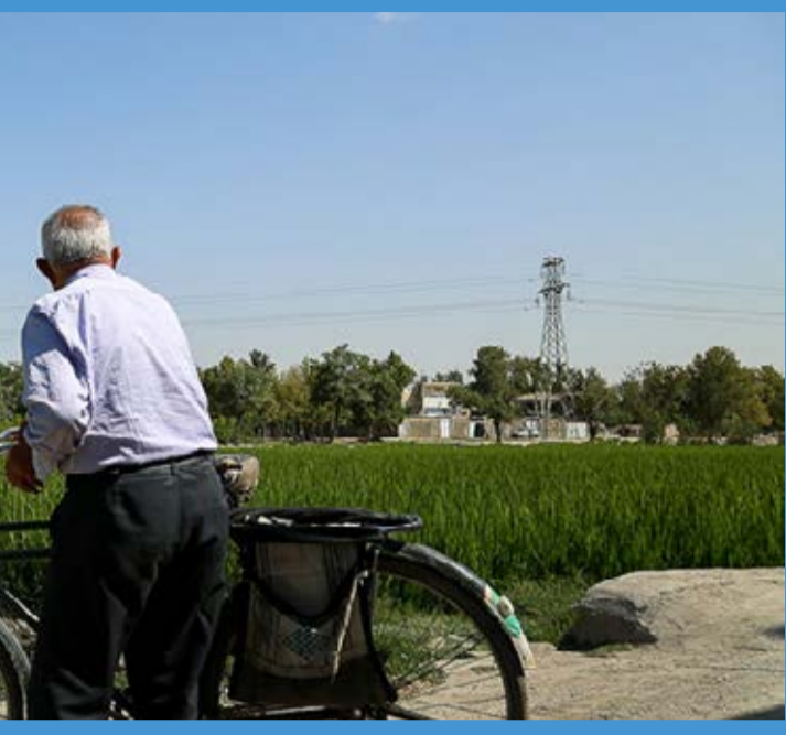
اصفهان‌ها آب ندارند، اما شالیزار چرا! برخی کشاورزان اقدام به کشت برنج در نزدیک