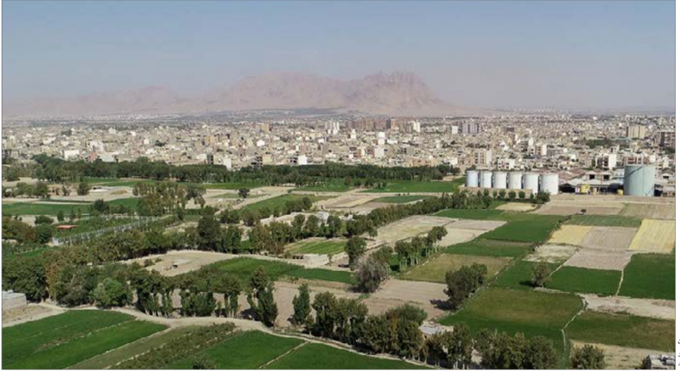
یادداشت مهمان مصطفی داننده

احمدی نژاد، رییس دولت‌های نهم و دهم از حسن روحانی رییس جمهور ایران خواسته که استعفا دهد. احمدی نژاد هم مانند هر فرد دیگری حق دارد از روحانی و دولتش گلایه کند. آن سال هایی که نمی شد به دولت و رییس آن انتقاد کرد مدت هاست که سپری و پرونده هایی که دولت احمدی نژاد برای منتقدانش می ساخت، هم اکنون بخشی از تاریخ شده است. احمدی نژاد حرف بزند اما فراموش نکند همانطور که ما فراموش نکردیم. از قدیم به ما گفته‌اند، هرچه بکارید، برداشت خواهید کرد. آقای احمدی نژاد امروز هر چه برداشت می‌کنیم حاصل کاشته‌های شماست. امروز احمدی نژاد از روحانی انتقاد می‌کند بدون اینکه بگوید چه میراثی برای روحانی به جای گذاشته است. احمدی نژاد دولتی را تحویل گرفت که در بسیاری از موارد، ۲ به علاوه ۲ می‌شد ۴، یعنی تقریباً همه چیز سرچای خودش بود؛ دولتی که با جهان رابطه خوبی داشت، از نظر اقتصادی مثبت بود و مشکلات اجتماعی در آن در پایین ترین حد ممکن بود. احمدی نژاد اما دولتی را به روحانی تحویل داد که ۲ به علاوه ۲ در آن معمولاً ۴ نمی‌شد. دولتی که هم با جهان مشکل داشت هم از نظر اقتصادی ویران بود و هم مشکلات اجتماعی از در و دیوار کشور بالا می‌رفت. روحانی وقتی به قدرت رسید مجبور بود ساختمان زلزله زده کشور را ترمیم کند و حتی در بعضی جاها بگوید و بسازد. روحانی در حال ساختن بود که زلزله‌ای به نام ترامپ آمد و به خانه در حال ترمیم آسیب زد. امروز جهان با مشکلی به نام ترامپ روبرو است. مردی که به هیچ معاهده‌ای پایبند نیست و آنها را کاغذ پاره می‌داند. درست مثل احمدی نژاد که تحریم‌ها را کاغذ پاره