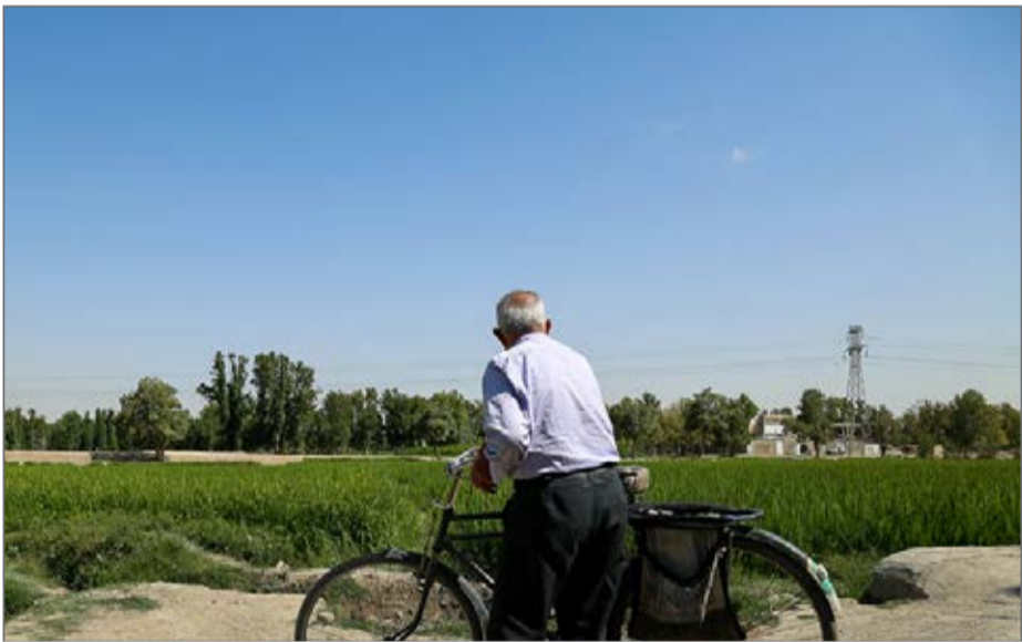
جهاد کشاورزی اصفهان: نمی‌توان به جنگ کشاورزان رفت

به گفته کرمانی، قرار است ظرف دو سه ماه آینده، برنامه الگوی کشتی توسط وزارت جهاد کشاورزی تهیه و برای کارگروه مقابله با کم آبی فرستاده شود که در صورت ابلاغ این