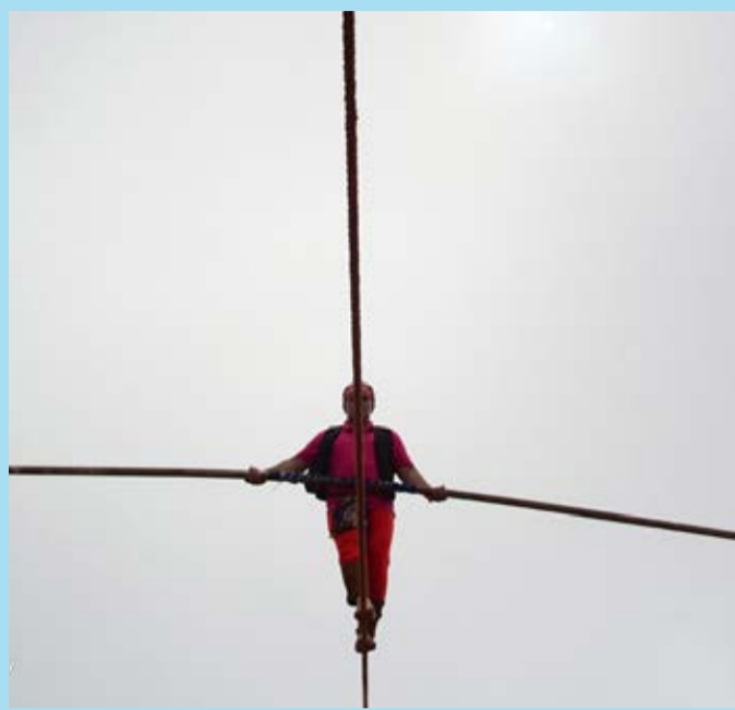
جشنواره بازی‌های بومی، محلی جواهردشت