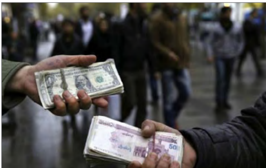
نرخ دلار در یک سال گذشته ۲/۵ برابر شده است

گذشته به جای ولی‌الله سیف نشست، در حالی اصلی‌ترین هدفش را حذف رانت ارزی و سامان‌دهی بازار ارز عنوان کرده که به نظر می‌رسد دلار، حریف سرسختی باشد. حریفی که دیروز با پنج رقمی شدن نشان داد حالا حالاها قصد تسلیم شدن را ندارد. در حالی از دی سال گذشته نرخ دلار تقریباً هر روز افزایش یافته که محمدرضا پورابراهیمی، رییس کمیسیون اقتصادی مجلس به «پیام ما» می‌گوید این روند تا زمانی که دولت برای تشکیل بازار ثانویه اقدامی نکند و اراده‌ای برای مدیریت آن نداشته باشد، ادامه‌دار است. این اظهار نظر در حالی است که ۲۵ روز از راه‌اندازی این بازار