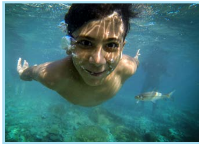
آبتنی در چشمه ای زیبا در هرمزگان