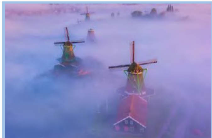
عکس نشنال جئوگرافیک آسیاب‌های بادی در هوای مه‌آلود در هلند را نشان می‌دهد.

روزنامه دریا به نقل از معاون وزیر نیرو نوشت: مصرف برق به بالای پیک مصرف رسیده است.