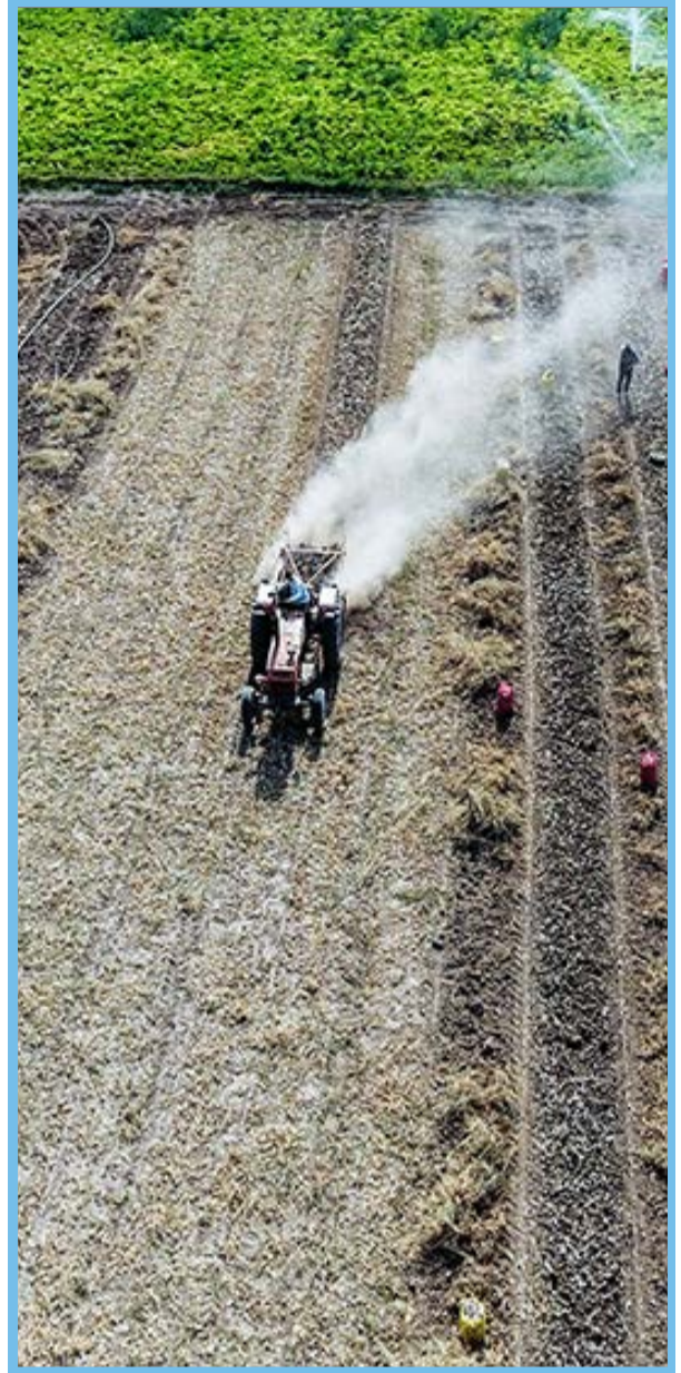
برداشت سیر در همدان / میزان