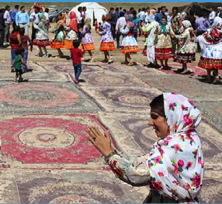
عروسی گرمانج / فارس