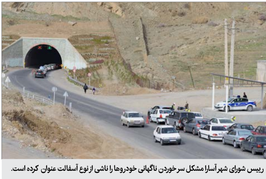
رییس شورای شهر آسارا مشکل سر خوردن ناگهانی خودروها را ناشی از نوع آسفالت عنوان کرده است.

وی تردد تعداد بالای تانکرهای حمل گازوئیل، شرایط آب و هوایی جاده چالوس، تصادف و ریختن سوخت و روغن و خودروهای تصادفی و عواملی از این دست را از دلایل دیگر این موضوع عنوان و اعلام کرد که در هر حال موضوع ریختن گازوئیل در محور چالوس در دست بررسی است و در صورت اثبات با عاملان آن به شدیدترین نحو برخورد می‌شود و هیچ اغمازی در این خصوص صورت نمی‌گیرد. پس از حدود سه ماه از این اظهار نظر، رییس شورای شهر آسارا مشکل سر خوردن ناگهانی خودروها را ناشی از