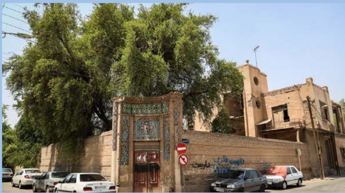
وضعیت اسفناک هتل قو اهواز