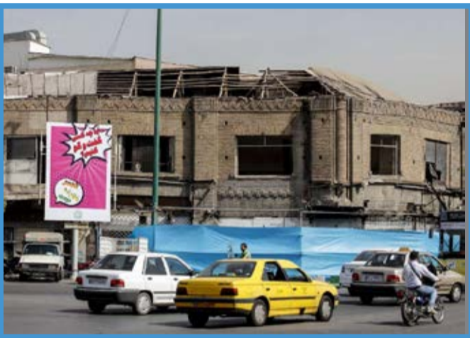
حال نامعلوم بنای کفش ملی در پایتخت / ایرنا