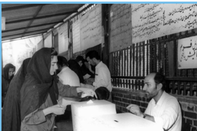
تصاویر تاریخی از اولین انتخابات ریاست جمهوری که بعد از رحلت امام(ره) برگزار شد