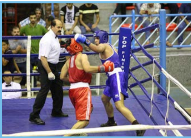
مسابقات بوکس قهرمانی جوانان کشور در سنج