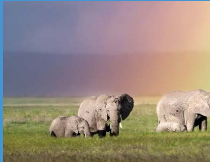
در لحظه‌ای که رنگین کمان نمایان شده است از زیر آن عبور می‌کنند.