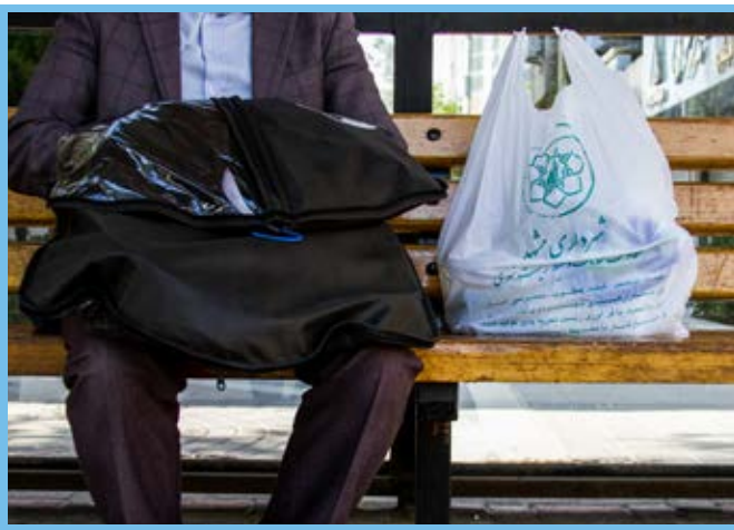
دنیای امروز ما به تسخیر پلاستیک‌ها درآمده است