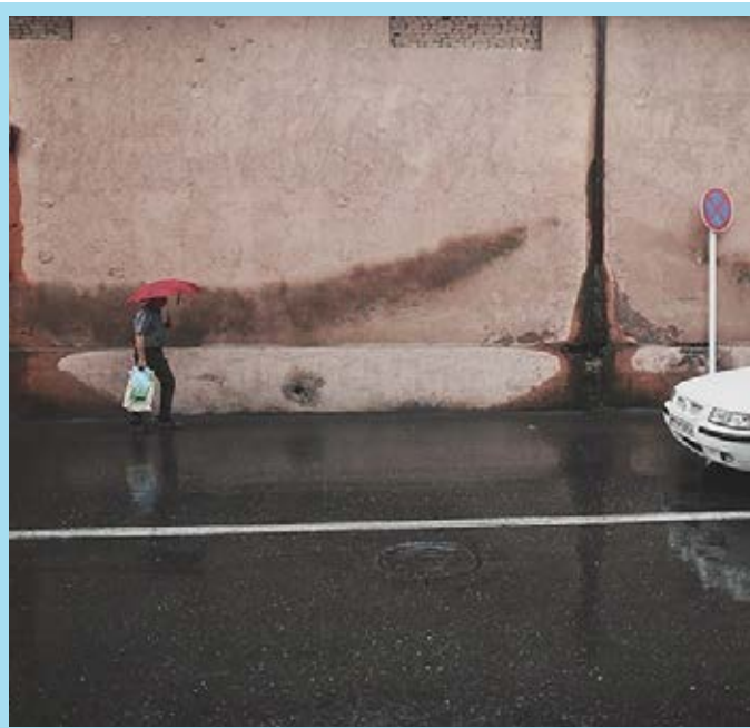
بارش باران تابستانی در گرگان