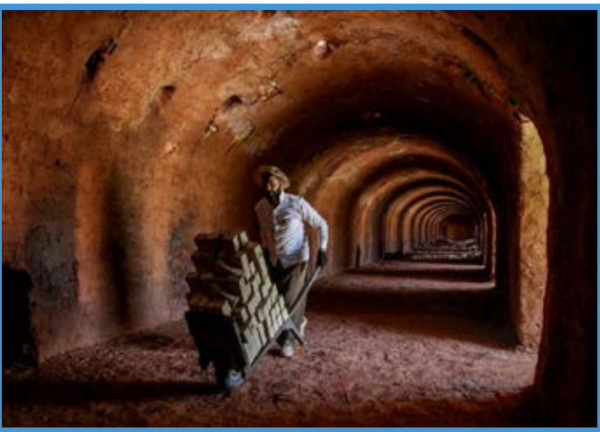
کوره‌های آجرپزی در مریوان