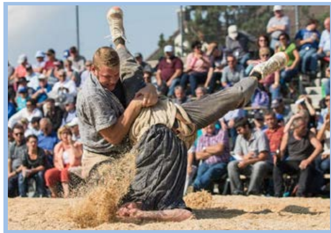
عکس نشنال جئوگرافیک مسابقات کشتی سنتی سوئیس را نشان می‌دهد

روزنامه دریا به نقل از رییس مجمع نمایندگان هرمزگان نوشت: دولت حاضر نیست صدای عدالتخواهی هرمزگان را بشنود.