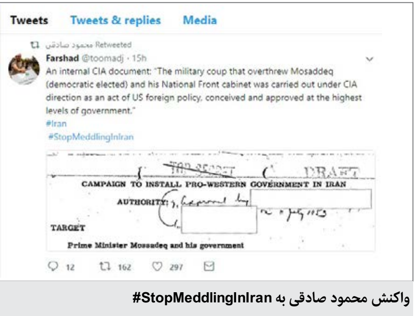
واکنش محمود صادقی به #StopMeddlingInIran

پارسایی اضافه کرد که چگونگی مبارزه با فساد، مشکلات بازار ارز، تغییرات احتمالی در کابینه، آموزش عالی، آموزش و پرورش، دانشجویان، تشکلهای دانشجویی، وضعیت فرهنگیان، حقوق شهروندی، اقوام، ادیان، مذاهب، حقوق زنان و جوانان، وضعیت فعالان محیط زیست، درویش، امنیت اجتماعی، اصلاح قانون انتخابات و تعامل فراکسیون امید با دولت از جمله بحث‌های مطرح شده در دیدار هیات ریسه فراکسیون امید با رئیس جمهور بودند.