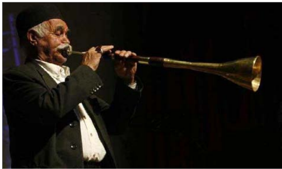
به گفته موسیقی دان ها می توان از ساز سرنا و کرنا در ارکستر سمفونی ها معتبر نیز استفاده کرد

این موسیقی را بیشتر در نوروز می نواختند که به مرور زمان این موسیقی نیز، از دهه ۴۰ با شلیک گلوله توپ در زمانهای گذشته در آستانه از بین رفتن و فراموشی قرار گرفت. علی اکبر مهدی پور یکی از استادان سرنانواز و کرنا ایران بود که اسفندماه ۸۸ در حالی دارفانی را وداع گفت که بسیاری از مردم او را با نام سریال «روزی روزگاری» می شناختند. دو ساز کرنا و سرنا اکنون نیز در بخش های بختیاری نشین به ویژه در بین عشایر چهارمحال و بختیاری بسیار پر کاربرد است و چه در عزا و چه در عروسی از این ابزار موسیقی استفاده می کند. حتی این روزها در شهرکرد مرکز چهارمحال و بختیاری نیز برخی