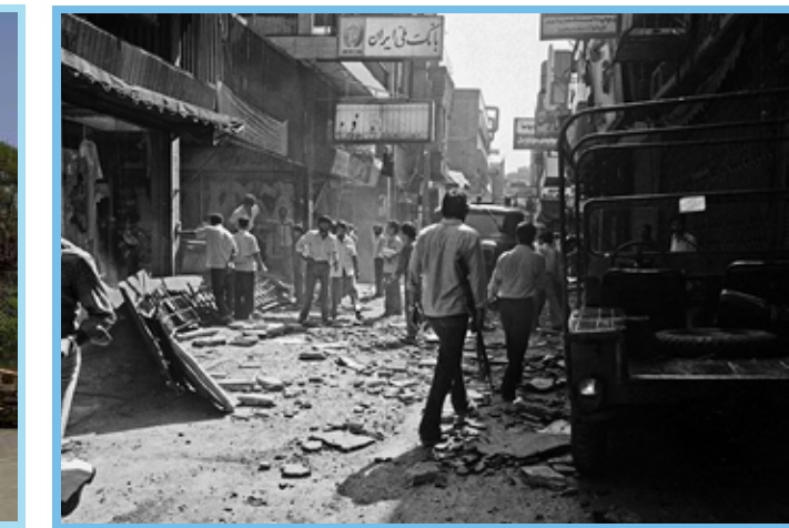
۳۸ سال قبل؛ انفجار مهیب تروریستی در کوچه برلن تهران