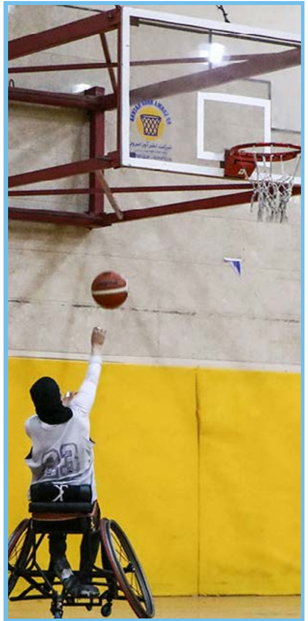
تیم ملی بسکتبال با ویلچر بانوان ایران / باشگاه خبرنگاران جوان