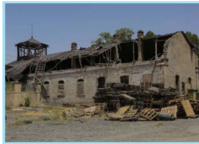
کارخانه قند کهریزک قدیمی ترین کارخانه قند خاورمیانه