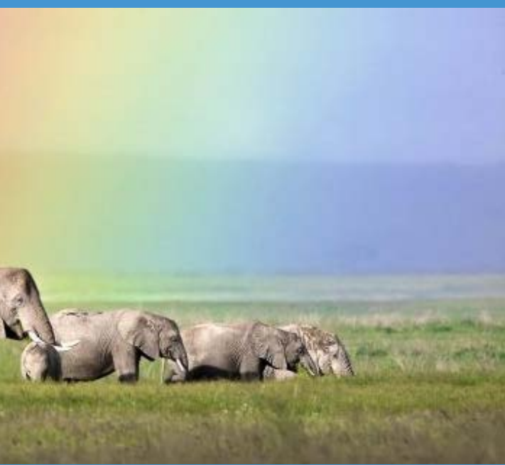
گله‌ای از فیل‌ها در پارک ملی امبوسلی شهرستان کایادو کنیا را می‌بینید که دقیقاً