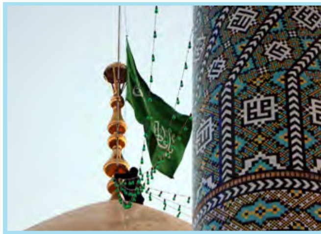
تعویض پرچم گنبد حرم حضرت معصومه (س)