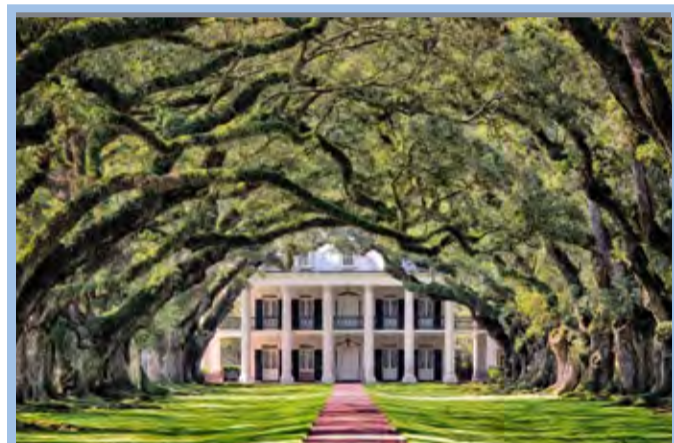
● عکس نشنال جئوگرافیک بیست و هشت درخت بلوط را در کوچه باغی در وچری ایالت لوئیزیانای آمریکا نشان می‌دهد.