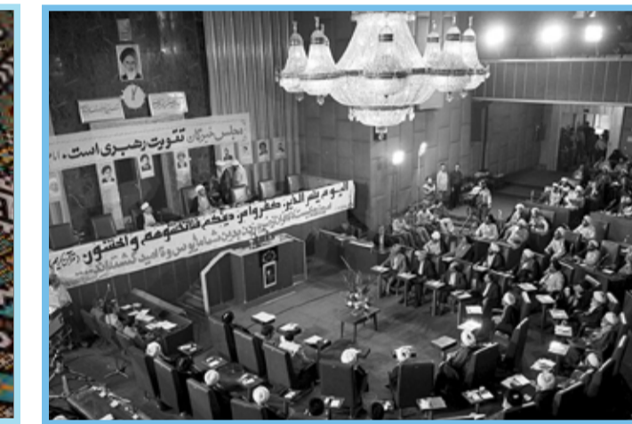
● تصاویر تاریخی از شروع به کار اولین مجلس خبرگان رهبری