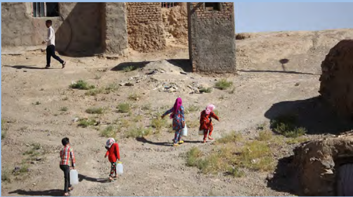
خشکسالی، واژه ای است که مردم خراسان جنوبی از حدود دو دهه قبل تا امروز با آن خو گرفته‌اند.