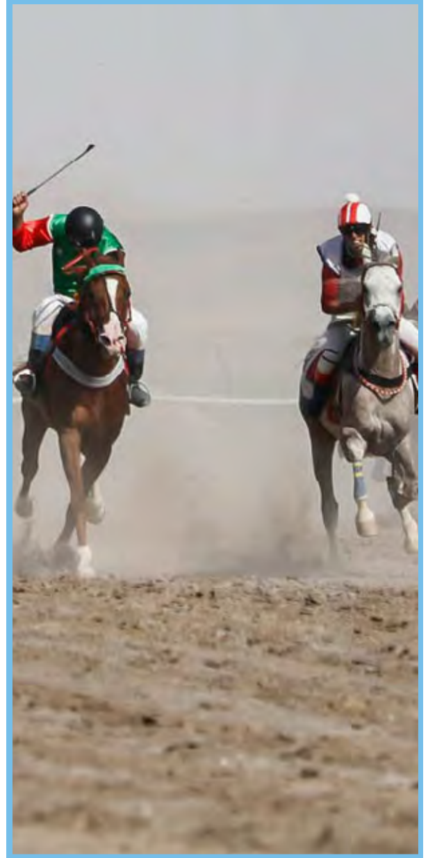
● کورس تابستانه شمال غرب کشور