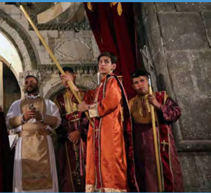
● مراسم مذهبی باداراک در کلیسای تاتائوس مقدس