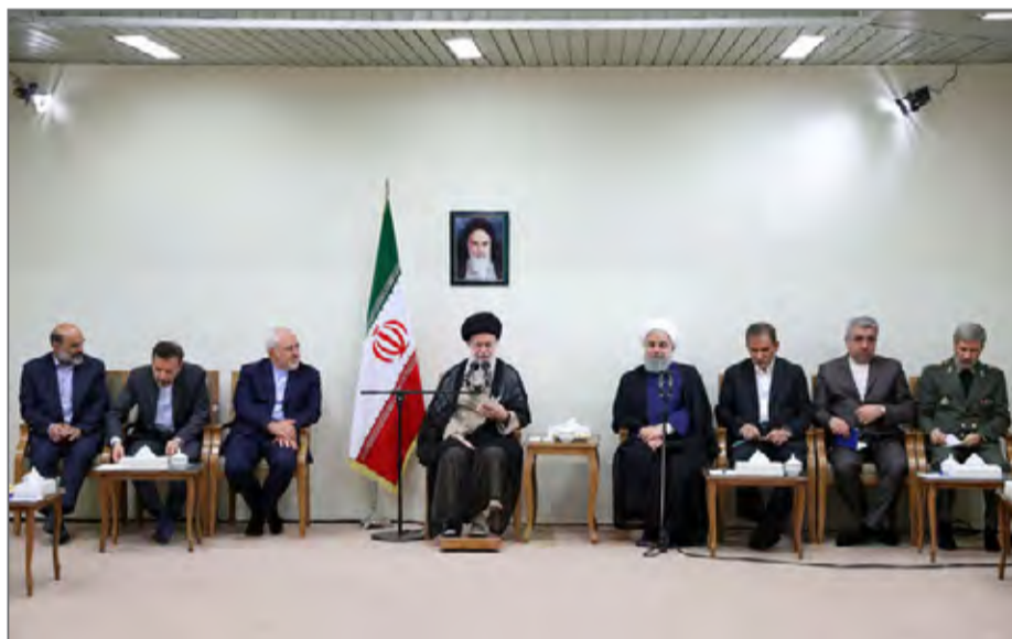
رهبر انقلاب صبح روز گذشته رییس‌جمهور و اعضای هیات دولت را فراخواند

برجام بدهند اما نباید اقتصاد کشور به این موضوع گره زده و معطل آن شود. حضرت آیت‌الله خامنه‌ای با تاکید بر «لزوم گسترش روزافزون دیپلماسی و ارتباطات خارجی»،