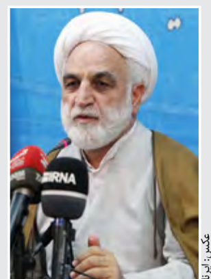
سخنگوی قوه قضاییه: