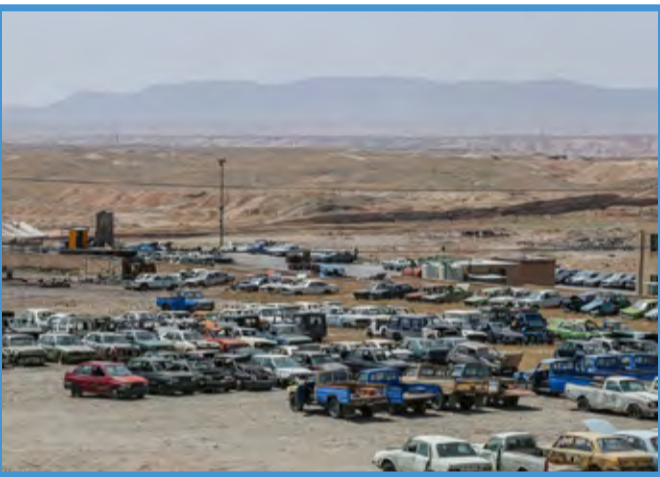
مرکز اسقاط خودروهای فرسوده / باشگاه خبرنگاران جوان