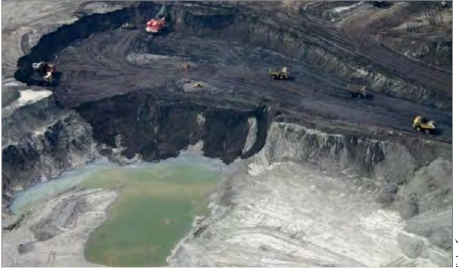
۹۰ درصد ذخایر قیر طبیعی استان کرمانشاه در گیلانغرب وجود دارد

کشور و حتی در جهان به شمار می رود که داشتن این ویژگی منحصر به فرد می تواند زمینه ای برای توسعه و پیشرفت این شهرستان ، استان کرمانشاه و حتی کشور باشد. متأسفانه آن طور که باید به ظرفیت معادن قیر طبیعی این منطقه توجه نشده تا جایی که می توان گفت بیشترین استفاده از این معادن را دلان و واسطه گران می برند و این سرمایه ارزشمند با بهایی بسیار اندک به خارج از کشور صادر می شود. قیر طبیعی از مهمترین مواد معدنی است که امروزه در کشورهای پیشرفته صدها نوع مشتقات هیدرو کربنی (مشتقات نفتی) از آن فرآوری ، تولید و به بازار مصرف عرضه می شود. در صورت احداث کارخانه فرآوری در گیلانغرب، دهها نوع مشتقات قیرطبیعی نظیر موادکربن