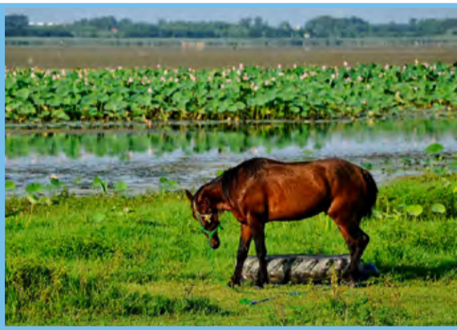
اکوسیستم تابستانی تالاب انزلی / باشگاه خبرنگاران جوان