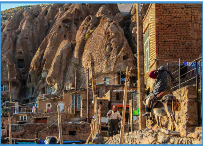
روستای صخره ای کندوان