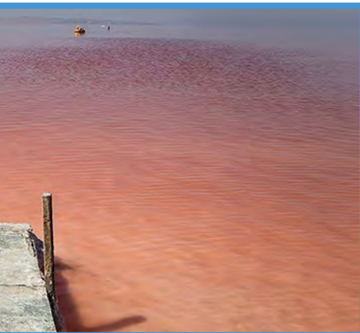
سرخ‌ی دوباره دریاچه ارومیه در تابستان