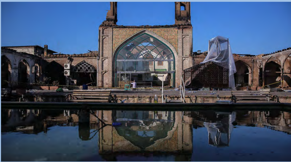
ویرانه‌های مسجد جامع ساری پس از آتش