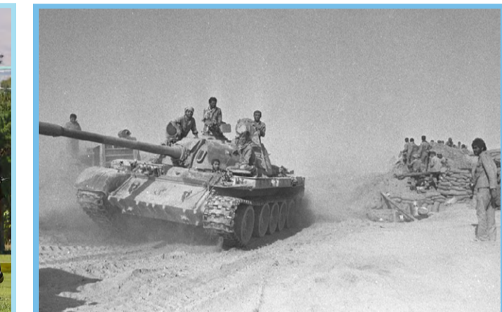
۲۲ تیر ۱۳۶۱؛ عملیات رمضان بزرگترین عملیات زرهی پس از جنگ جهانی دوم