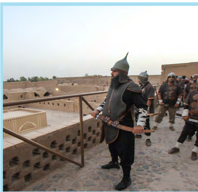
بزرگداشت ثبت جهانی ارگ و منظر فرهنگی بم / فارس