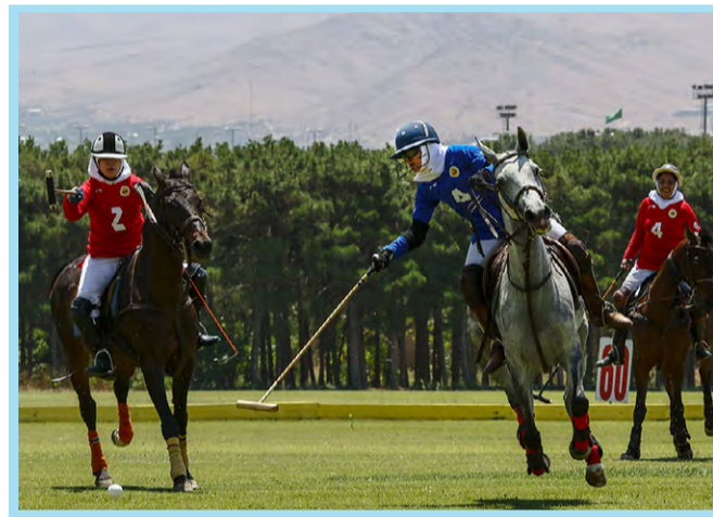
رقابت‌های قهرمانی جوانان بانوان کشور