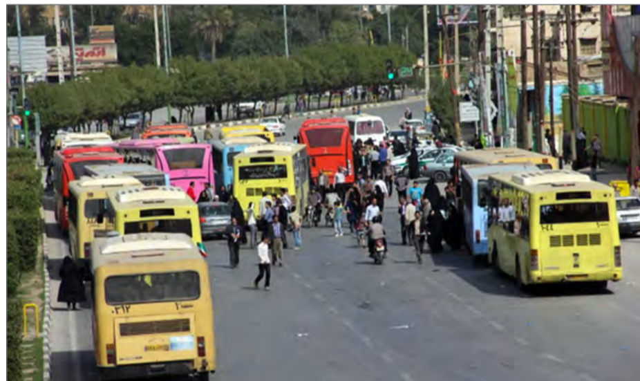
رانندگان اتوبوس از ساعت ۹ تا ۱۹ باید وسایل خنک‌کننده ماشین خود را روشن کنند