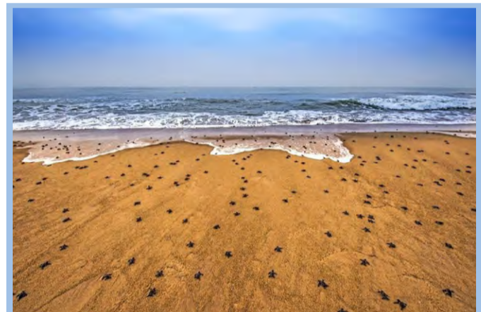
ورود میلیون‌ها بچه‌لاک‌پشت به دریا درعکس نشنال جئوگرافیک