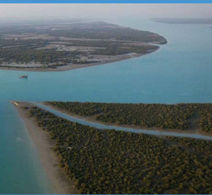
جنگل حرای قشم