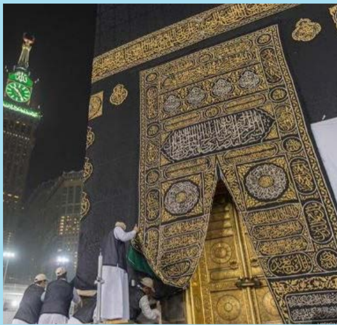
بالا زدن پرده خانه خدا هم‌زمان با مراسم حج