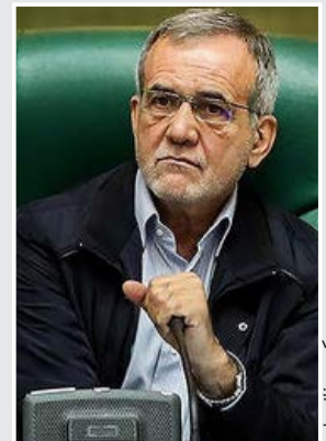
نایب رئیس مجلس:

بسته جدید سیاست ارزی دولت هفته آینده رونمایی می‌شود