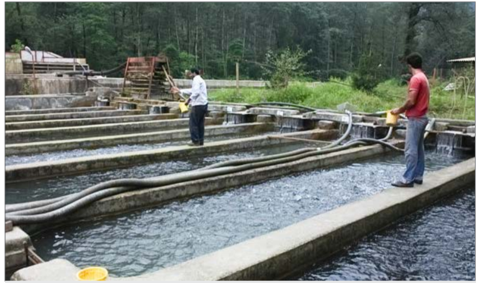
سه هزار و ۳۳۰ واحد پرورش آبیان در مازندران وجود دارد

بر اساس آمارهای رسمی، سه هزار و ۳۳۰ واحد پرورش آبیان در مازندران وجود دارد که از این تعداد ۲۷۶ واحد مربوط به پرورش ماهیان سردآبی و ۱۴ واحد هم ماهیان خاویاری است و بقیه را ماهیان گرم آبی تشکیل می‌دهند. سفید، کپور، آزاد (فیتیفاک) انواع قزل آلا از گونه‌های مهم ماهیان گرم آبی و سرد آبی مازندران است. سالانه به طور متوسط هفت هزار تن انواع ماهی استخوانی (کفال، سفید و کپور) توسط چهار هزار و ۲۰۰ ماهیگیر از آب‌های دریای خزر در استان مازندران صید می‌شود. حدود ۸۰۰ قطعه آبیان با مساحت ۱۷ هزار هکتار و ظرفیت حدود ۳۵۰ میلیون متر مکعب آب در استان مازندران وجود دارد که هرساله علاوه بر تامین آب کشاورزی، انواع ماهی در آنها تولید و به بازار داخلی و خارجی عرضه می‌شود.