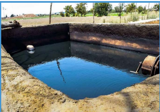
نشت نفت به زمین‌های کشاورزی جنوب تهران