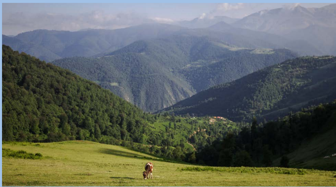
طبیعت ارتفاعات برن - گیلان / میزان