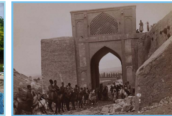
دروازه قرآن شیراز در قدیم