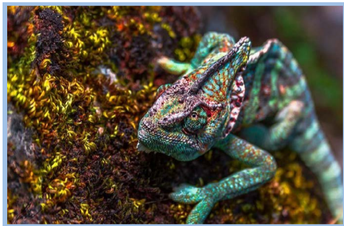
عکس نشنال جئوگرافیک رنگ‌های متفاوت و درخشان پوست یک آفتاب‌پرست خانگی را نشان می‌دهد.