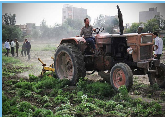
امحای ۶ هکتار سبزی آلوده به فاضلاب در همدان