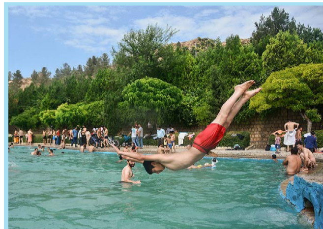
شنای تابستانه در «بش قارداش»