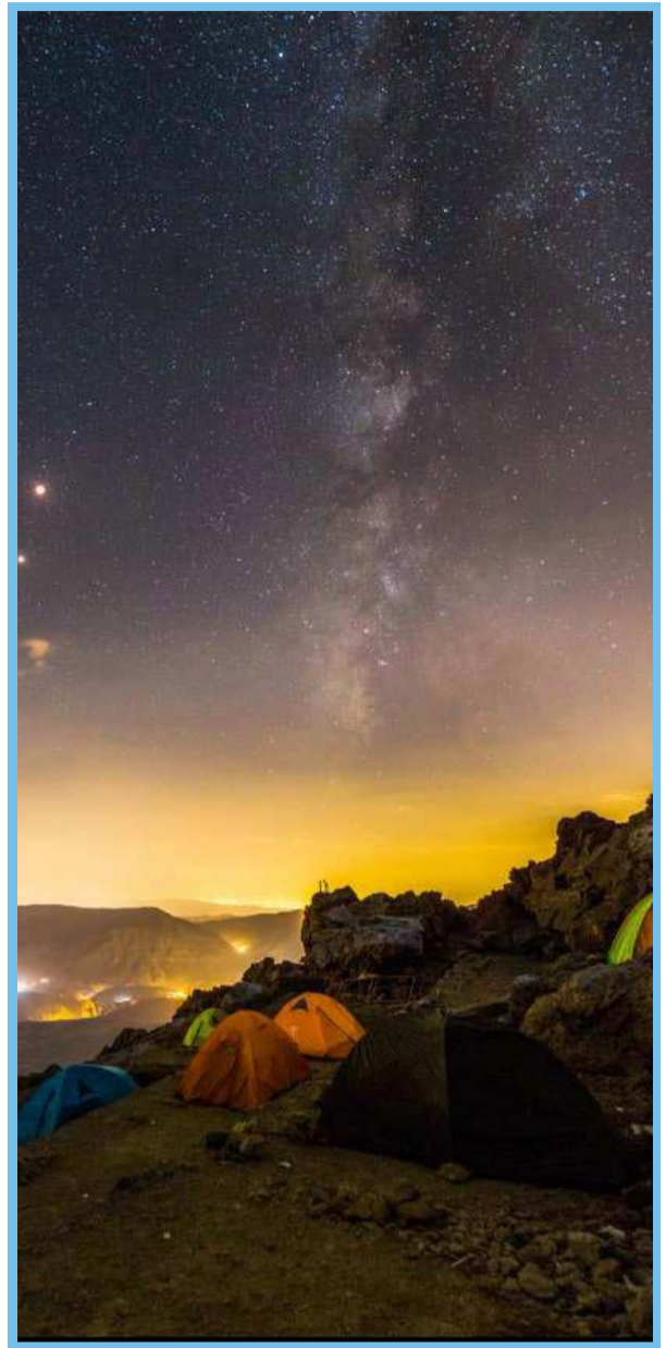
آسمان شب در ارتفاع ۴۲۰۰ متری قله دماوند