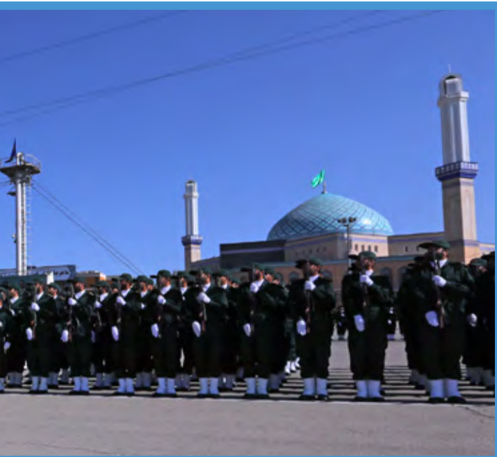
● مراسم دانش‌آموزی دانشجویان افسری و تربیت پاسداری دانشگاه امام حسین