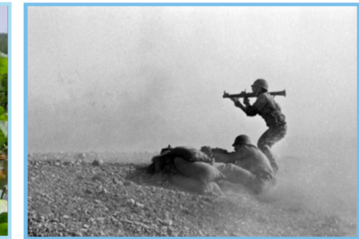
● نهم تیر ۱۳۶۵ - آغاز عملیات «کربلای یک» ابرنا