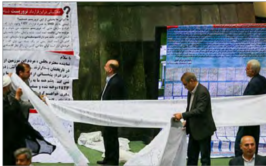
تومار برخی نمایندگان مجلس علیه لایحه مقابله با تامین مالی تروریسم سه هفته پیش

و برقراری طیف وسیع‌تری از مجازات‌ها برای ارتکاب جرایم پولشویی و تضمین وضع قوانین و آیین‌نامه‌های مناسب جهت صادره اموال دارای ارزش متناظر از ایران خواسته تا چهار ماه دیگر به آن‌ها عمل کند. در حالی تا چهار ماه دیگر ایران فرصت دارد الزامات FATF را اجرایی کند که چندی پیش مرکز پژوهش‌های مجلس در گزارشی یکی از موانع غیرتحریمی توسعه روابط بانکی ایران با سایر کشورها را به خواسته‌های FATF ربط داده بود. این نهاد پژوهشی در گزارش خود اعلام کرده بود که «وضعیت ایران در زمینه مبارزه با پولشویی و تامین مالی تروریسم مناسب نیست.» به اعتقاد مرکز پژوهش‌ها، برای توسعه روابط بانکی ایران با سایر کشورها، اصلاح درونی نظام بانکی کشورمان مقدم بر هر عامل دیگری باید باشد.