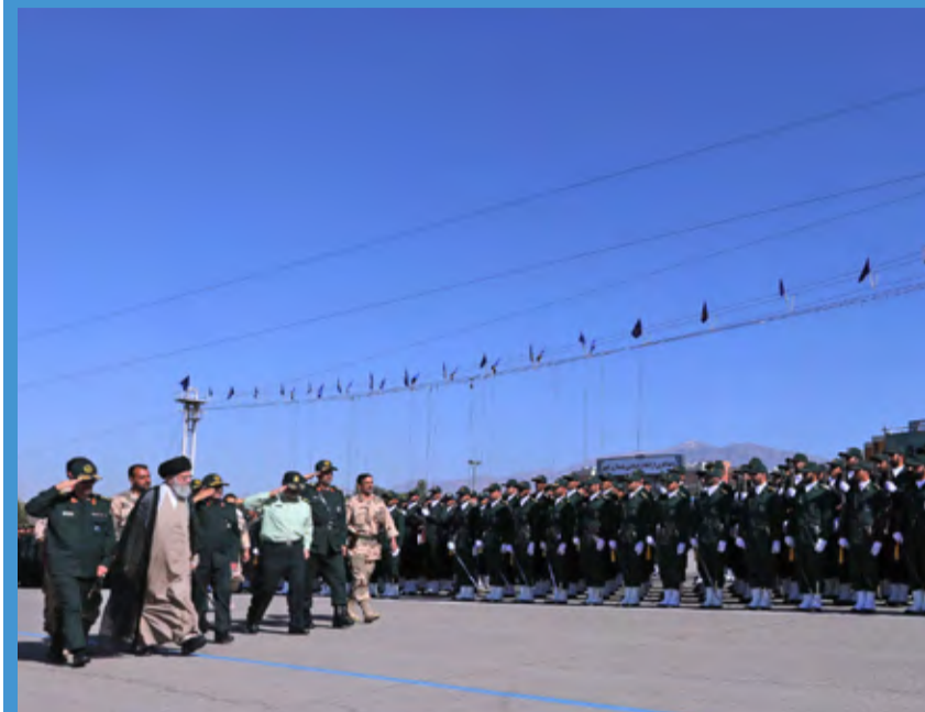
کخامنه‌ی (علیه‌السلام) با حضور و سخنرانی حضرت آیت‌الله خامنه‌ای فرمانده کل قوا برگزار شد.