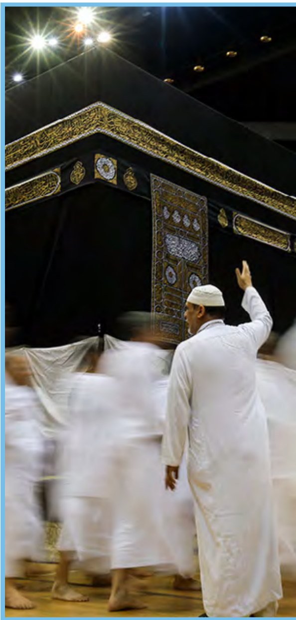
● همایش آموزشی توجیهی زائران حج تمتع ۹۷ / میزان