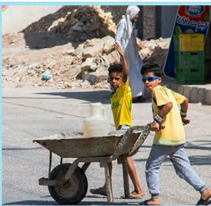
● بحران آب در آبادان