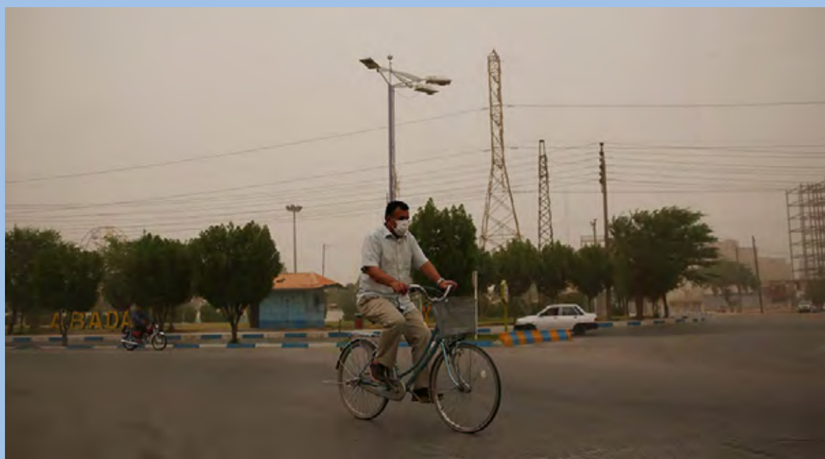
هوای غبارآلود آبادان