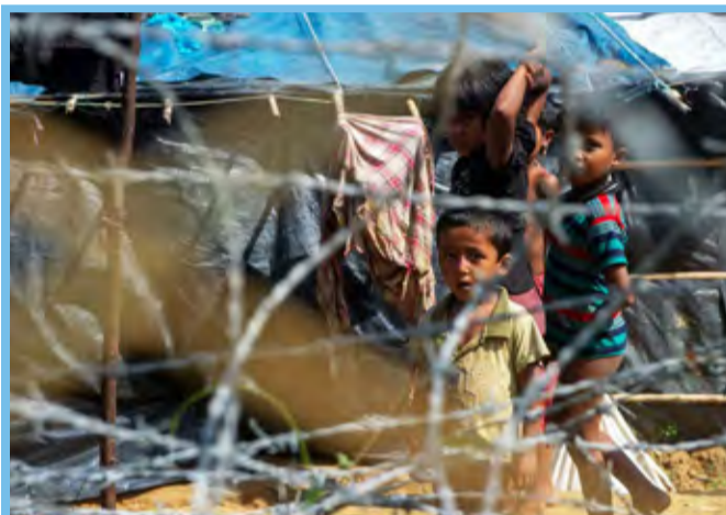
وضعیت نابسامان پناهجویان روهینگایی در ایالت راخین