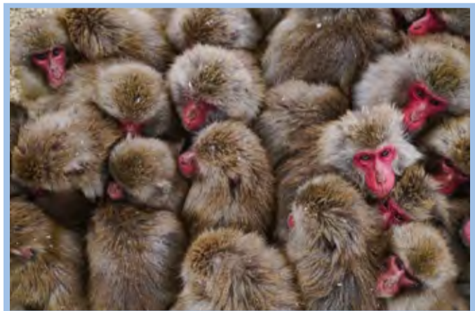
● میمونهاهای ماکاک ژاپنی برای مقابله با سرما و ایجاد گرما به هم می‌پیوندند. نشنال جئوگرافیک