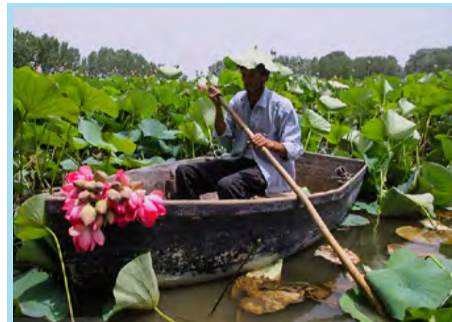
نیلوفرهای آبی مازندران / میزان