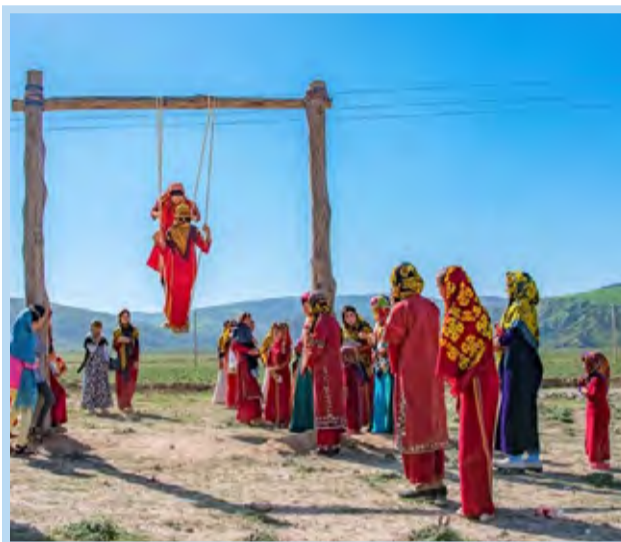
زندگی عشایر یگانشین استان گلستان