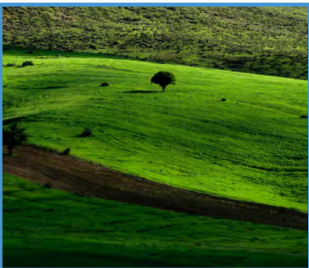
«پیشه» لرستان