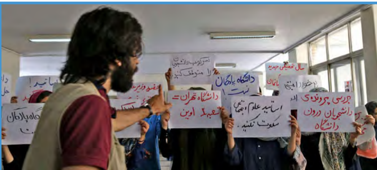
تداوم اعتراض دانشجویان دانشکده علوم اجتماعی