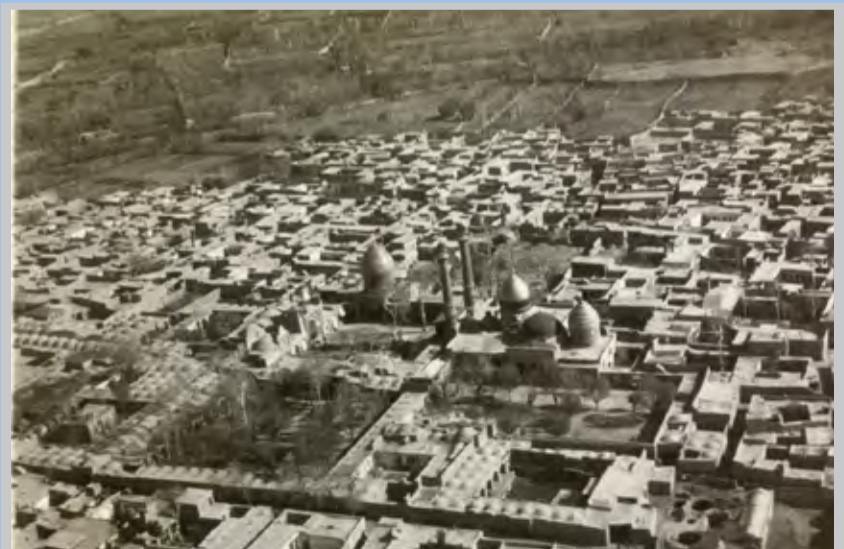
عکس هوایی از شهرری در قدیم