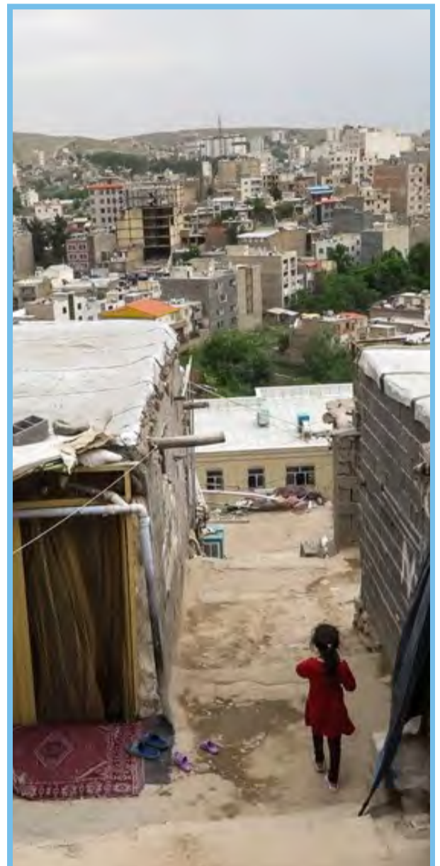
حاشیه نشینی در بومهن