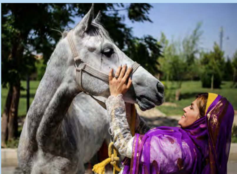
نمایشگاه بین المللی اسب و حیوانات همزیست / مهر