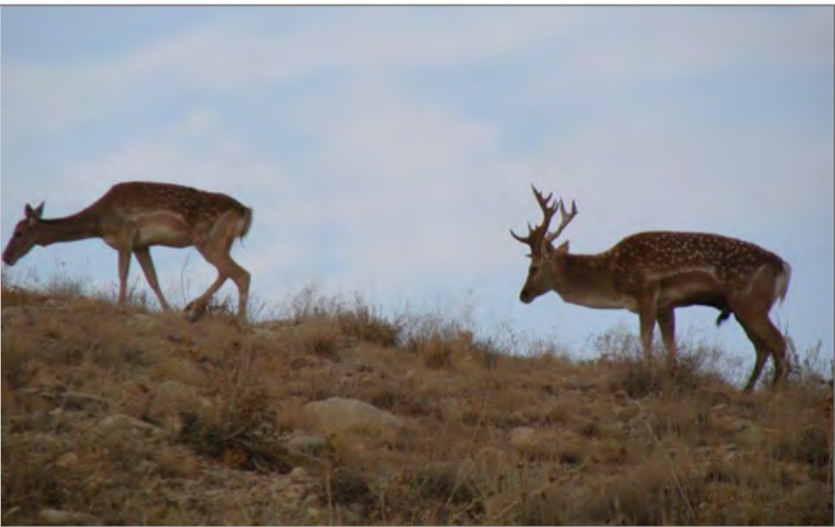
پناهگاه حیات وحش موزه جزو بزرگ‌ترین پناهگاه‌ها در ایران است