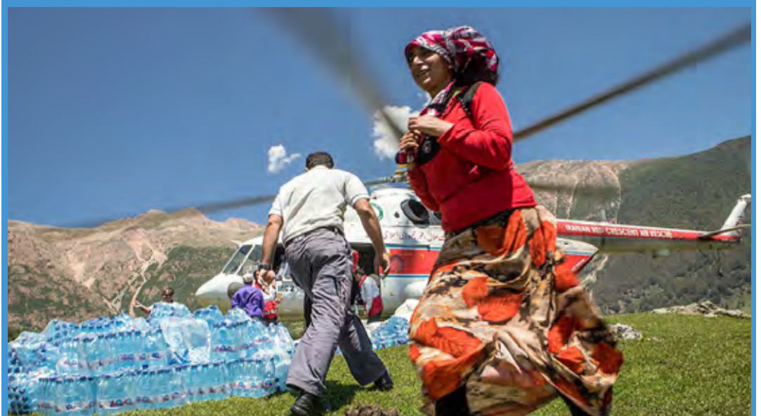
امدادرسانی به روستاهای سیل زده رودسر / فارس