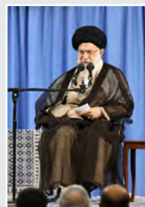
رهبر انقلاب: مجلس مستقل برای مبارزه با پولشویی قانون بگذارد