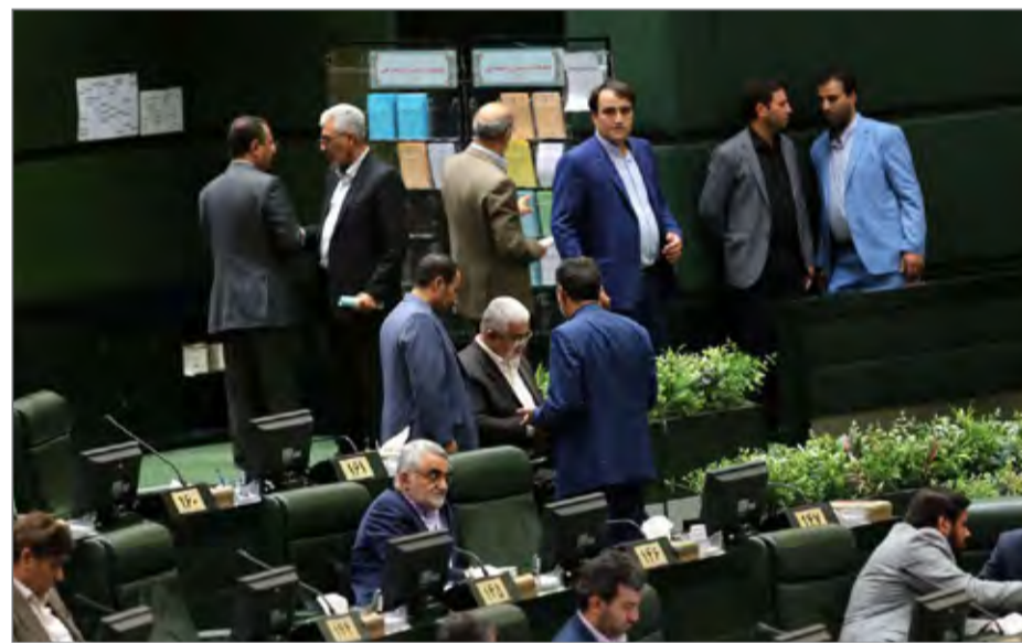
افزایش پنج درصدی سهمیه کنکور ایتارگران یک بار دیگر با موافقت مجلس روبرو شد

ارجاع دو تبصره به کمیسیون البته روز گذشته نمایندگان مجلس با تبصره مورد اشاره رییس