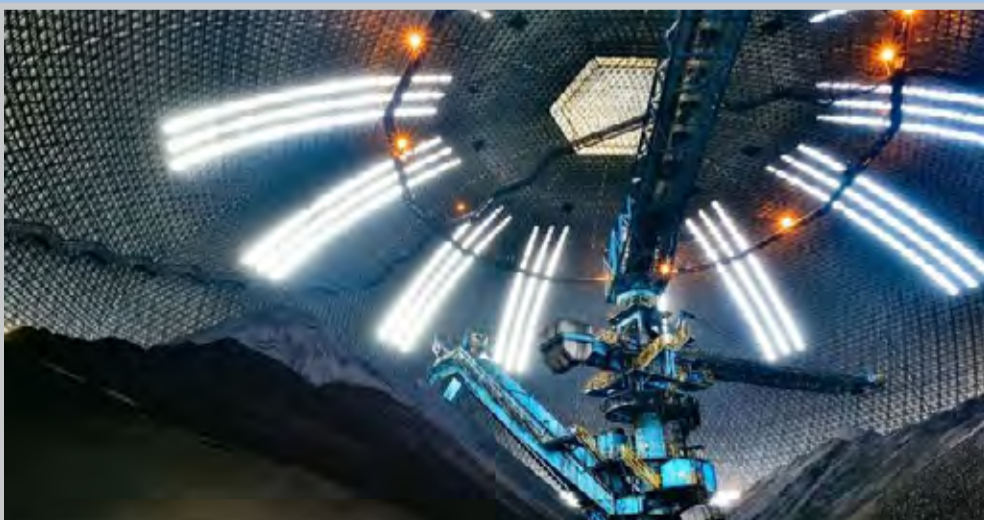
عکس نشانال جئوگرافیک نیروگاه برق در تایوان را نشان می دهد که با سوخت زغال سنگ کار می کند. سقف نیروگاه به کاهش آلودگی هوا کمک می کند.