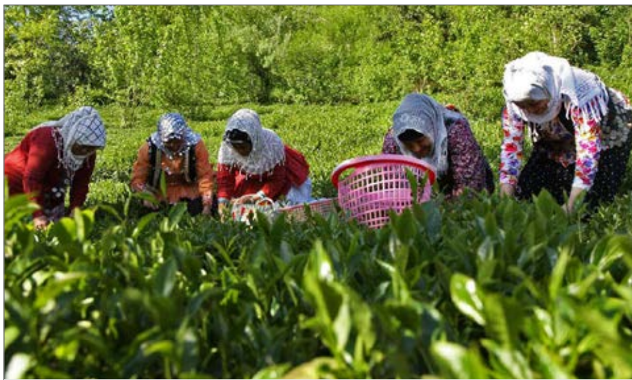
استان‌های گیلان و مازندران ۲۵ تا ۲۸ هزار هکتار باغ چای دارند

های هر کیلوگرم بین ۱۶۰ تا ۳۶۰ هزار ریال عرضه می‌شود. از مجموع بهره‌برداری یک ساله چای استان‌های گیلان و مازندران، ۴۵ درصد آن را چای بهار تشکیل می‌دهد؛ محصولی که مرغوبیت آن مدیون اولین رویش برگ‌های بهاری بوته‌های چای و غذای تجمیع شده در ریشه آن است و یا از بهترین شاخساره بدست می‌آید و قابلیت چای‌سازی بهتری نسبت به برگ‌های سایر فصل‌ها داشته و به دلیل عطر و طعم بالای آن، طرفداران زیادی هم دارد. برگ سبز چای در سه فصل بهار، تابستان و پاییز برداشت می‌شود؛ برخی کارشناسان معتقدند اولین برداشت در هر سه فصل از بهترین چای محسوب می‌شود و عده‌ای دیگر نیز بر این باورند که چای بهار جایگاه ویژه‌ای در صنعت