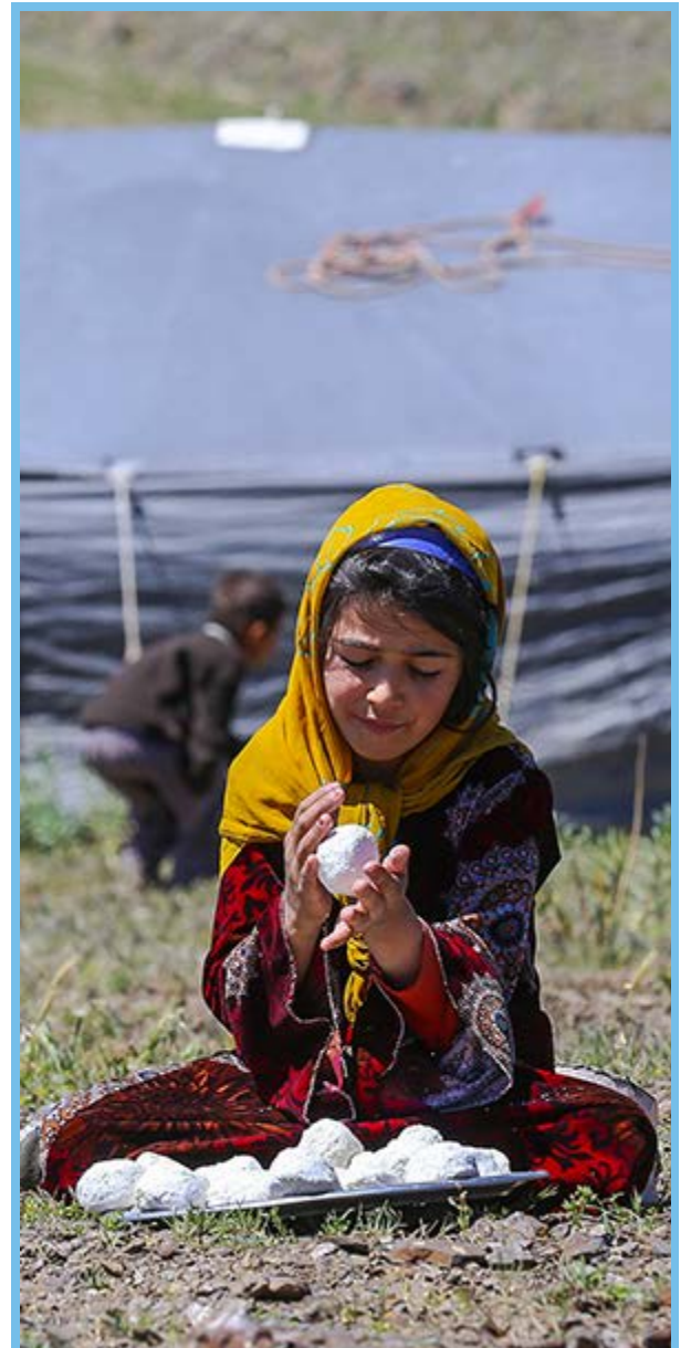
عشایر کوچ نشین همدان / میزان