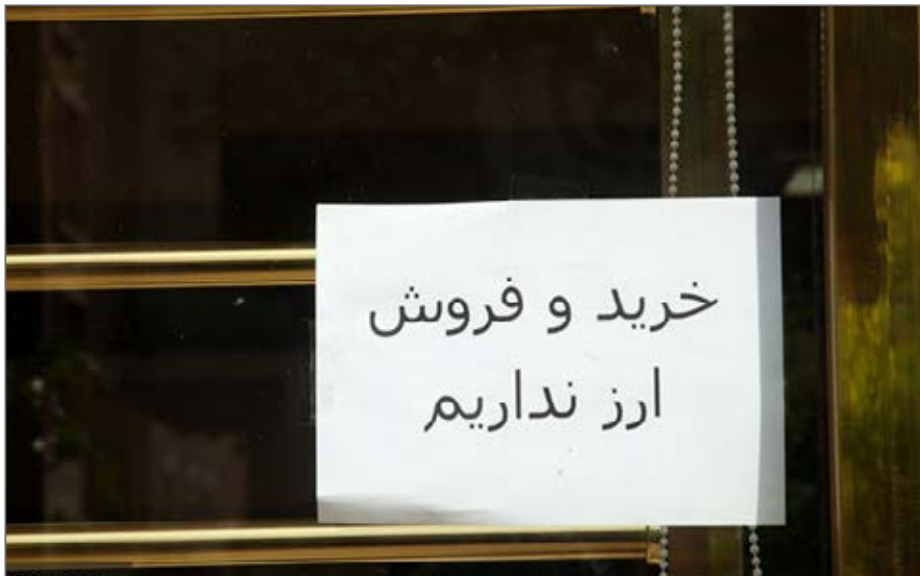
مرکز پژوهش‌ها حذف صرافی‌ها از فعالیت‌های ارزی را در شرایط فعلی اشتباه می‌داند

مرکز پژوهش‌های مجلس سیاست‌های ارزی دولت را دارای نقاط ضعف قابل توجه دانست. اگرچه در گزارشی که اخیراً این مرکز پژوهشی از تحولات بازار ارز منتشر کرده، موضع‌گیری فعال، تلاش برای سامان‌دهی ارز حاصل از صادرات، تلاش برای تخصیص منابع ارزی با نیازهای کشور، تلاش برای کنترل تقاضای قایبی اسکناس ارز و سامان‌دهی استثنائات خاص واردات در مناطق آزاد به عنوان پنج نقطه قوت اقدامات ارزی دولت پس از افزایش دست‌کم ۳۰ درصدی نرخ ارز در فروردین امسال