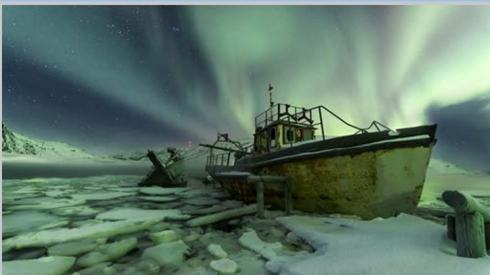
درخشش نورهای قطبی در پس‌زمینه کشتی‌های به گل نشسته روسیه در عکس روز نشنال جئوگرافیک