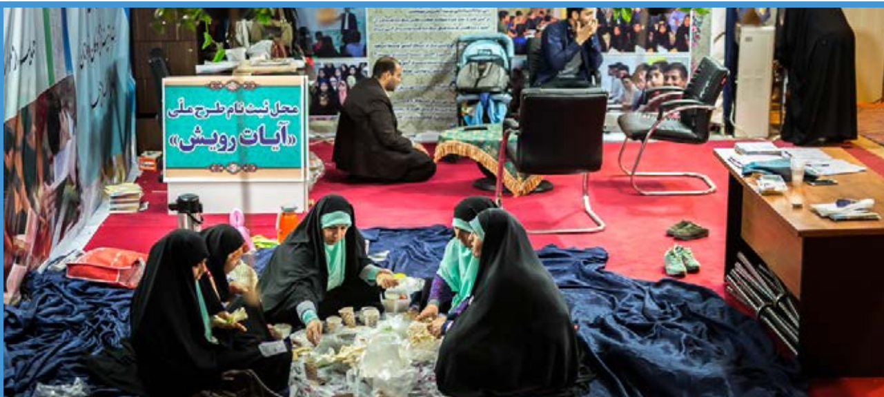
بیست و ششمین نمایشگاه بین المللی قرآن کریم / میزان