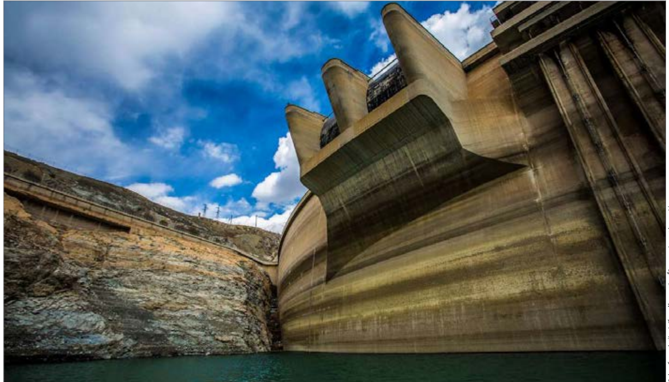
دختر سوز زنگنه روز نسبت به میانه‌گین بلند مدت ۷ درصد کاهش یافته است.