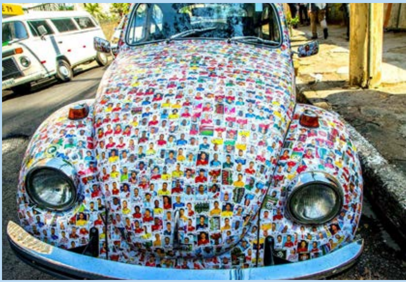
یک فولکس قورباغه‌ای دربرزیل که با برچسب‌های جام جهانی فوتبال ۲۰۱۸ تزیین شده است.