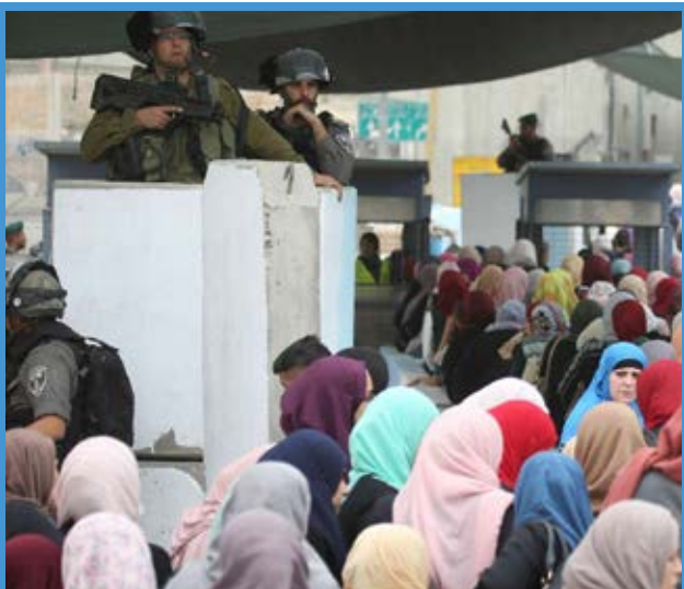
تدابیر شدید امنیتی پیش از شروع نماز جمعه در قدس