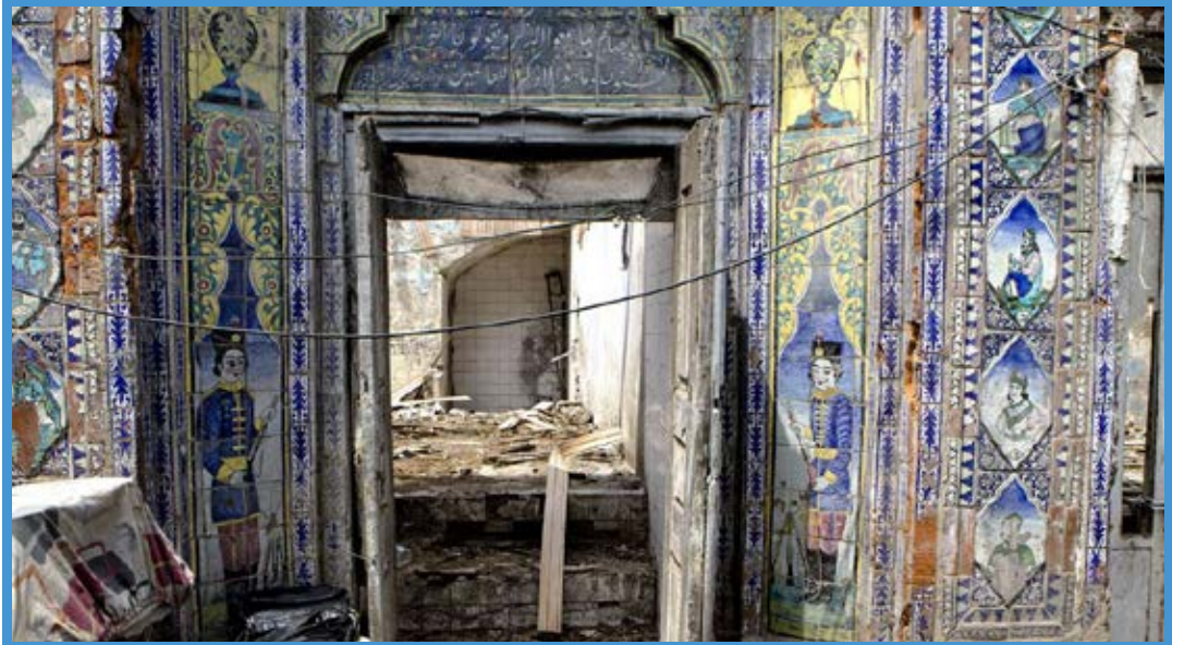
حمام ثبت ملی گلزار رشت که این روزها رو به تخریب کامل است.