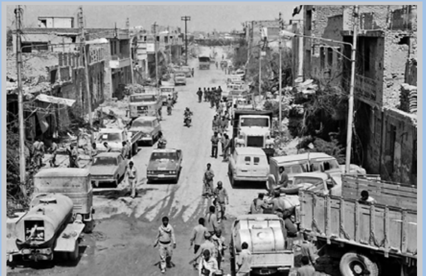
خرم شهر پس از آزادسازی - خرداد ۱۳۶۱