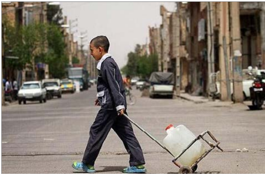
آب اصفهان در سه هفته گذشته سه بار قطع شد