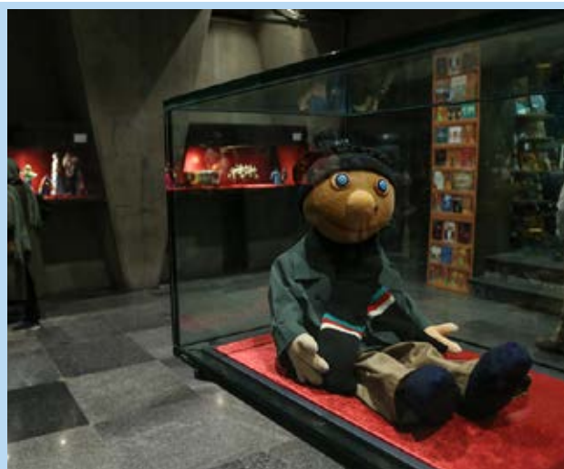
جشنواره عروسک در گذر زمان. بازدید تا دهم خرداد ماه ادامه دارد.