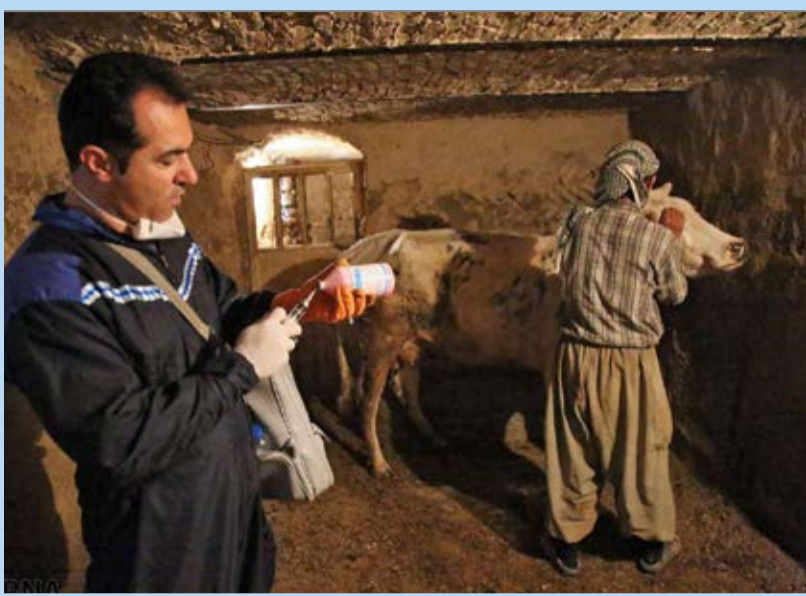
● مایه کوبی تب برفکی دام در سنندج / ایرنا