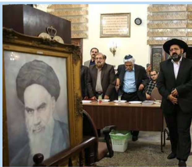
● بزرگداشت امام خمینی (ره) در کنیسه کلیمیان تهران