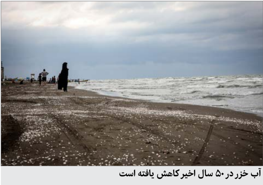
آب خزر در ۵۰ سال اخیر کاهش یافته است

شد: بررسی زمین شناسی نیز در وضعیت کیفی آب مازندران اثرگذار است. وی افزود: یکپارچه سازی داده ها و پردازش آن‌ها، کمبود منابع مالی، عدم هماهنگی و همکاری بین ارگان ها و نهادهای مختلف نبود تکنولوژی مناسب از جمله مسائل و مشکلات ارزیابی منابع آب است. کاردل با اشاره به ترویج الگوی صحیح مصرف آب تصریح کرد: اولویت بندی نوع مصرف آب، پایش مستمر منابع آب مازندران و برنامه ریزی اصولی ذخیره سازی در بلندمدت، پایش آلودگی آب سطحی و زیرزمینی و ردیابی منشا آلودگی، تصفیه فاضلاب ها و پساب صنایع پیش از ورود به منابع آب، خاک و هوا و استفاده مجدد از این منابع راهکارهایی به منظور مدیریت منابع آب است. وی، تعمیر شبکه های فرسوده، افزایش هزینه