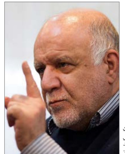
عکس تهران ۹

همکاری‌ها و همفکری‌ها برای عبور از شرایط سخت کنونی عنوان کرد و افزود: وزارت نفت و کمیسیون انرژی در این زمینه دارای اتحاد نظر هستند. وی از تشکیل کمیته‌ای بین وزارت نفت و کمیسیون انرژی مجلس شورای اسلامی به منظور عبور از وضع کنونی خبر داد و با بیان این‌که توتال هم اکنون مشغول مذاکره