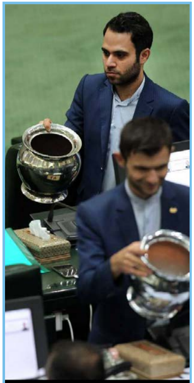
● رای گیری انتخاب ریاست مجلس