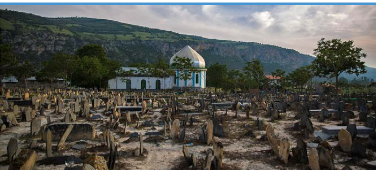
● گورستان باستانی سفیدچاه