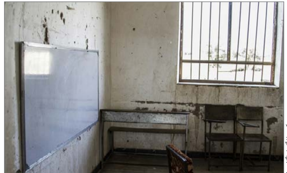
۶۵ هزار مدرسه در ایران نیازمند تخریب و یا مقاوم‌سازی هستند

مدارس، فضاهای نیازمند تخریب و بازسازی مدرسی هستند که عمدتاً از عمر آن‌ها بیش از ۳۰ سال گذشته. این بدین معنی است که ۶۵ هزار مدرسه در ایران پیش از سال ۶۷ ساخته شدند و در طول ۳۰ سال گذشته بازسازی صورت نگرفته که دلیل اصلی این امر به بی‌پولی برمی‌گردد. به طوری که رخسانی مهر گفته «در مجموع حدود چهار هزار میلیارد تومان اعتبار برای نوسازی مدارس داریم که البته در سال‌های گذشته ۵۰ درصد آن محقق می‌شد؛ اسمال شروع خوبی داشتیم و در سه ماهه اول صد در صد ردیف‌های ملی ما تخصیص داده شد. هر چند معتقدیم این اعداد و ارقام کفایت تخریب و بازسازی بناهای