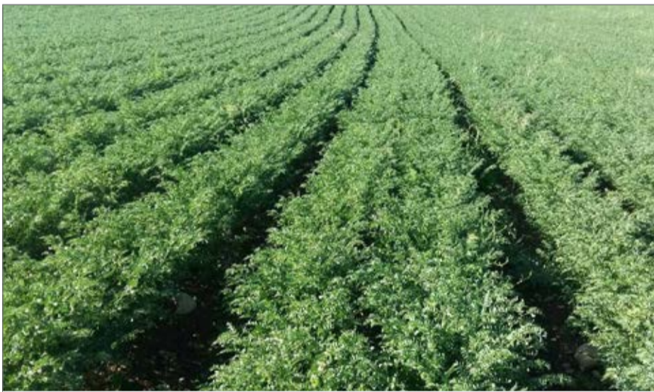
۶۰ درصد نخود کشور در کرمانشاه تولید می‌شود

رییس اتاق بازرگانی استان کرمانشاه گفت: اگر این روند ادامه پیدا کند، طی سال‌های اخیر بازار به کشورهای رقیب از جمله روسیه واگذار خواهد شد و حاشیه سود کشاورزان ما از کشت نخود پایین