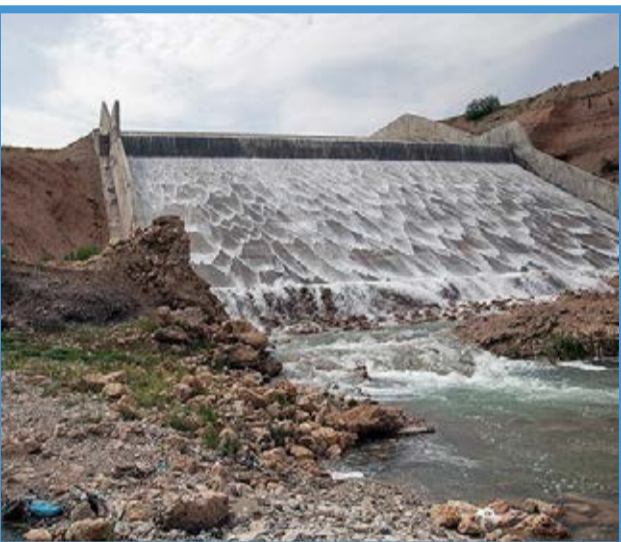
● سرریز کردن سد آزادی در کرمانشاه