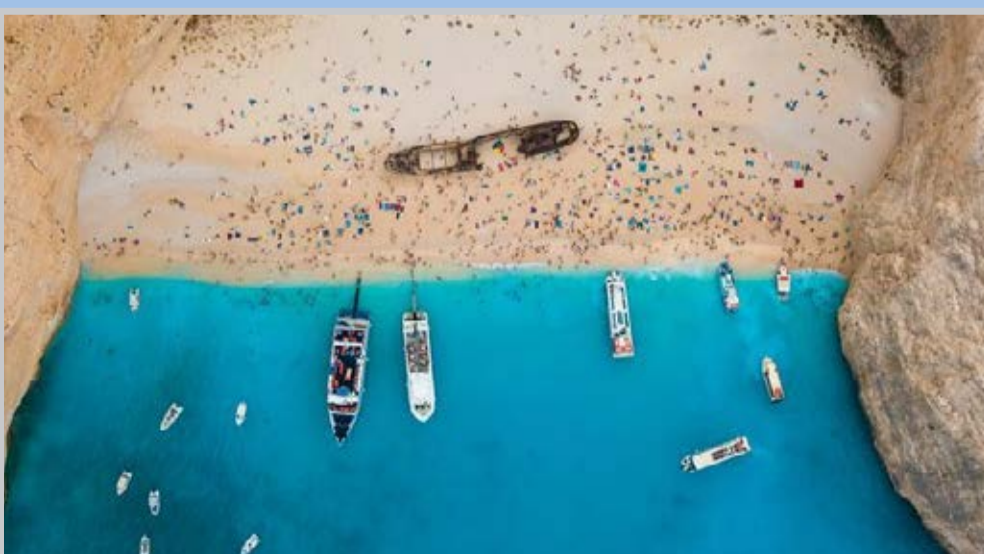
● ساحل کشتی شکسته یونان در عکس روز نشنال جئوگرافیک