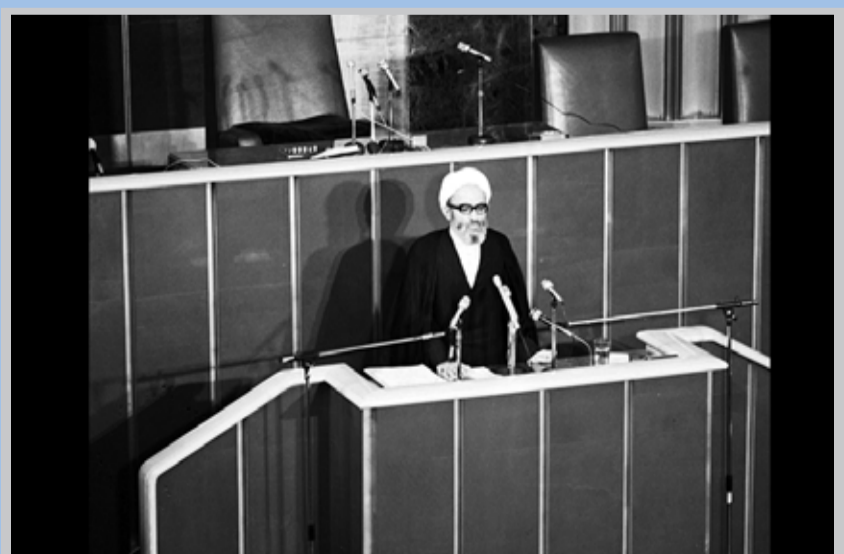
● اولین دوره مجلس شورای اسلامی