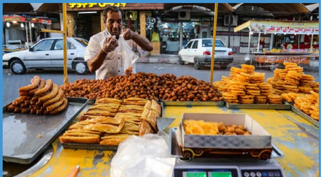
کارگاه تهیه و طبخ زولبیا و بامیه در اهواز