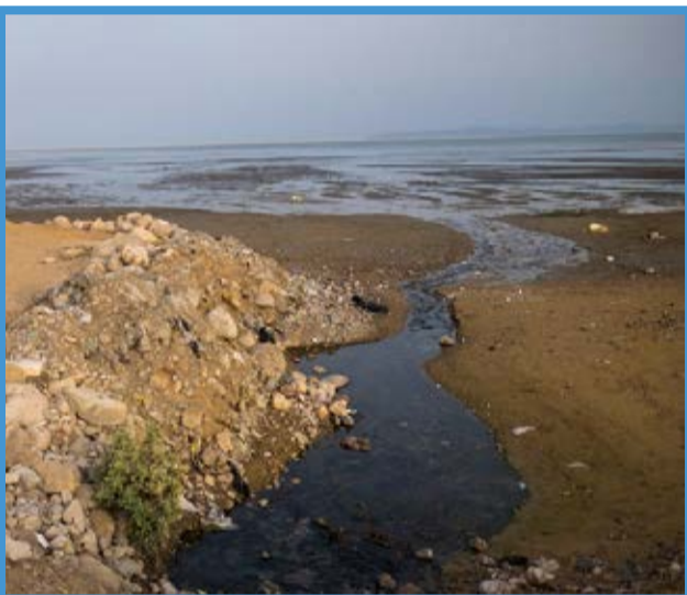
ساحل آلوده خلیج فارس / ایسنا