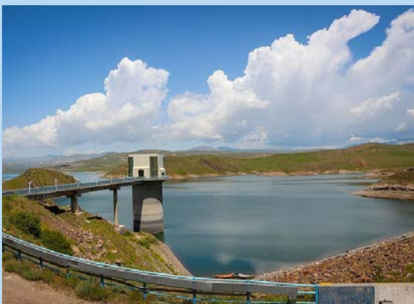
کاهش آب سد ستارخان شهرستان اهر / تسنیم