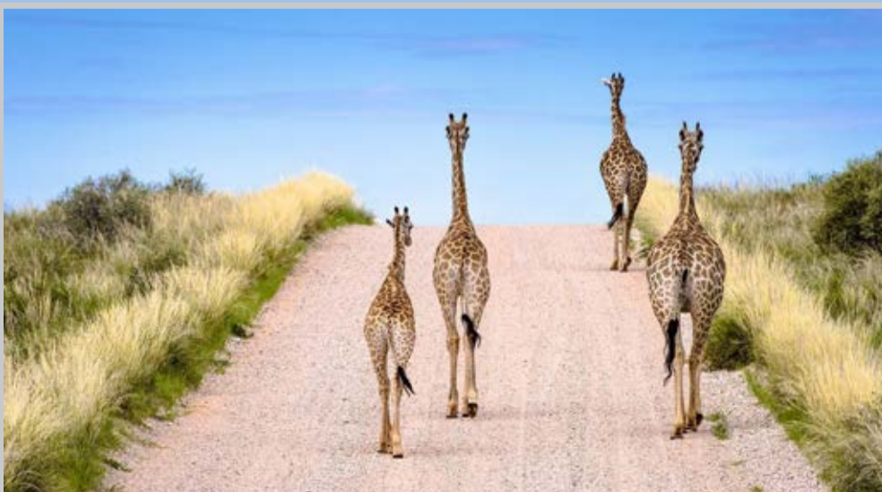
زرافه‌ها در ادنویل آفریقای جنوبی- عکس روز نشنال جئوگرافیک