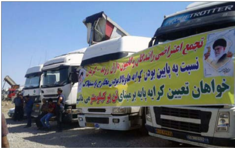
اعتصاب کامیون‌داران در برخی شهرها همچنان ادامه دارد

او با اشاره به نشست دیروز کمیته حمل و نقل کمیسیون عمران مجلس، گفته در این جلسه به اعتراضات رانندگان با حضور مسوولان کانون انجمن‌های صنفی کامیون داران و اتوبوس داران و رییس سازمان راهداری و پلیس راه کشور رسیدگی شد. این نماینده با بیان اینکه عمده مشکلات کامیون داران بحث بیمه رانندگان به لحاظ اینکه دولت سهم خود را به تامین اجتماعی پرداخت نکرده بود، است اضافه کرده عدم پرداخت حق بیمه رانندگان در بخشی که متوجه دولت بوده مشکلاتی را برای این قشر ایجاد کرده بود.