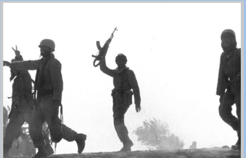
آغاز عملیات طریق القدس و فتح بستان