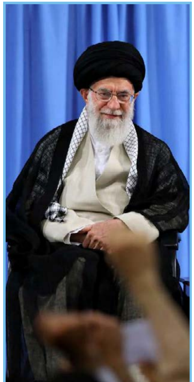
دیدار جمعی از دانشجویان با مقام معظم رهبری