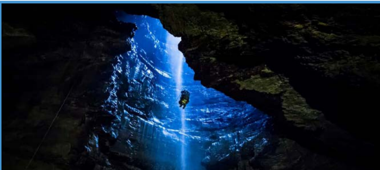
یک بازدیدکننده درحال بازدید ازغار گیبینگ گیل، بزرگترین غار بریتانیا