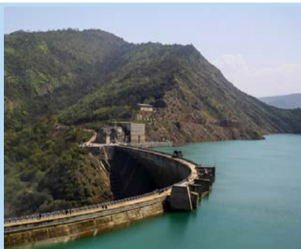
سد شهید رجایی در نزدیکی ساری، یکی از دیدنی‌های استان مازندران