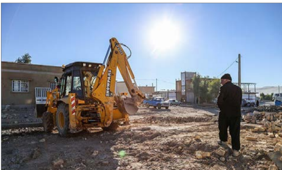
در کرمانشاه باید ۳۵ هزار واحد مسکونی کاملا دوباره احداث شوند