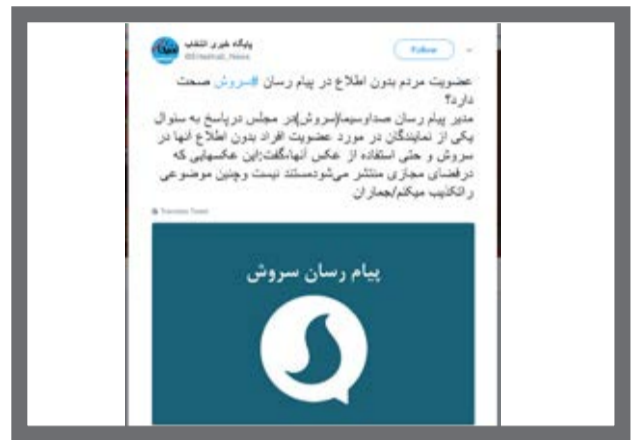
چندی پیش تصاویری در فضای مجازی دست به دست می‌شد که نشان می‌داد پیام‌رسان «سروش» برای افرادی که عضو این پیام‌رسان نبودند، شناسه کاربری همراه با عکس ساخته شده! «انتخاب» از تکذیب این موضوع توسط مدیر سروش خبر داده و کاربران نیز در واکنش به این موضوع گفتند شکایت و پیگیری می‌کنند.