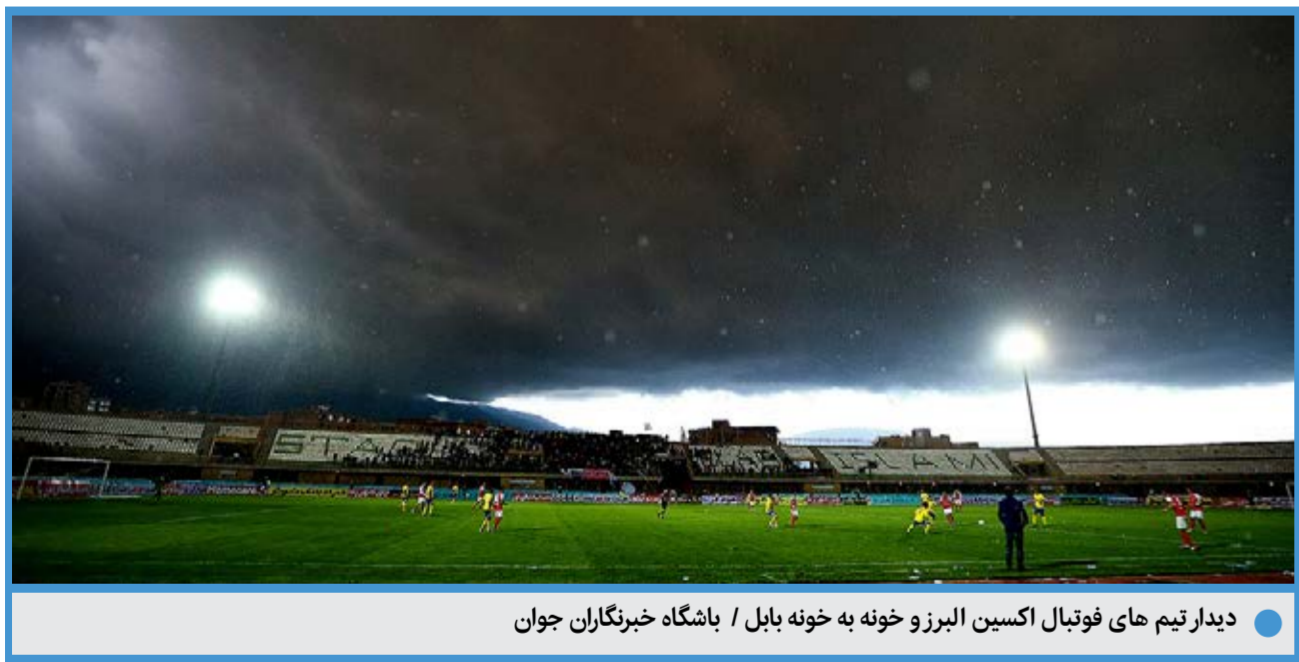
دیدار تیم های فوتبال اکسین البرز و خونه به خونه بابل / باشگاه خبرنگاران جوان