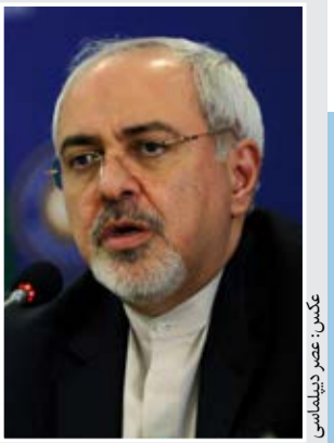
عکس: عصر دیپلماتیک

افت آزادی سفر ایرانی‌ها در سال ۹۶ شرایط سفرهای بدون ویزا برای شهروندان ایرانی در سال ۱۳۹۶ به مراتب بدتر از سال ۱۳۹۵ بوده است