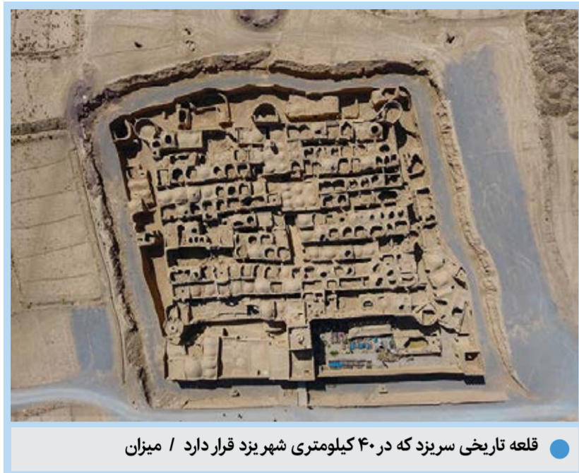
قلعه تاریخی سریزد که در ۴۰ کیلومتری شهریزد قرار دارد