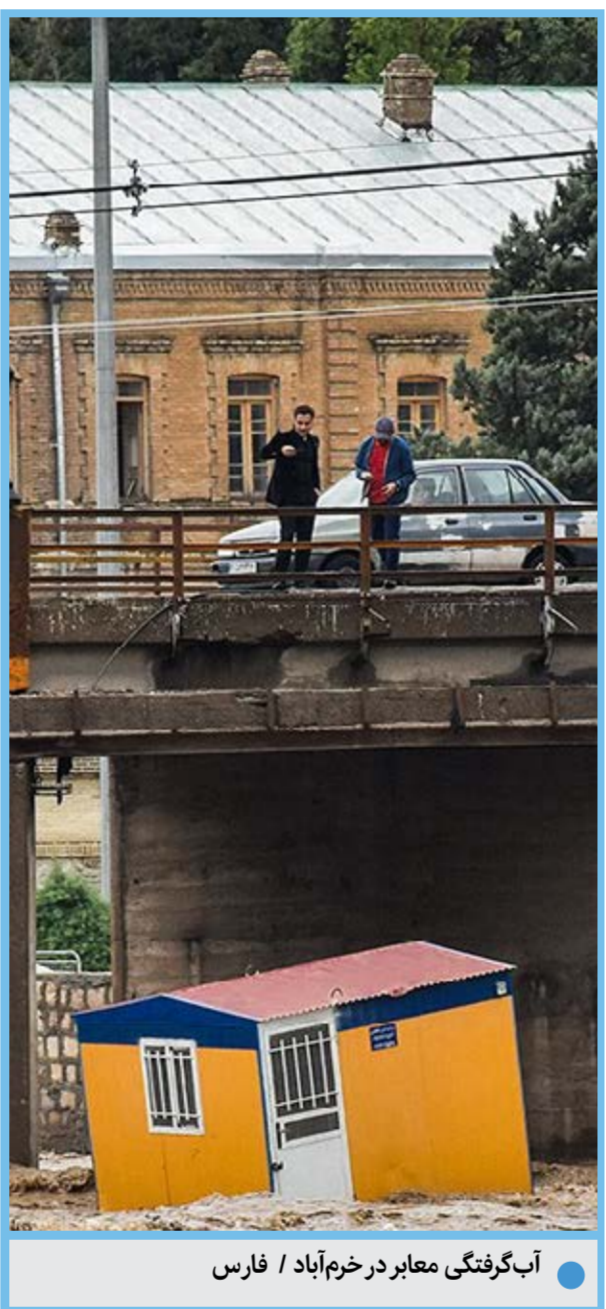
آبگرفتگی معابر در خرمآباد / فارس