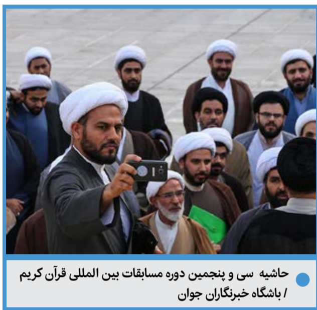
حاشیه سی و پنجمین دوره مسابقات بین المللی قرآن کریم / باشگاه خبرنگاران جوان