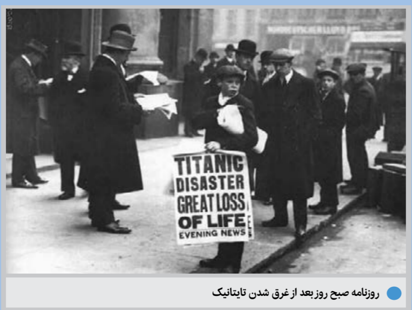
روزنامه صبح روز بعد از غرق شدن تایتانیک