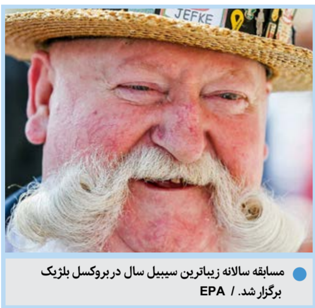
مسابقه سالانه زیباترین سیبیل سال در بروکسل بلژیک برگزار شد.