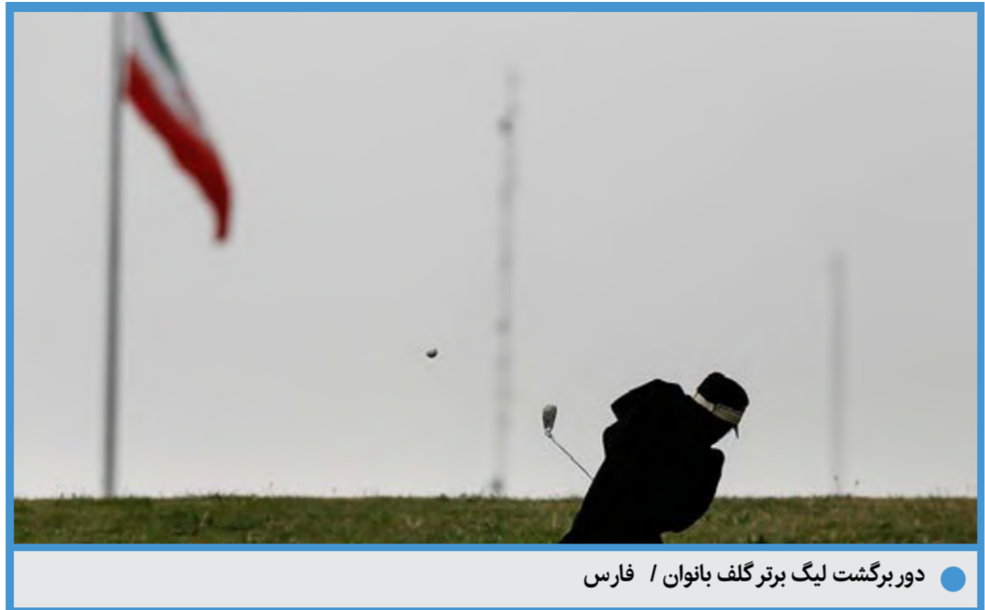
دور برگشت لیگ برتر گلف بانوان / فارس