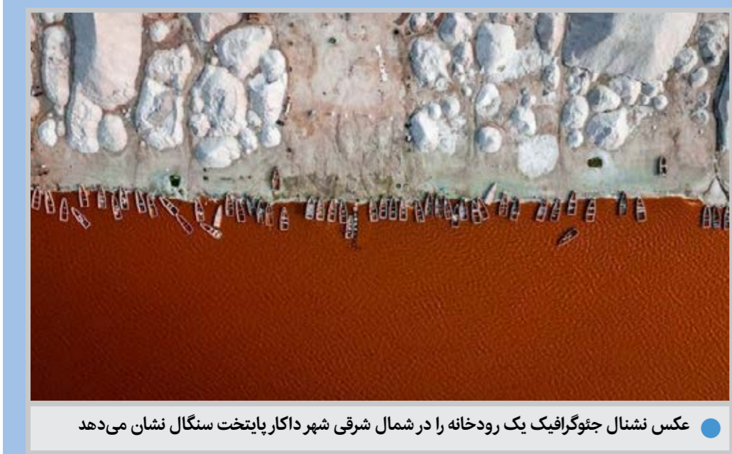
عکس نشنال جئوگرافیک یک رودخانه را در شمال شرقی شهر داکار پایتخت سنگال نشان می دهد