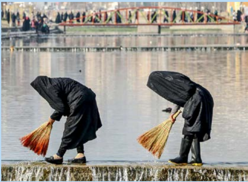
آیین «نو اوستی» در اردبیل