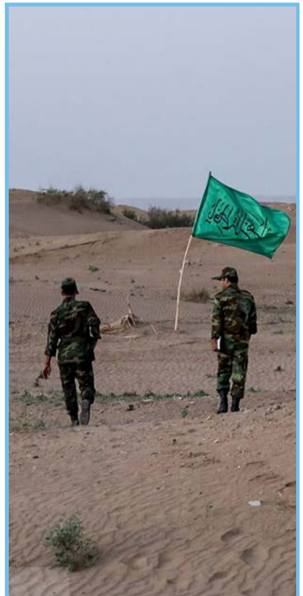
بازدید از مناطق عملیاتی ارتش در دفاع مقدس