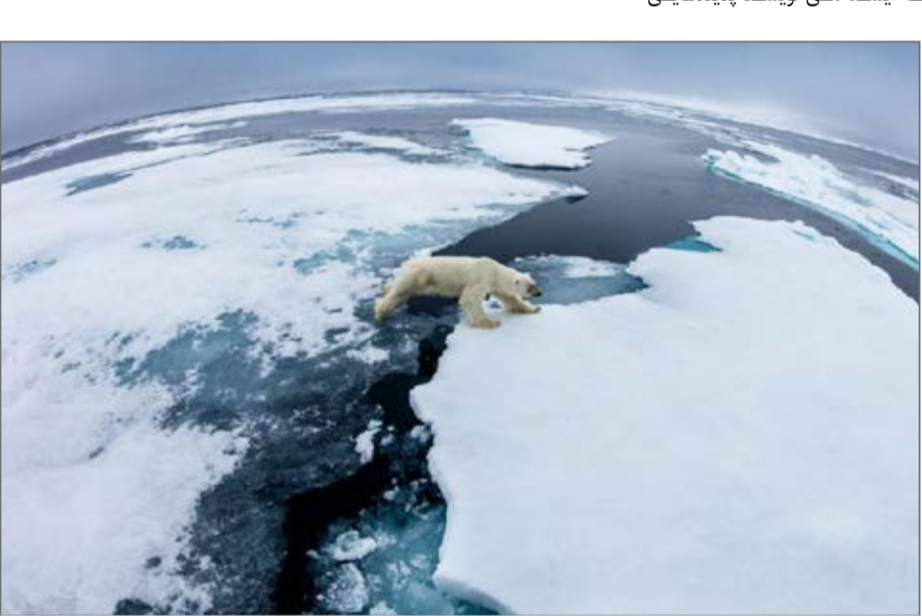
با روند رو به افزایش گرمای جهانی، گیاهان و جانوران در معرض نابودی قرار می گیرند

چون گرم تر شدن روزها، افزایش دوره زمانی خشکسالی و وقوع طوفان های شدیدتر در حال تبدیل شدن به شرایط طبیعی جدید هستند و به طبع گونه های سراسر جهان تحت تاثیر این تغییرات قرار گرفته اند. در گزارش صندوق جهانی طبیعت (WWF) آمده است: نزدیک به ۸۰ هزار گونه گیاه و جانور در ۳۵ نقطه غنی از تنوع زیستی از جمله جنگل های استوایی آمازون، جنوب غرب استرالیا و ماداگاسکار در صورتیکه دمای جهانی افزایش یابد منقرض می شوند. این ۳۵ نقطه از جهان بر اساس تنوع و منحصر به فرد بودن گیاهان و جانوران موجود در آن ها انتخاب شده اند. به گفته کارشناسان شواهد حاکیست که اقدامات جهانی برای کاهش