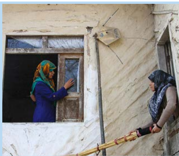
خانه تکانی و گل مالی در روستاهای ییلاقی مازندران