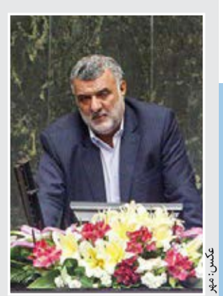
حجتی در کابینه ماند ۱۱۷ نماینده به استیضاح وزیر کشاورزی رای منفی دادند