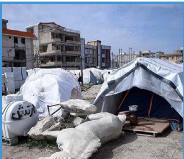
وضعیت زلزله زدگان سرپل ذهاب در آستانه نوروز