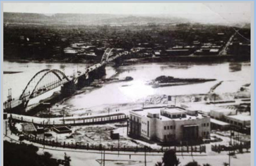
پل سفید اهواز سال ۱۳۵۲