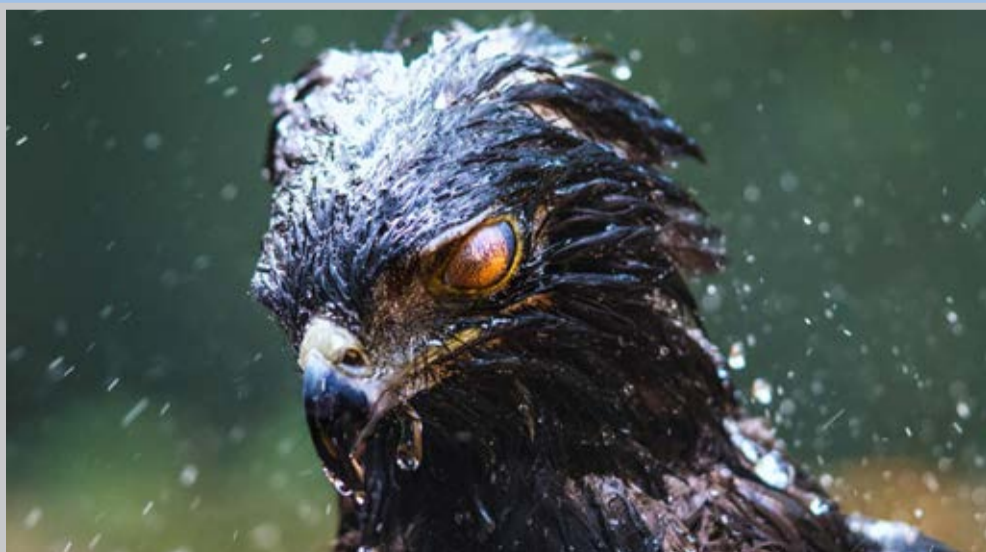
نشال جئوگرافیک عکس حمام گرفتن یک عقاب سر سیاه در آرژانتین را منتشر کرده است.