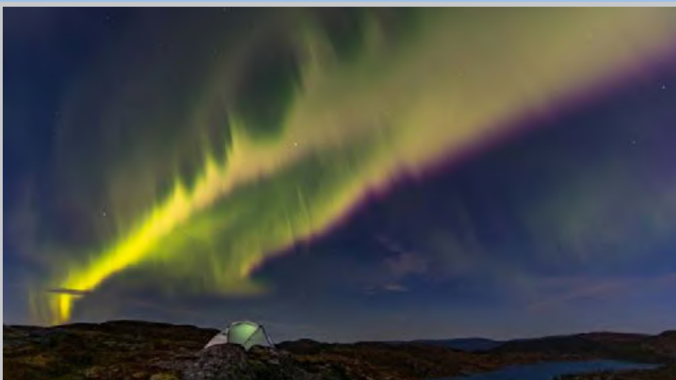
زیبایی های یک شب نورانی در عکس نشنال جئوگرافیک