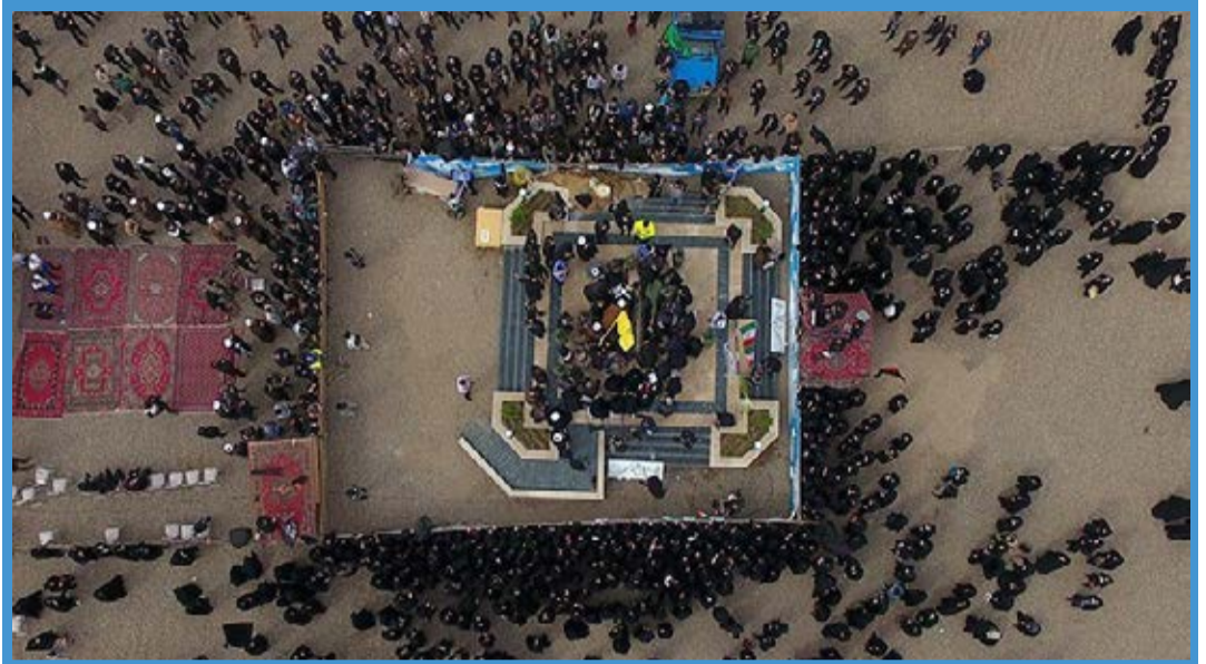
تشییع پیکر شهدای گمنام در قم