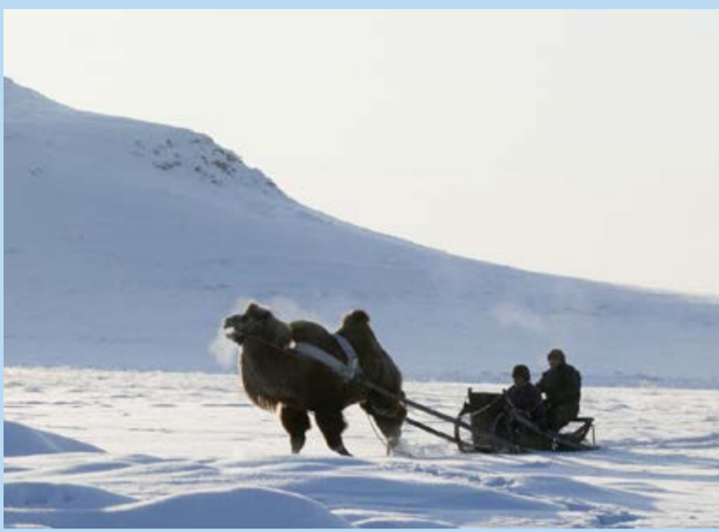
زندگی عشایری در سرمای سیبری