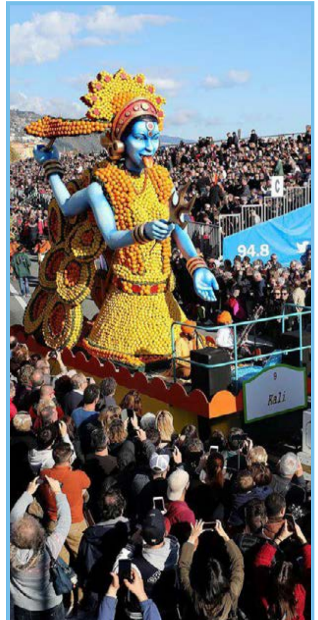
جشنواره مرکبات در فرانسه