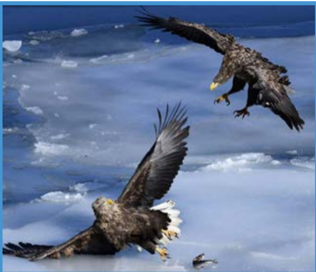
جنگ شکارچیان در خلیج زولوتوی راگ روسیه