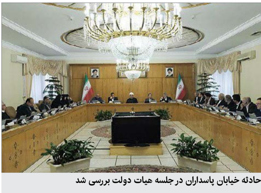
حادثه خیابان پاسداران در جلسه هیات دولت بررسی شد

مرکزی فراکسیون مستقلان ولایی (نزدیک به علی لاریجانی) هم هست با اشاره به جلسه غیرعلنی مجلس در این خصوص گفت که هیچ‌کدام از درویش مجروح نشدند. آن‌ها با شمشیر و قمه نیروهای انتظامی را زدند. او حادثه دوشنبه‌شب را این‌گونه روایت کرده است: «اتفاقی که افتاده از این‌قرار بود که نیروهای انتظامی در کلاتری گاندی به دو دستگاه خودروی پراید مشکوک شده و آن‌ها را تعقیب می‌کنند که در طول مسیر یکی از این دو دستگاه خودرو دچار نقص فنی شده و سرنشینان سوار پراید دیگر می‌شوند. هم‌زمان در فاصله چندساعته به کلاتری مراجعه می‌شود که خودرویی به سرعت رسیده و نیروهای انتظامی متوجه می‌شوند این خودرو همان خودرویی بوده که دچار نقص فنی شده است. در نتیجه یکی از سارقین که از درویش بوده را بازداشت می‌کنند. در ادامه تعداد دیگری از درویش به حمایت از درویش سارق برخاسته و با تجمع مقابل کلاتری خواستار آزادی فوری او می‌شود که این مساله در ادامه منجر به باقی درگیری‌ها می‌شود.» به اعتقاد این نماینده «درویش در این قضیه از حلم نظام سوءاستفاده کردند.» او