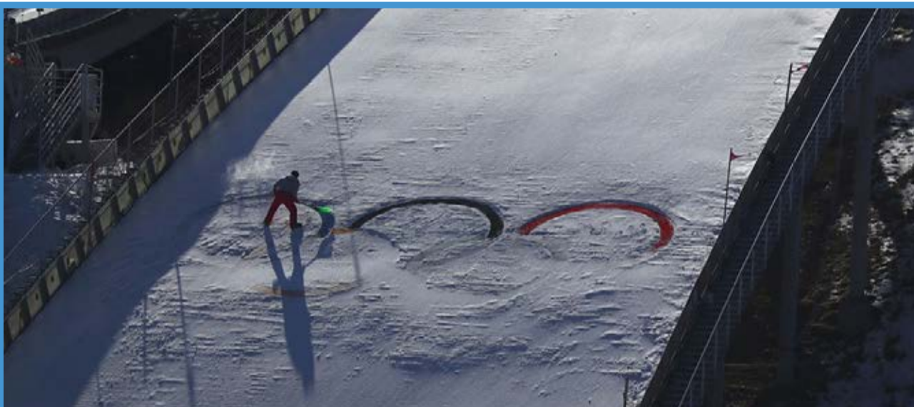
المپیک زمستانی ۲۰۱۸ پیونگ چانگ / باشگاه خبرنگاران جوان