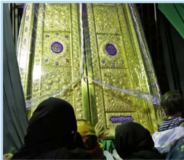
رونمایی از درهای حرمین عسکریین در بندرعباس